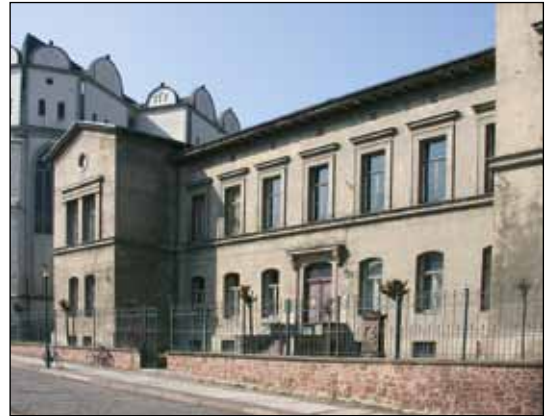
Abb. 1: Das Gebäude am Domplatz 4 in Halle ist der Standort des ZNS.

Das ZNS hat die Aufgabe, die Sammlungsbestände zu bewahren, zu pflegen und zu vermehren sowie Forschung in den sammlungsrelevanten Bereichen der Zoologie, Eozän-Paläontologie und Haustierkunde durchzuführen. Dazu wird das Gebäude am Domplatz 4