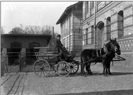
Abb. 4: Fotoglasplatte aus der Haustierkundlichen Sammlung „Julius Kühn“ (spätes 19. und frühes 20. Jahrhundert).

Die Forschungsthemen der Mitarbeiter des ZNS sind breit gefächert. Daraus ergibt sich auch ein wissenschaftliches Netzwerk der Zusammenarbeit, das alle