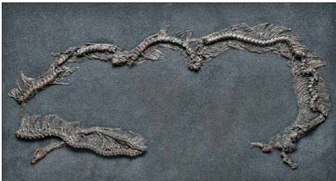
Abb. 3: Würgeschlange (ca. 2,50 m, 243 Wirbel und Kopf), Lackfilmpräparat aus der Geiseltalsammlung des ZNS.

Schleichen, Leguane und Baumeidechsen gefunden werden. Als weitere Besonderheiten der Fossilfunde im Geiseltal gelten der geologisch älteste Beleg von Straußenvögeln ( Palaeotis ) und der ca. 1,80 Meter große Riesenlaufvogel Diatryma ( Gastornis ). Bei den Säugetieren konnten 14 Arten von Paarhufern, wie das ferkelgroße Anphiragatherium , bei den Tapir- und Pferdeartigen Lophiodon , das größte Säugetier im Geiseltal und außerdem schäferhundgroße Urpferde geborgen werden. Das vollständig erhaltene Skelett von Propalaeotherium isselanum ist zugleich das Wappentier der Sammlung. Von diesem existiert bereits eine dreidimensionale Skelettrekonstruktion in natürlicher Größe. Knochenfunde eines Ameisenbären sind ebenso bemerkenswert wie die Erhaltung von grünem Blattfarbstoff bei den Pflanzenfossilien.