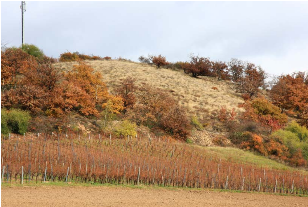
Abb. 2: Blick von Süden auf das Naturdenkmal „Auf dem Bäder“. Das Zentrum des Gebietes wird von einer subatlantischen Ginsterheide besetzt.