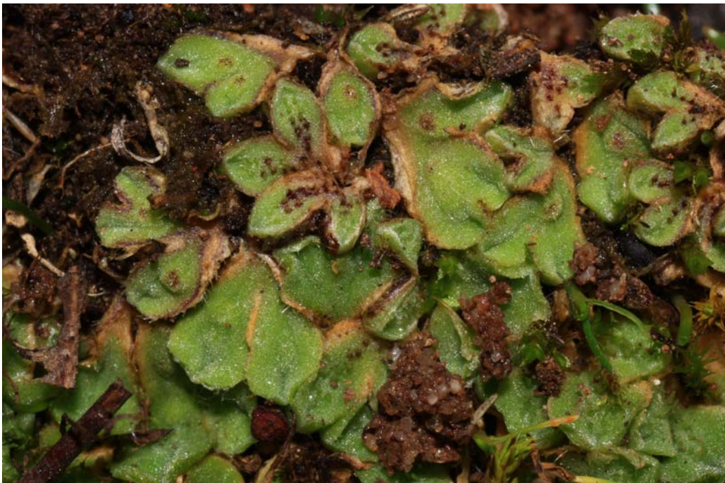
Abb. 4: Das Lebermoos Riccia ciliifera im Naturdenkmal „Auf dem Bäder“ bei Bad Kreuznach. Die Art ist diözisch, die männlichen Thalli sind durch schwärzliche, in Reihen angeordnete Antheridien gekennzeichnet, auf den weiblichen Thalli sind vereinzelt Sporangien auf der Thallusoberfläche zu erkennen.

Die trockenen, sauren und überwiegend nährstoffarmen Böden des Untersuchungsgebietes bieten nur wenigen Arten zusagende Lebensbedingungen. Von den insgesamt 24 Spezies der Felstroekenrasen war Polytrichum piliferum die häufigste Art, gefolgt von Ceratodon purpureus . Alle anderen Arten müssen als zerstreut bis selten angesprochen werden. Hervorzuheben sind die von LUDWIG et al. (1996) als gefährdet bezeichneten Bryum elegans , Rhynchostegium megapolitanum und Riccia ciliifera . Die Verbreitung von R. ciliifera im Naheraum hat zuerst KORNECK (1961b) untersucht. CASPARI (2004) stellte im Rahmen seiner Arbeit über gesteinsbesiedelnde Moose im Saar-Nahe-Bergland einen sehr starken Rückgang dieses Steppenmooses fest und hat es im Jahre 1998 vergeblich im Untersuchungsgebiet gesucht. Dort hat es KORNECK (1961b) entdeckt. Derzeit existiert noch eine kleine Population, die wohl auch