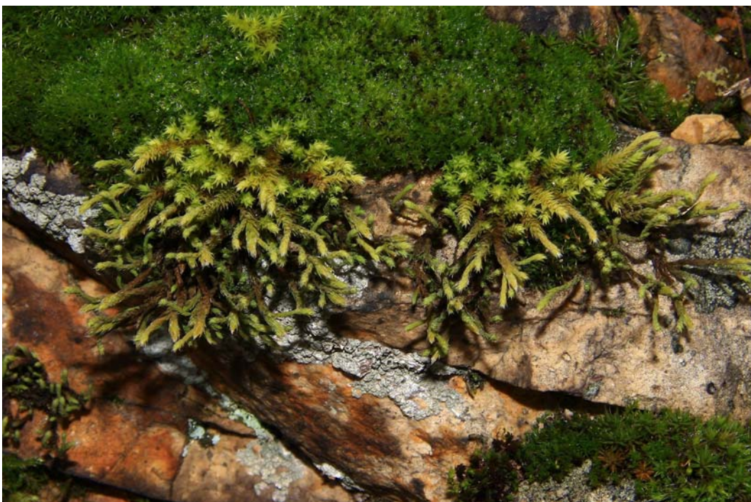
Abb. 3: Die subboreale Hedwigia ciliata im Naturdenkmal „Auf dem Bäder“ bei Bad Kreuznach.