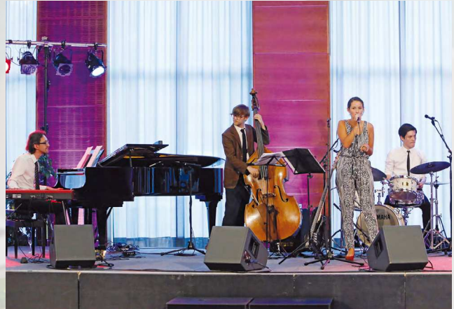
Das junge SRS Quartett begeisterte das Publikum.