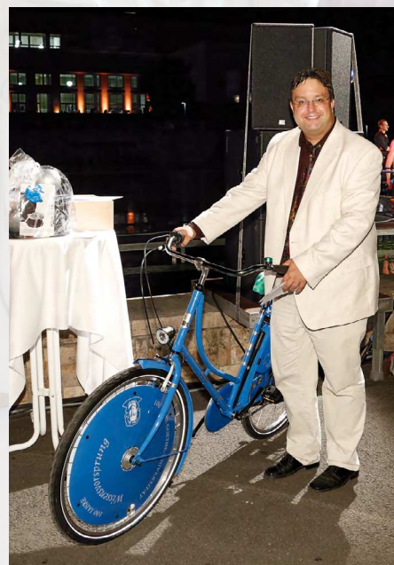
Glücklicher Gewinner des Goethe-Fahrrads.