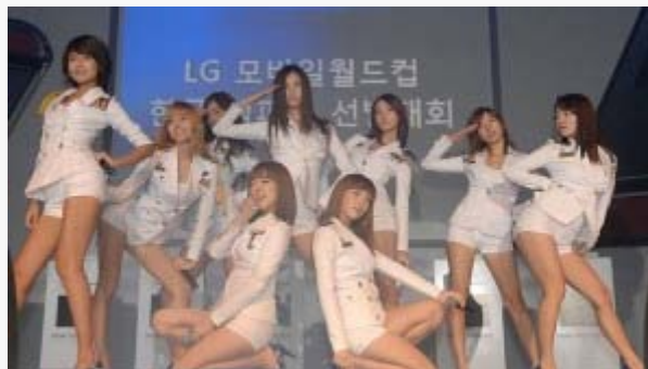
Koreanische Außenpolitik [1]

Dramas (Fernsehserien) wie Winter Sonata oder Boys Over Flowers, die im asiatischen Ausland große Erfolge feierten ist dies inzwischen zunehmend auch koreanische Popmusik: K-Pop.