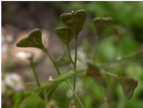
Abb. 1: Die Früchte von Capsella cuneifolia ALMQ. sind meist etwa so lang wie breit (Bleiberger Straße, Aachen/NRW, 04.05.2006,).