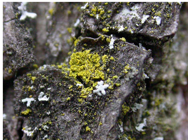
Abb. 4: Candelaria pacifica (Domplatz, Münster/NRW, 18.03.2012,).