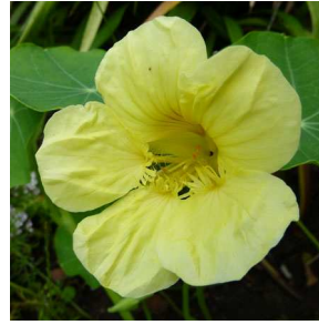
Abb. 9: Tropaeolum majus mit gelben Blüten.