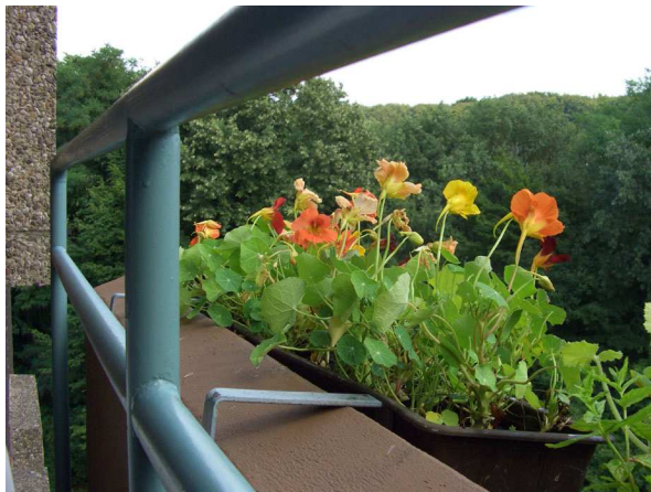
Abb. 1: Tropaeolum majus (Große Kapuzinerkresse) in einem Balkonkasten (Bochum, Roncalli-Haus).

Tropaeolum ist die einzige Gattung innerhalb der Familie der Kapuzinerkressengewächse ( Tropaeolaceae ). Diese sind jedoch nah verwandt mit den Kreuzblütengewächsen ( Brassicaceae ), zu denen Kresse, Radieschen oder Meerrettich, aber auch das asiatische Wasabi gehören. Gemeinsam sind beiden Familien Senfölglykoside als scharf schmeckende Inhaltsstoffe, weshalb Kapuzinerkresse gut mit Salaten (z. B. mit Radieschenscheiben) oder deftigen Speisen harmoniert.