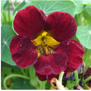
Abb. 7: Tropaeolum majus 'Black Velvet' (A. JAGEL).