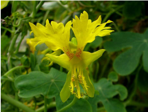
Abb. 3: Tropaeolum peregrinum (Kanarische Kapuzinerkresse), Blüte (V. M. DÖRKEN).