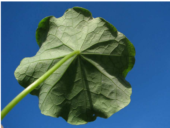
Abb. 15: Tropaeolum majus (Große Kapuzinerkresse), Schildblatt von unten (V. M. DÖRKEN).

Morphologisch bemerkenswert sind auch die Blätter der Kapuzinerkresse. Zunächst einmal ist ihre kreisrunde, schildartige Blattform, bei der der Blattstiel in der Mitte ansetzt, recht außergewöhnlich (Abb. 15). Einige andere Tropaeolum -Arten wie T. tuberosum oder T. peregrinum besitzen auch gelappte Blätter (Abb. 4).