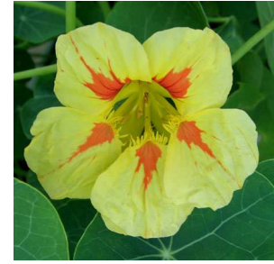
Abb. 10: Tropaeolum majus mit gefleckten Blüten (A. JAGEL).