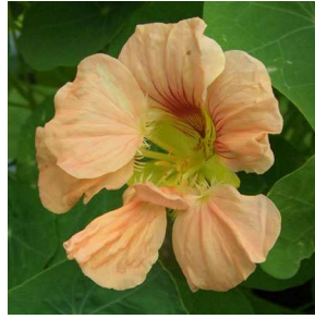
Abb. 8: Tropaeolum majus 'Lachs' (A. JAGEL).