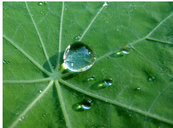
Abb. 16: Tropaeolum majus (Große Kapuzinerkresse), Lotuseffekt (A. HÖGGEMEIER).

Am Rand des Kapuzinerkressenblattes befinden sich Drüsen zur Ausscheidung von überflüssigem Wasser, die Hydathoden, eine Anpassung an die feucht-warme tropische Heimat. Besonders bei hoher Luftfeuchtigkeit, wenn die Transpiration durch die Spaltöffnungen nahezu zum Erliegen kommt, wird über die Hydathoden Wasser ausgeschieden, so dass auch weiterhin die Saugspannung in der Pflanze aufrecht erhalten wird und Nährstoffe aus dem Boden aufgenommen werden können.