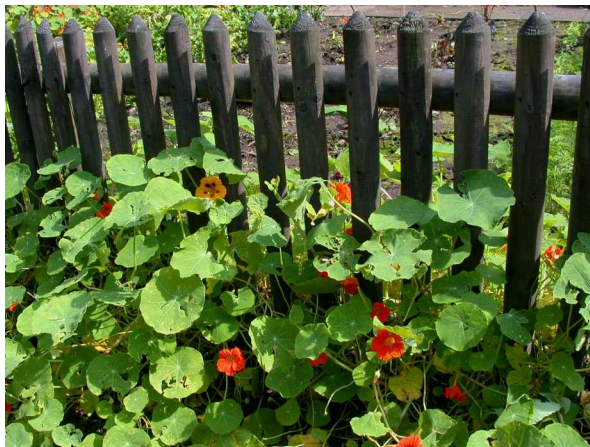
Abb. 17: Tropaeolum majus (Kapuzinerkresse) in einem Bauerngarten (A. HÖGGEMEIER).

Tropaeolum majus ist eine klassische Art der Bauergärten. Dort erfüllt sie vielerlei Dienste – als Speise- und Arzneipflanze oder Bienenweide. Zudem soll sie einerseits Wühlmäuse und andere Schädlinge aus dem Garten fernhalten, andererseits Schädlinge wie den Kohlweißling anziehen und diese dadurch von anderen Nutzpflanzen wie Kohl ablenken. In modernen Bauergärten dient Kapuzinerkresse natürlich auch als Zierpflanze, wobei davon auszugehen ist, dass in ursprünglichen Bauergärten reinen Zierpflanzen kaum eine Bedeutung zukam.