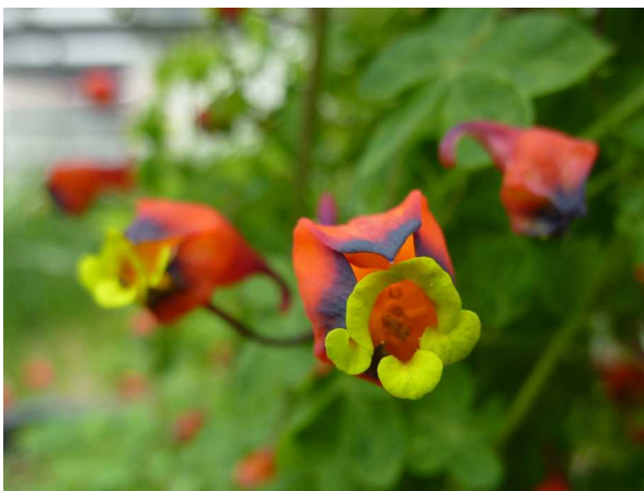
Abb. 5: Tropaeolum tricolor (Dreifarbige Kapuzinerkresse), Blüten (A. HÖGGEMEIER).