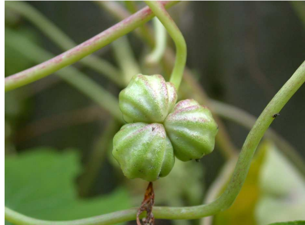
Abb. 14: Tropaeolum majus (Große Kapuzinerkresse), fast reife Frucht aus drei Teilfrüchten (A. HÖGGEMEIER).

Die Frucht der Kapuzinerkresse ist eine Spaltfrucht aus drei einsamigen, etwa 1 cm langen Teilfrüchten (Abb. 14). Die Ausbreitung erfolgt durch die Schwerkraft, indem die Teilfrüchte bei der Reife einfach herunterfallen, aber unter Umständen auch durch Verdriftung im Wasser, da die Frucht durch Lufteinschlüsse in der Fruchtwand schwimmen kann.