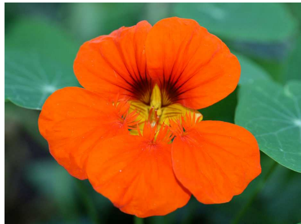
Abb. 2: Tropaeolum majus (Große Kapuzinerkresse), Blüte (C. BUCH).