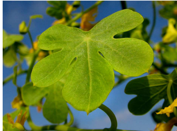
Abb. 4: Tropaeolum peregrinum (Kanarische Kapuzinerkresse), Blatt (V. M. DÖRKEN).