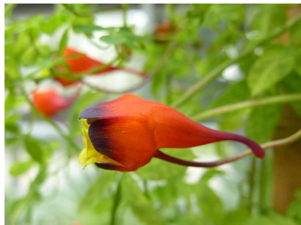
Abb. 6: Tropaeolum tricolor (Dreifarbige Kapuzinerkresse), Blüte (A. HÖGGEMEIER).

Tropaeolum majus stammt wie fast alle Arten der Gattung ursprünglich aus Südamerika und kommt von Peru bis Kolumbien vor. Natürliche Standorte sind vegetationsarme Felsfluren der Anden, meist siedelt die Art dort an kleinen Bächen (HEGI 1924). Unklar ist allerdings der Ursprung der bei uns heute kultivierten Sippe. Sie ist möglicherweise in Kultur hybridogen entstanden (DÜLL & KUTZELNIGG 2011). Besser dokumentiert ist ihre Karriere in Europa: So wurde die Kapuzinerkresse im Jahr 1684 aus Peru eingeführt. Nachdem die auf sonnigen und nährstoffreichen Standorten leicht zu kultivierende Art im Mittelalter bis ins 19. Jahrhundert in Gärten sehr beliebt und regelmäßig zu finden war, geriet sie später etwas in Vergessenheit. Im Zuge der Slowfood- und Bauerngarten-Bewegung der letzten Jahre, die auch anderen traditionellen Gemüsesorten wie Pastinak oder Schwarzwurzel zu neuer Beliebtheit verhalf, wurde schließlich auch die Kapuzinerkresse für die Küche wieder entdeckt.