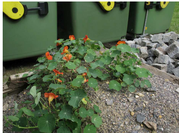
Abb. 18: Tropaeolum majus (Kapuzinerkresse), verwildert auf einem Kieshaufen in Bochum-Querenburg (30.07.2011,).