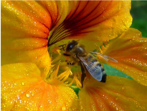
Abb. 13: Tropaeolum majus (Große Kapuzinerkresse), mit Honigbiene (A. HÖGGEMEIER).