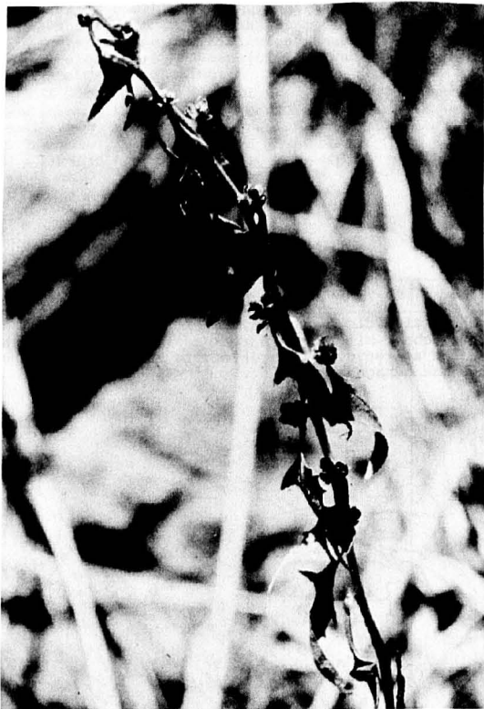
Abb. 2: Fruchtendes Chenopodium foliosum Asch., "Groß Band" im Bisistal.

Wie an vielen Wildlägern, so wächst auch hier Berberis vulgaris , ein Leckerbissen der Gemsen, weit abgetrennt vom Berberideteto-Rosetum der Täler und arg abgefressen inmitten der sonst in solcher Höhenlage nirgends so reichhaltig angetroffenen Nitratvegetation.