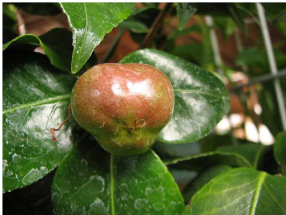
Abb. 9: Camellia japonica , unreife Kapsel Frucht (V. M. DÖRKEN).