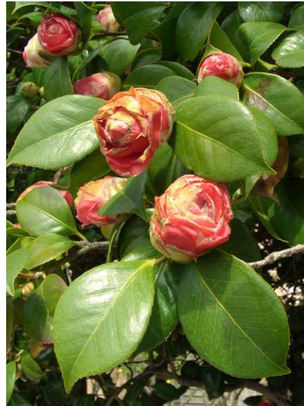
Abb. 12: Camellia japonica (Sorte), Frostschäden an Knospen (A. JAGEL).