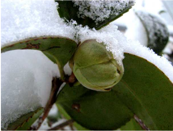
Abb. 3: Camellia japonica (Sorte), Blütenknospe mit Schnee (V. M. DÖRKEN).