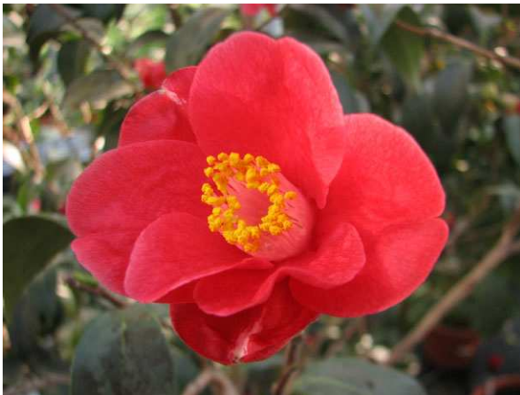
Abb. 5: Camellia japonica , Blüte der Wildform.

Die Blüten stehen endständig und meist einzeln, nur gelegentlich findet man zwei oder mehrere Blüten beisammen. Die im Durchmesser bis zu 5 cm breiten Blüten der Wildform der Japanischen Kamelie ( Camellia japonica , Abb. 5 & 6) sind kräftig rot gefärbt und erscheinen von (Februar-) März bis April (-Mai). Die Blüten haben 5-7 grüne Kelchblätter und ebenso viele Kronblätter. Auf die Kronblätter folgen zahlreiche Staubblätter mit leuchtend weißen bis cremefarbenen Staubfäden. Diese sind entweder bis zur Hälfte, zumindest aber an der Basis zu einer Röhre verwachsen. Der oberständige Fruchtknoten ist 3- (bis 5-) fächerig. Der Griffel ist lang und ragt etwas über die Staubblattröhre hinaus. Er endet in 3 (-5) Narbenästen.