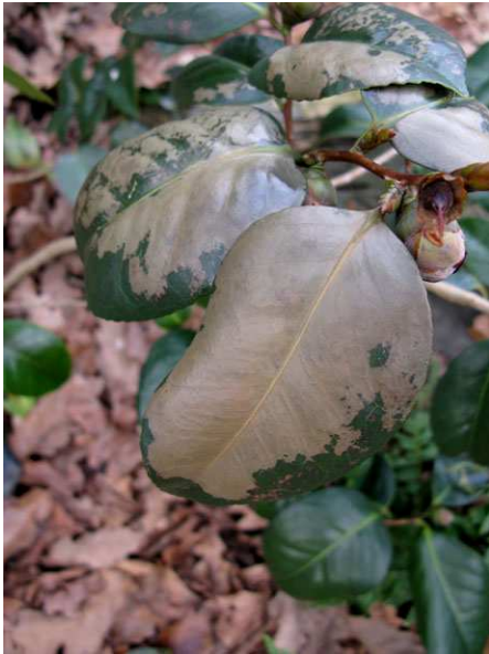
Abb. 11: Camellia japonica (Sorte), Frostschäden an Blättern.