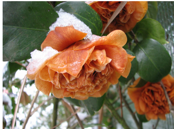
Abb. 14: Camellia japonica (Sorte), frostgeschädigte Blüte der Pflanze in Abb. 13, die Blüte ist ausgefärbt.

Bei der Kultur ist einiges zu berücksichtigen, damit die Pflanzen sich gut entwickeln und zur Blüte gelangen. Der Boden muss gut durchlässig sein, der optimale pH-Wert liegt zwischen 4,5 und 5 (zum Beimischen eignet sich Rhododendron-Erde). Der Standort sollte lichtschatig bis schattig sein. Die Pflanzen müssen unbedingt vor Wintersonne und austrocknenden Ostwinden geschützt werden. Außerdem kann man die Pflanzen im Freiland durch einen Winterschutz, z. B. Abdecken des Wurzeltellers mit Mulch, Stroh, Laub oder Vlies schützen. In besonders rauen Lagen müssen auch die oberirdischen Pflanzenteile zusätzlich mit Schilfmatten oder Vlies vor Kälte geschützt werden. Im Freiland empfiehlt sich vor und nach Frösten ausreichend zu wässern, um Schäden durch Frosttrockenheit vorzubeugen.