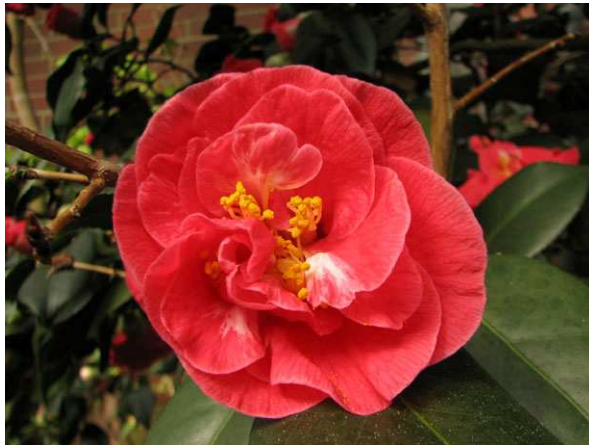
Abb. 1: Camellia japonica 'Bealei Rosea' mit halbgefüllter Blüte (V. M. DÖRKEN).

Kamelien haben ausgesprochen attraktive Blüten und blühen im Winter, weswegen man sie auch "Rosen des Winters" nennt. Bei den Kamelien, die bei uns im Gartenhandel angeboten werden, handelt es sich in den meisten Fällen um Sorten der Japanischen Kamelie ( Camellia japonica ). In Ostasien fand die Art in der Gartenkultur als Blütensolitär schon sehr lange Verwendung, bevor sie Anfang des 18. Jahrhunderts auch nach Europa gelangte. In den letzten Jahren werden Kamelien zunehmend auch in deutschen Gartencentern und sogar im Sortiment von Lebensmitteldiscountern angeboten. Neben Camellia japonica und deren Sorten (Abb. 1) haben auch Camellia hiemalis , Camellia oleifera , Camellia sasanqua (Abb. 2) sowie viele Hybriden eine größere Bedeutung.