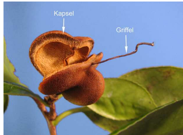
Abb. 10: Camellia japonica , reife, sich klappig öffnende Kapsel Frucht.

Die Früchte der Kamelien sind stark verholzte Kapseln, die sich 2- bis 3-klappig öffnen (Abb. 9 & 10). Jede Kapsel Frucht enthält nur wenige, große Samen.