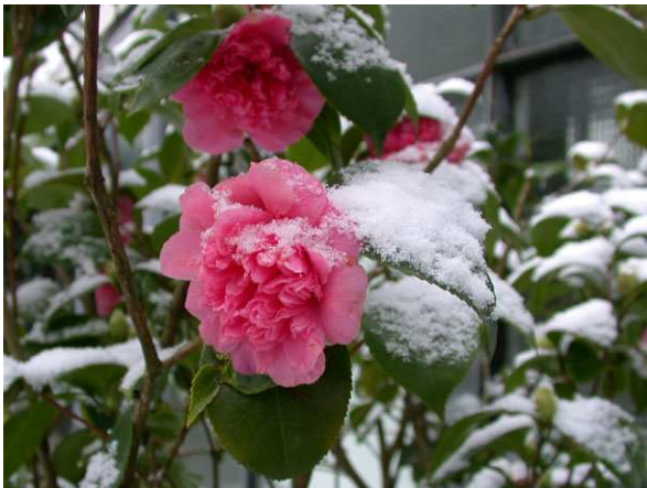
Abb. 13: Camellia japonica (Sorte), Blüte nach frischem Schneefall.