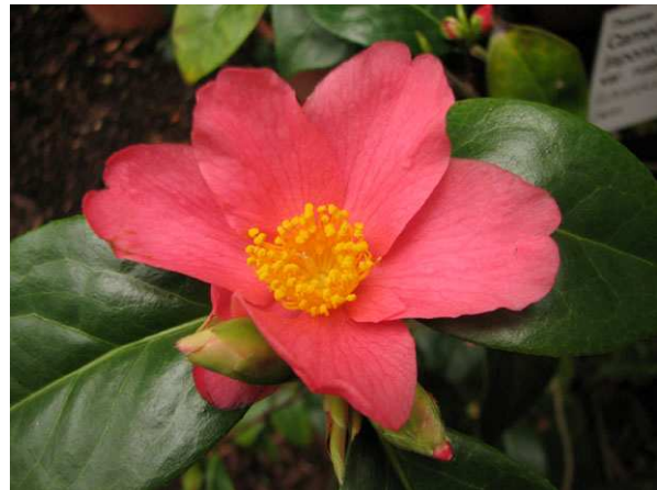
Abb. 6: Camellia japonica var. rustica , Blüte einer frosthärteren Varietät der Wildform aus Gebirgslagen Honshus/Japan (V. M. DÖRKEN).

Bei den Kamelien, die bei uns unter der Bezeichnung Camellia japonica angeboten werden, handelt es sich aber nicht um Wildformen, sondern durchweg um gärtnerische Züchtungen. So existieren neben Sorten mit unterschiedlicher Blütenfarbe und Blütengröße auch halb- bis