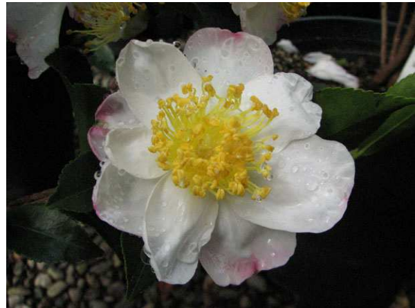
Abb. 2: Camellia sasanqua 'Hana Jiman' (V. M. DÖRKEN).