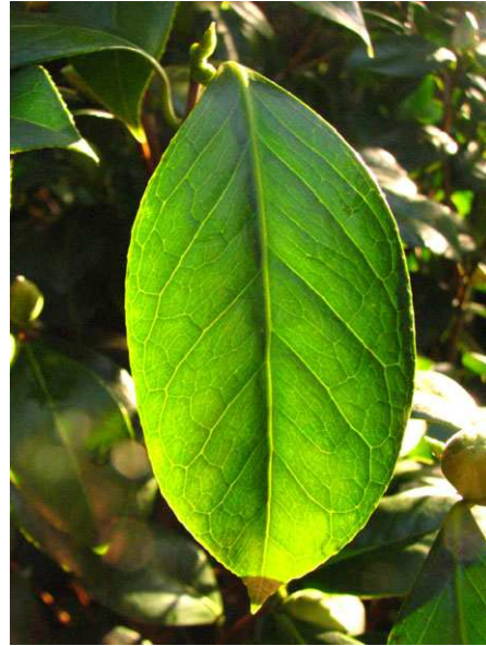
Abb. 4: Camellia japonica (Sorte), Blatt (V. M. DÖRKEN).

Die immergrünen, derb-ledrigen, beiderseits kahlen Blätter sind wechselständig angeordnet. Sie sind oberseits glänzend-dunkelgrün, unterseits heller. Bei Camellia japonica ist der Rand der breit eiförmigen bis eilänglichen Blätter mehr oder weniger stark gezähnt. Der Blattstiel ist kurz, die Blattbasis ist keilförmig (Abb. 4).