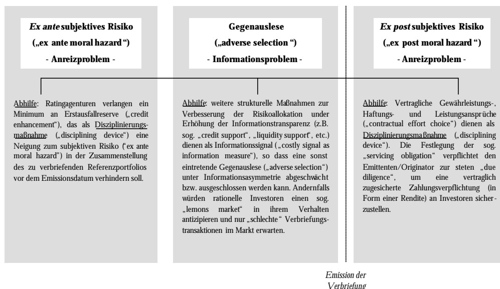
Abb. 2. Informationsprobleme in der Kreditverbriefung

vordringlich, um welche Kreditqualität, sondern um welche Art der Kreditqualität (d.h. Portfolioqualität) – Determinanten der Assetkorrelation und der Diversifizierungsgrad sind hier entscheidend – und welche Transaktionsstruktur es sich handelt. 5 Somit ist die Gestaltung der Kreditverbriefung (und dessen Berücksichtigung systemischen Risikos) eine der Kernfragen des Bewertung der Marktfähigkeit von Krediten und deren Auswirkungen auf die Finanzmarktstabilität.