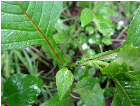
Abb. 3: Persicaria nepalensis, geflügelte und stängelumfassende Blattstiele (23.06.2015,).