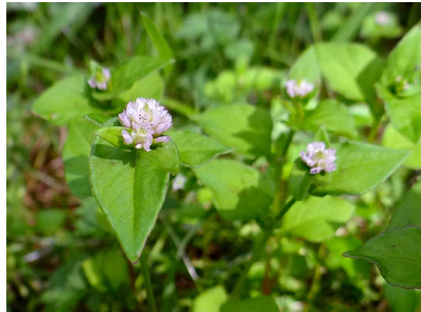
Abb. 2: Persicaria nepalensis, blühende Pflanzen (15.06.2014,).