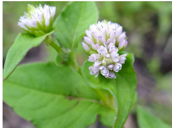
Abb. 4: Persicaria nepalensis, kopfiger Blütenstand (15.06.2014,).