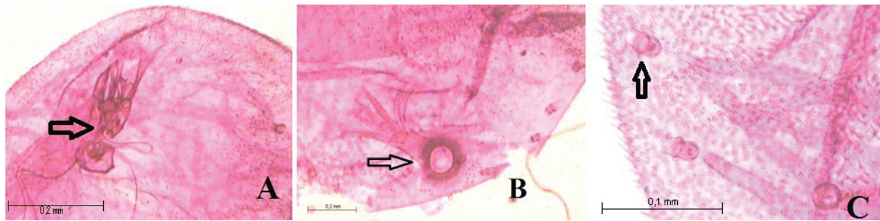
Figura 2. Stigmacoccus paranaensis (estado de quiste en microscopio). A. Región anterior, aparato bucal. B. Región posterior, abertura anal asociado con tubo anal. C. Región lateral del cuerpo, espiráculos abdominales.