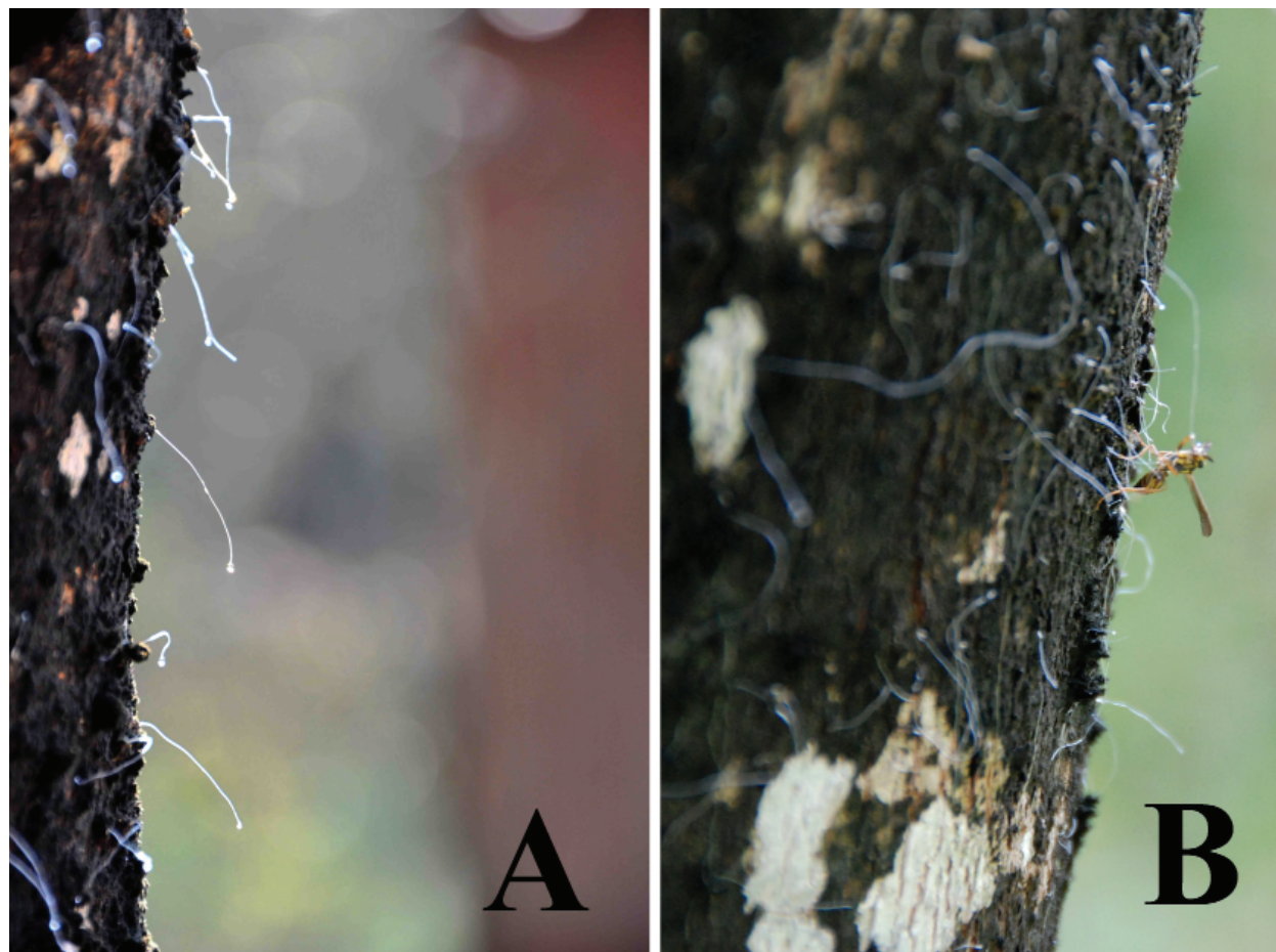
Figura 1. Stigmacoccus paranaensis en tronco de M. scabrella . A. Pelos blancos largos que parten de los quistes. B. Himenóptero alimentándose de mielato, exudado del insecto escama.