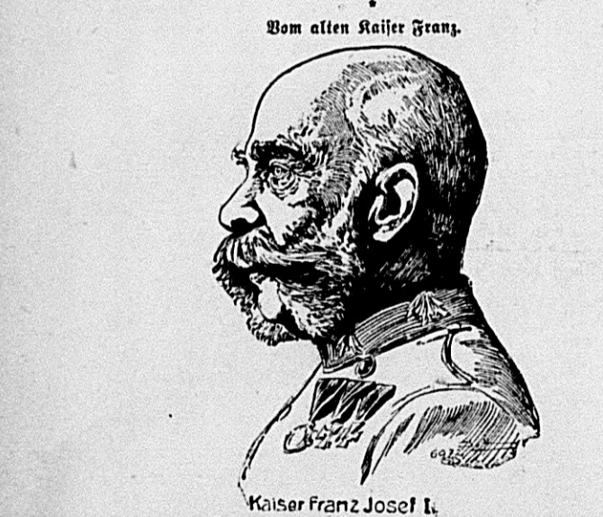
Kaiser Franz Josef I.

Wien, 25. Juli. Die belgischen Blätter des Tages: Der Tribüne, der Morgen und der Abend, haben sich in der letzten Nummer über den Konflikt zwischen Oesterreich-Ungarn und Serbien geäußert.