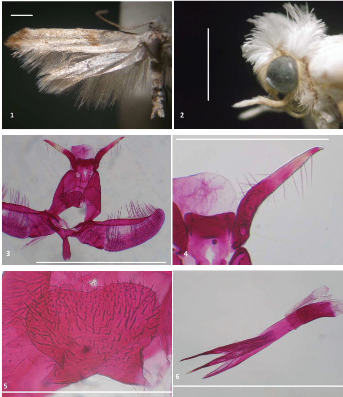
Figuras 1–6. Kessleria ematynus nov. sp. 1. Alas holotipo macho, vista dorsal. 2. Cabeza paratipo hembra vista lateral. 3. Genitalia masculina paratipo macho. Escala: 1 mm (1, 2, 3). 4. Detalle del uncus y socii paratipo macho. Escala: 0.5 mm. 5. Placa ventral del gnathos paratipo macho. Escala: 0.1 mm. 6. Phallus paratipo macho. Escala: 0.5 mm.