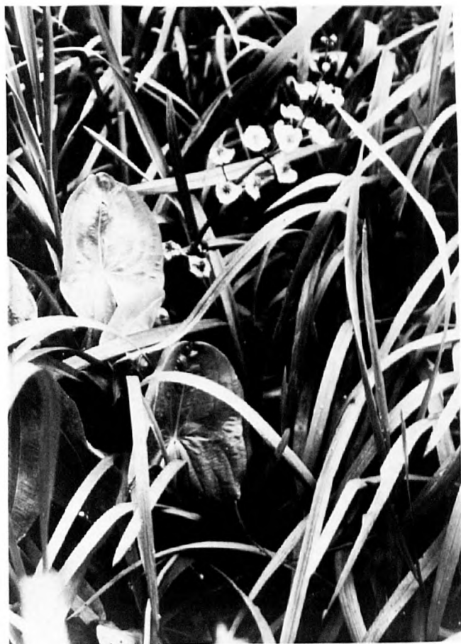
Abb. 2: Blühendes Breitblättriges Pfeilkraut ( Sagittaria latifolia ) im Wasser- schwaden-Röhricht

Anpassung an geringeren Lichtgenuß oder größere Luftfeuchtigkeit (Vorteil der größeren Transpirationsfläche). Ich möchte jedoch auf ein Problem aufmerksam machen, was mit dieser Art der schnellen Begriffsbildung zu tun hat. Ob die oben genannte Erklärung mit dem Begriff der Anpassung richtig oder falsch ist, sei dahingestellt; es geht um etwa anderes.