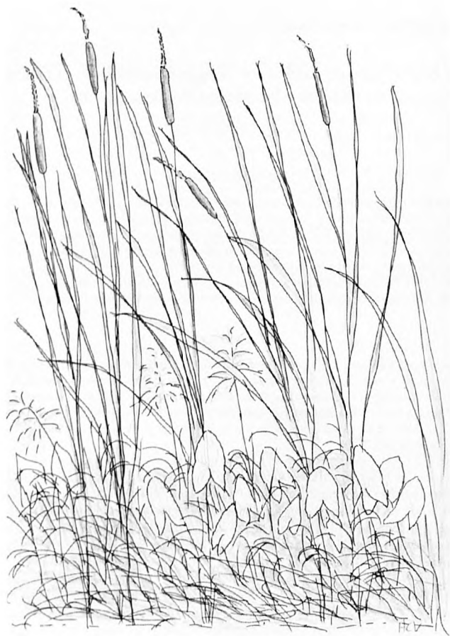
Abb. 1: Feldskizze des Wasserschwaden-Röhrichts ( Glycerium maxmae ) mit viel Breitblättrigem Rohrkolben ( Typha latifolia ) und Breitblättrigem Pfeilkraut ( Sagittaria latifolia ). Kleine Bucht am Segelbootsteg an der Alten Moorhütte, Nordufer Steinhuder Meer. Höhe des Profils 2,50 m. Ort der Vegetationsaufnahme 7. August 1990. Orig.

Aufgrund der unterschiedlich ausgebildeten Blattformen war es uns zuerst fast unmöglich, die Sagittaria latifolia von der stellenweise mit ihr zusammenwachsenden Sagittaria sagittifolia zu unterscheiden. Kein Problem machten in dieser Beziehung die breiten Riesenblätter (Abb. 3f): Sie gehörten ausnahmslos zu Sagittaria latifolia . Bei allen anderen Formen wurde es jedoch sehr schwierig. Als einzig sicheres Unterscheidungsmerkmal erwies sich schließlich die Form des Blattstiels. Er ist bei Sagittaria sagittifolia relativ breit, 3- bis 5eckig und trägt scharf hervortretende Kanten (Abb. 4 rechts). Bei Sagittaria latifolia ist er viel schmäler und im Querschnitt mehr rundlich (Abb. 4 links).