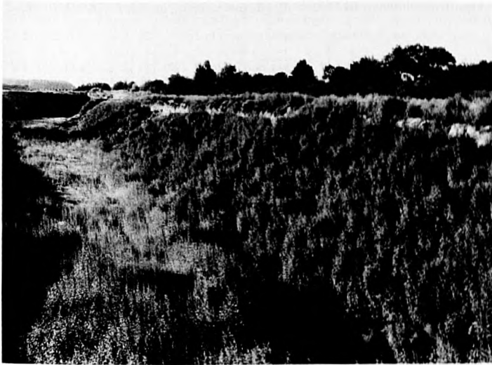
Abb. 3: Ausgedehnte Bestände des Lactuco-Atriplicetum sagittatae auf der Böschung und dem Grund einer Grube bei Roisdorf (Rhein-Sieg-Kreis). Das sandig-schluffige Substrat ist möglicherweise autochthon. Die Pflanzen im Vordergrund unten erreichten bis zu 3 m Höhe. (5.8.92)