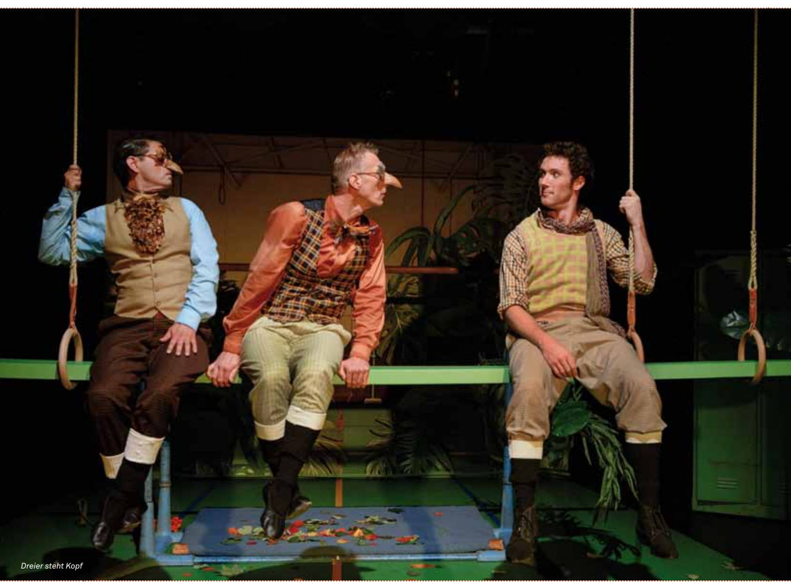
Dreier steht Kopf

▶▶▶ Auf Anfrage bieten wir zu unseren Stücken ein Nachgespräch an. Anmeldung unter Tel. 0621 1680 302