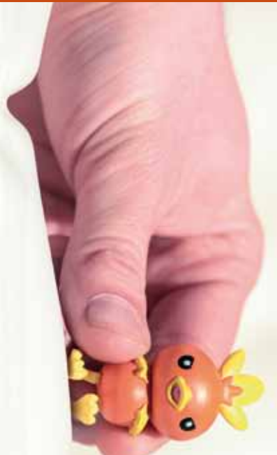
Das Spielzeug schlägt zurück II

Alte Feuerwache am Alten Messplatz Brückenstraße 2 68167 Mannheim Kartentelefon: 0621 1680 302 jungesnationaltheater@mannheim.de www.nationaltheater-mannheim.de