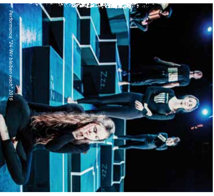
Performance "24-111 bleiben wach" 2016