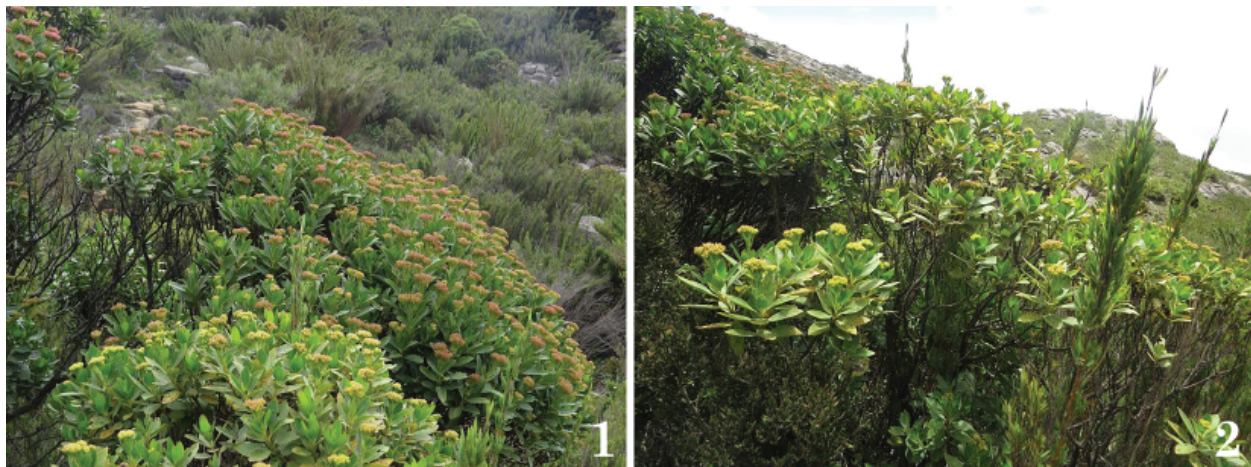
Figuras 1–2. Hábitat de Conognatha (Pithiscus) caparaoensis , Pico da Bandeira, Brasil.