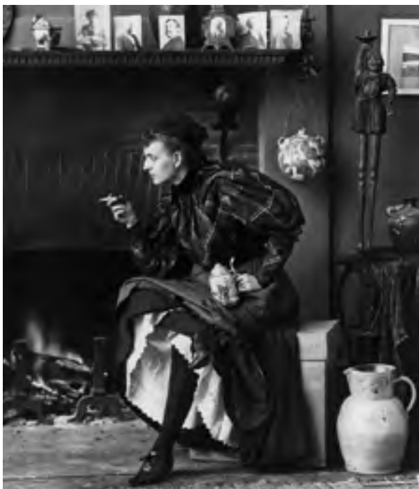
Cornelia Goethe Colloquien Sommersemester 2015