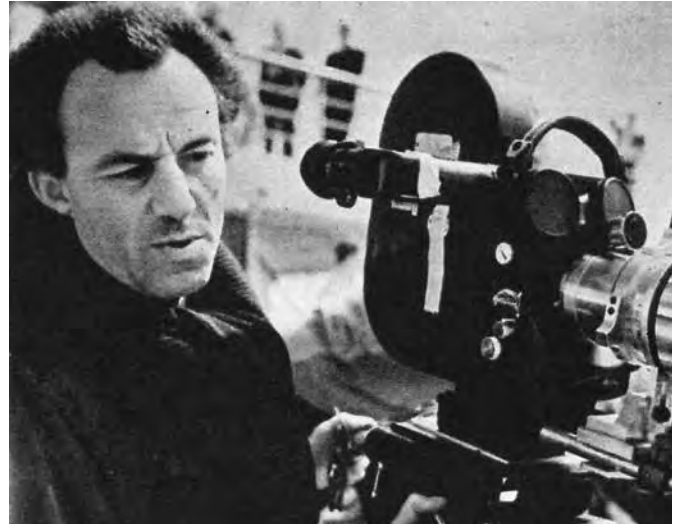
Andrzej Munk bei den Dreharbeiten, aus: Andrzej Munk, Warschau: Wydawnictwa Artystyczne i Filmowe 1964 © FilMOTEKA Narodowa

Die Wiederaufnahme der Oper Die Passagierin wird von dem gleichnamigen Film des polnischen Regisseurs Andrzej Munk aus dem Jahre 1963 begleitet. Grundlage von Oper und Film ist der Roman Die Passagierin (1962) der polnischen Autorin Zofia Posmysz (*1923), die darin auf eindringliche Weise ihre Erlebnisse in den Konzentrationslagern Auschwitz-Birkenau und Ravensbrück schildert. Der Film blieb unvollendet, da Munk während der Dreharbeiten tödlich verunglückte.