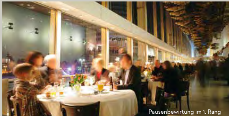
Pausenbewirtung im 1. Rang