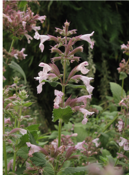
Abb. 23: Nepeta grandiflora 'Dawn to Dusk' (10.08.2010,).