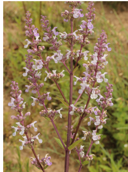
Abb. 11 & 12: Nepeta nuda (10.06.2013, BG Gießen,).

Sowohl die Echte Katzenminze ( Nepeta cataria ) als auch die Kahle Katzenminze ( N. nuda , die in NRW nicht vorkommt, Abb. 11–14) beschränken sich in ihrem Vorkommen auf trockenwarme Standorte. Erstere zeigt zudem eine Affinität zu mehr oder weniger nitrophilen Lebensräumen. Während beide Arten in Deutschland oft den thermophilen Verbänden