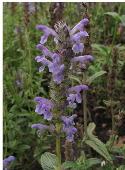
Abb. 21: Nepeta nervosa (10.08.2010,).