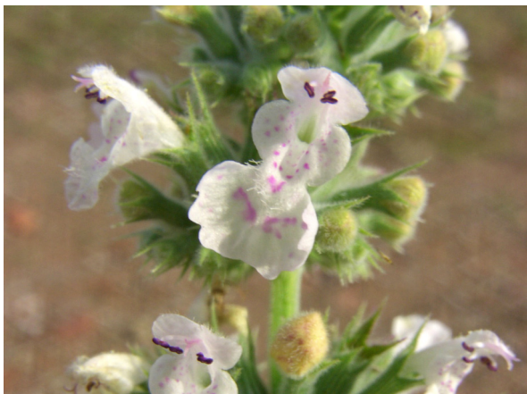
Abb. 1: Nepeta cataria (27.07.2005, Bielefeld,).

Schon lange findet man Nepeta cataria nur noch selten als Heilpflanze in Gärten und dementsprechend verwildert sie auch seltener. Sie kommt zwar heute noch vor, allerdings eher in Staudengärten. Gerade Katzenliebhaber haben die Art gerne im Garten, denn auf (viele) Katzen üben die Pflanzen eine geradezu magische Anziehungskraft aus. Diese Wirkung kann sich der Katzenbesitzer zu Nutze machen, um bei seinen Stubentigern gewünschte Verhaltensweisen auszulösen. Weitaus häufiger als N. cataria trifft man in Gärten und Balkonkästen heute auf Formen der Blauen Katzenminze ( Nepeta ×faassenii ), die ebenfalls verwildert und sich bereits an verschiedenen Stellen in NRW eingebürgert hat.