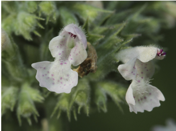
Abb. 3: Nepeta cataria , Blüten mit muschelförmiger, gefleckter Unterlippe, in männlichem Stadium, Griffel nicht zu erkennen (H. GEIER).

Die Blüten der Echten Katzenminze sind typische Lippenblumen. Merkmale der Art sind z. B., dass ihre Oberlippe nur ein wenig kürzer als die Unterlippe und die Kronröhre etwa so lang wie der Kelch ist oder ihn nur sehr wenig überragt (Abb. 4). Die Unterlippe ist charakteristisch muschel- bzw. schüsselförmig ausgebildet (Abb. 3). Die Blüten sind schmutzig weiß und haben rötliche Flecken und Punkte (Abb. 3 & 4), bei der var. citriodora sind die Blüten etwas größer, die Blüten reiner weiß (HEGI 1975). Die Pflanzen blühen bei uns in den Monaten Juli bis September, sind ausgeprägt vormännlich (protandrisch) und werden von Bienen und Hummeln (HEGI 1975), aber auch von Schmetterlingen bestäubt (Abb. 5).