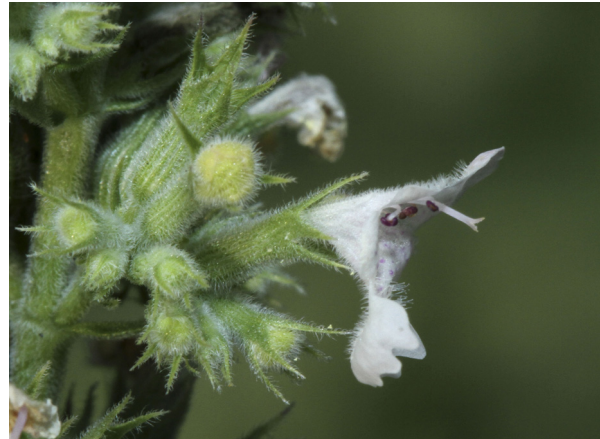
Abb. 4: Nepeta cataria , Blüte im weiblichen Zustand, Griffel herausgestreckt mit geöffneter Narbe (H. GEIER).