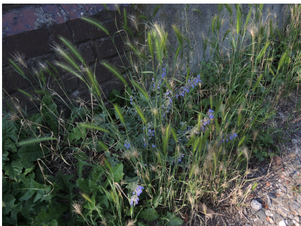
Abb. 30: Nepeta × faassenii, verwildert in Bochum-Wiemelhausen (13.08.2015,).