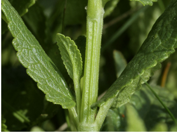
Abb. 13: Nepeta nuda , Stängel (H. GEIER).

Onopordion acanthii (und Arction lappae im Fall von N. cataria ) zugerechnet werden (vgl. etwa MUCINA 1981 für die nördliche Donautiefenebene), besiedelt N. nuda im pannonischen Raum trockenes Grasland und kann etwa in Rumänien als Kennart der Assoziation Festuco sulcatae-Brachypodietum pinnati gelten (Klasse Festuco-Brometea ), einer extrem artenreichen Pflanzengesellschaft auf halbtrockenen basenreichen Standorten (DENGLER 2012).