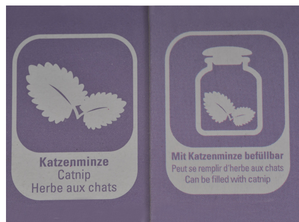
Abb. 19: Nepeta cataria , Catnip-Markierungen für Katzenminzen-Produkte (D. MÄHRMANN).