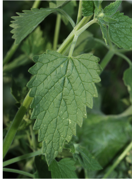
Abb. 8: Nepeta cataria , Stängelblatt, oberseits verkahlt (H. GEIER).