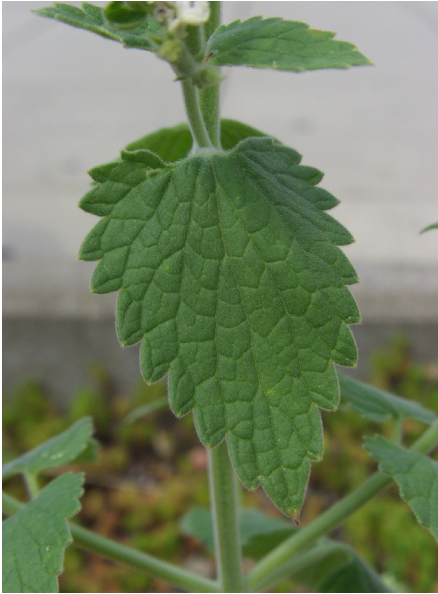
Abb. 7: Nepeta cataria , Blatt unterhalb des Blütenstandes.