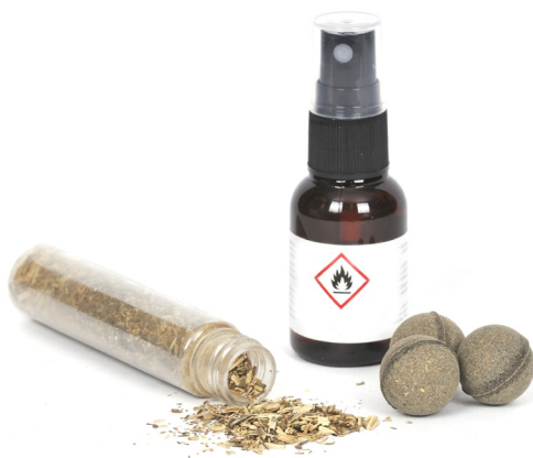
Abb. 18: Nepeta cataria , Katzenminze in Form von getrockneten Blättern, Bällchen und Spray für die Hauskatze.

Heute wird die Katzenminze für all diese Zwecke so gut wie nicht mehr verwendet und nur noch von Katzenbesitzern angebaut. Der Geruch der Pflanze zieht geschlechtsreife Katzen magisch an. Anders als beim Menschen hat die Katzenminze auf Katzen keine beruhigende Wirkung, sondern eine euphorisierende. Sie beginnen zu flehmen, knabbern mit großem Wohlbehagen an den Pflanzen und wälzen sich darauf herum. Dabei wirken die Pflanzen nur bei etwa jeder zweiten Katze. Sehr junge und sehr alte Katzen reagieren nicht, Kater stärker als Weibchen. Es macht also den Eindruck, dass es sich bei dem für die Wirkung zuständigen Nepetalacton um einen Stoff handelt, der einem Sexualpheromon der Katzen ähnelt (LINFORD 2007). Andererseits gibt es auch die Ansicht, dass die Wirkung als Aphrodisiakum ausgeschlossen werden kann, da auch kastrierte Kater auf die Pflanze reagieren. Neben unseren Stubentigern zeigen auch Großkatzen wie Tiger und Löwen eine Reaktion auf die Katzenminze, den sog. Catnip response (TUCKER & TUCKER 1988, GROGNET 1990). Untersuchungen an anderen Säugetierfamilien, unter anderem an den nahe verwandten Schleichkatzen ( Viverridae ), zeigten hingegen keine positive Reaktion (TUCKER & TUCKER 1988).