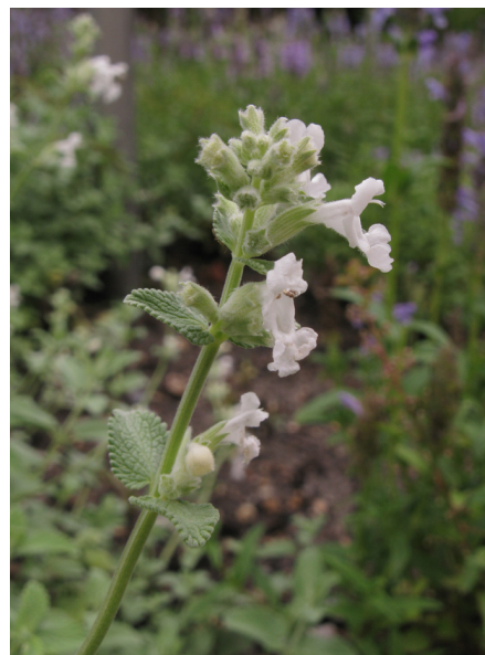
Abb. 31: Nepeta × faassenii 'Snowflake' (10.08.2010,).