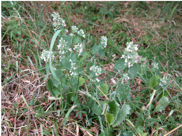
Abb. 16: Nepeta cataria im Mülheimer Hafen in Köln (09.08.2013,).

Einen Schwerpunkt der Vorkommen nahmen nun Ruderalflächen in den Städten ein, wie z. B. im Ruhrgebiet, wo auch heute noch reichlich offene Standorte vorhanden sind, an denen sich die Art ansiedeln kann – wenn Samen hierher gelangen. Woher die Pflanzen im Einzelnen stammen, ist oft nicht festzustellen. Als Heilpflanze wird sie heute nicht mehr gepflanzt. Als Zierpflanze für Pflanzenliebhaber und aufgrund ihrer Wirkung auf Katzen (s. Abschnitt 6) findet man sie aber doch noch hier und da. Und von dort aus kann sie verwildern. Wahrscheinlich wird die Art gelegentlich auch unbeabsichtigt bei Baumaßnahmen verschleppt. Wären Samen regelmäßig in klassischen Straßenrandsaatmischungen enthalten, würde man die Echte Katzenminze deutlich häufiger finden, als dies der Fall ist.