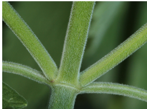
Abb. 6: Nepeta cataria , Stängelbehaarung (H. GEIER).

Die Stängel der Katzenminze sind, wie die gesamte Pflanze, dicht flaumig behaart (Abb. 6). Dies unterscheidet sie von der ebenfalls in Deutschland heimisch gewordenen Kahlen Katzenminze ( Nepeta nuda , Abb. 11–14). Auch die Blätter sind beidseitig behaart, verkahlen aber auf der Oberseite mit der Zeit. Die aromatisch (bei der var. citriodora zitronenartig) riechenden Blätter sind lang gestielt und grob gesägt (Abb. 7 & 8).