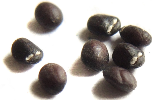
Abb. 10: Nepeta cataria , Nüsschen.