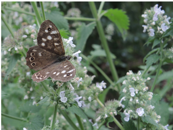
Abb. 5: Nepeta cataria mit Waldbrettspiel (02.08.2014, bei Bad Lippspringe,).