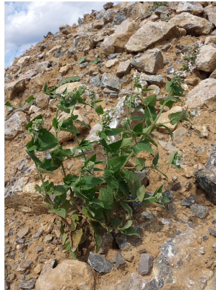
Abb. 17: Nepeta cataria in Attendorn (30.07.2017,).