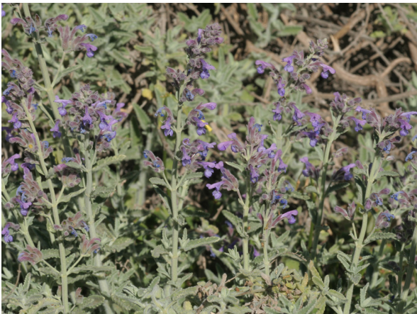
Abb. 24: Nepeta nepetella subsp. murica (23.03.2007, Cabo de Gata, Andalusien, Spanien,).