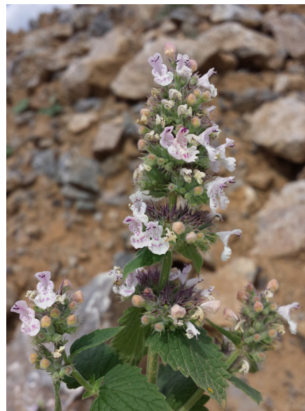
Abb. 2: Nepeta cataria (30.07.2017, Attendom,).