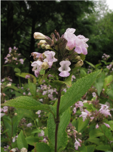
Abb. 22: Nepeta subsessilis 'Pink Dreams' (10.08.2010,).