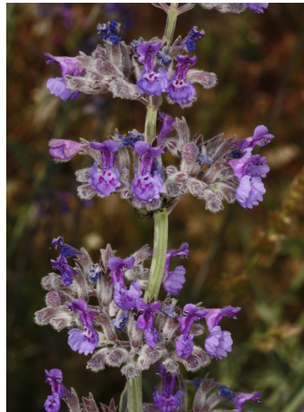
Abb. 25: Nepeta nepetella subsp. murica (El Torcal, Andalusien, Spanien, 29.05.2010,)