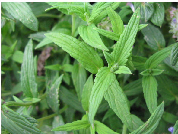
Abb. 20: Nepeta nervosa, Blätter (10.08.2010,).