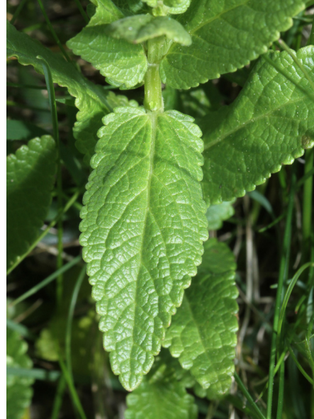
Abb. 14: Nepeta nuda , Stängelblatt (H. GEIER).