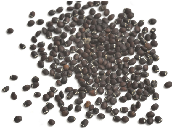
Abb. 9: Nepeta cataria , Nüsschen (D. MÄHRMANN).