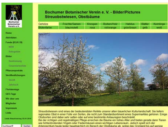
Abb. 1: Neue Bildseite „Streuobstwiesen, Obstbäume“ 29.03.2018 (Screenshot der Homepage am 31.12.2018).

Zwei neue Bilderseiten gingen online: „ Streuobstwiesen “ und „ Ansaatpflanzen “. Beide erfreuten sich einer ungeheuren Resonanz bei Facebook, innerhalb kurzer Zeit wurden laut Facebook-Statistik jeweils bis zu 3000 Personen erreicht. Laut Userstatistik unseres Servers wurden die Obstwiesen dann 2180 Mal wirklich angeklickt, die Ansaaten 1698 Mal.