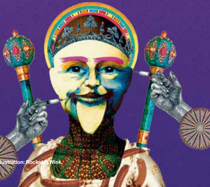
Illustration: Rocket & Wink

Uraufführung: 6/4/2019 / Schauspielhaus Weitere Vorstellungen: 9/4, 20/4, 24/4, 3/5, 14/5, 23/5, 16/6, 21/6, 22/6