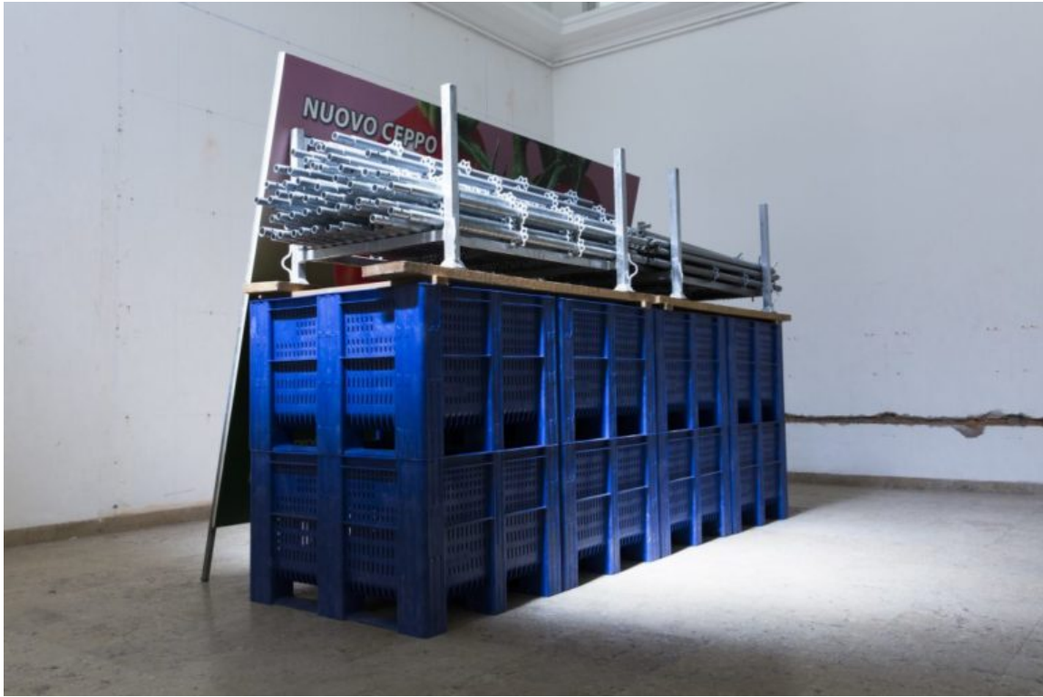
Natascha Süder Happelmann: Ankersentrum, German Pavilion 2019

es eine sehr lebendige, nahezu chaotische Szene in einer Schenke zeigt, die nicht den Konventionen der zeitgenössischen Abendmahl-Darstellungen entspricht.