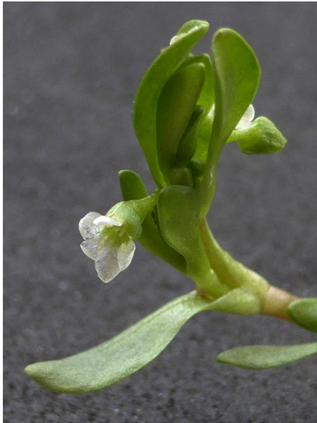
Abb. 55: Montia fontana subsp. amporitana in Olpe (J. KNOBLAUCH).

Hochsauerlandkreis, Olsberg (4717/13): ca. 1000 Pflanzen an einem Quellaustritt im NSG Sperrenberg nordwestlich Niedersfeld, 02.07.2019, D. WOLBECK. – Kreis Olpe, Attendorn (4813/13): etwa 100 Pflanzen am Quellbach auf einer Weide bei Keuperkusen, 02.08.2019, D. WOLBECK. – Kreis Olpe, Drolshagen (4912/43): wenige Pflanzen in Quellbereich auf einer Weide westlich Dirkingen, 06.07.2019, D. WOLBECK. – Kreis Olpe, Olpe (4912/44): ein Bestand von etwa 1 m 2 in einer beweideten Quellflur im oberen Schlehstiepen westlich Rüblinghausen, 17.05.2019, J. KNOBLAUCH.