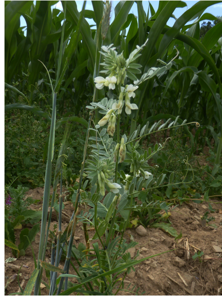
Abb. 86: Vicia pannonica in Benolpe (J. KNOBLAUCH).