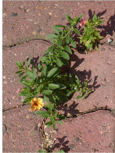
Abb. 14: Calibrachoa x hybrida in Bochum-Querenburg (H. HAEUPLER).