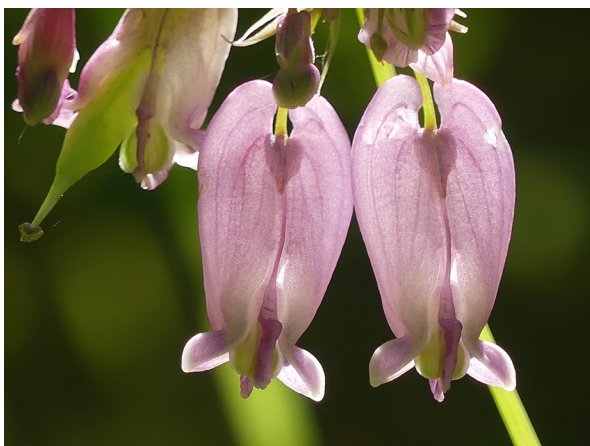
Abb. 27: Dicentra formosa in Arnsberg-Vosswinkel (W. HESSEL).

Kreis Recklinghausen, Haltern-Flaesheim (4209/32): zwei Pflanzen nahe der Lipper-Brücke am Flaesheimer Damm, 31.08.2019, W. HESSEL. – Kreis Unna, Holzwickede (4411/44): drei Pflanzen in einem Grünstreifen entlang der Schallschutzwand an der Abfahrt Holzwickede/Danziger Str., zusammen mit ca. 20 Pflanzen der var. stramonium , 05.10.2019, W. HESSEL. – Kreis Unna, Unna-Zentrum (4412/33): neun Pflanzen neben dem Bordstein auf der Hertinger Str. zwischen Türkenstr. und der Überführung der A44, 15.09.2019, W. HESSEL. – Die Funde dieser Sippe werden gesammelt, um über deren Häufigkeit und Verbreitung in Nordrhein-Westfalen einen Überblick zu bekommen.