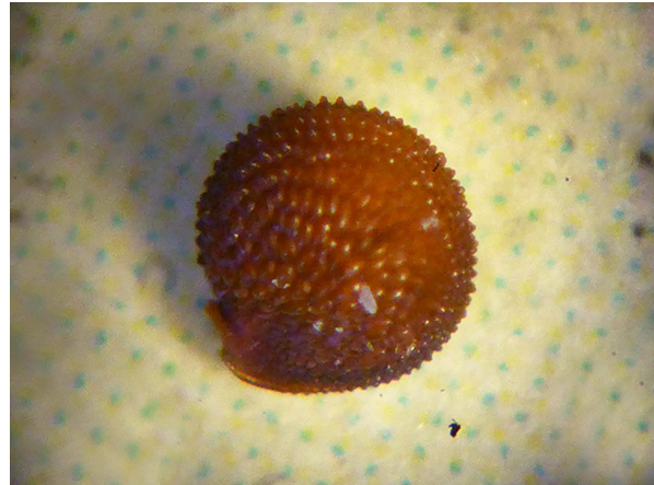
Abb. 56: Montia fontana subsp. amporitana , Same, Binokularaufnahme, Olpe (J. KNOBLAUCH).