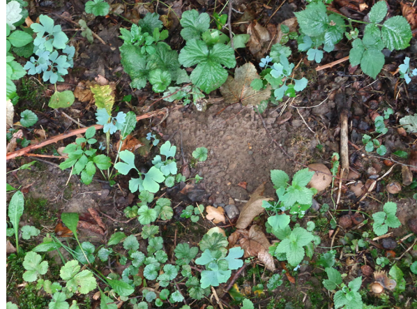
Abb. 42: Ginkgo biloba in Solingen (F. JANSSEN).