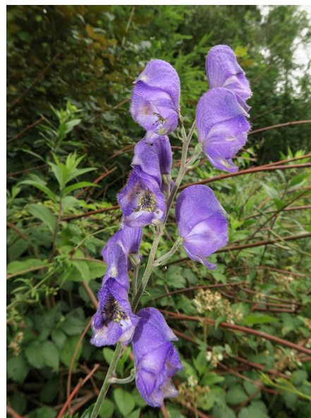
Abb. 2: Aconitum napellus in Lennestadt-Altenhundem (M. LUBIENSKI).