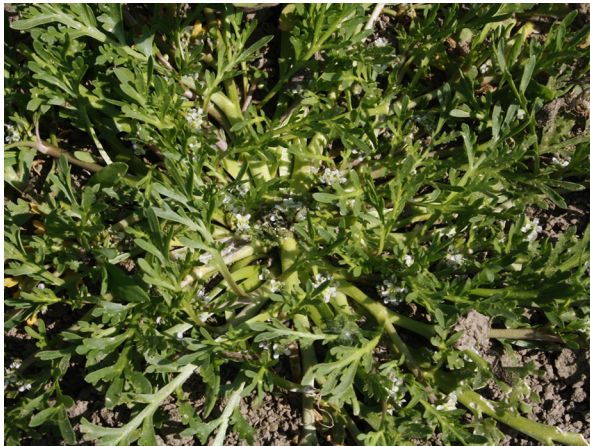
Abb. 49: Lepidium coronopus in Xanten.

Kreis Wesel, Xanten (4204/43): in einer Blänke bei Gut Grindt im Rheinvorland, 23.05.2019, M. ERZNER.