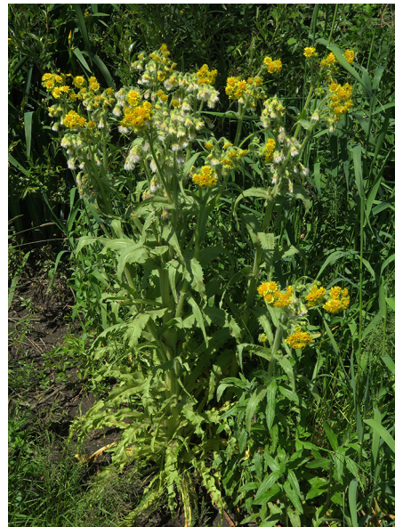
Abb. 84: Tephrosieris palustris in Hagen-Vorhalle (M. LUBIENSKI).