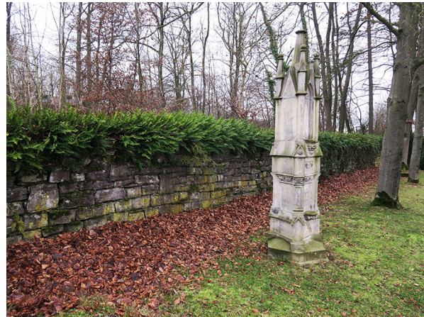
Abb. 68: Polypodium ×mantoniae in Marienmünster (M. LUBIENSKI).