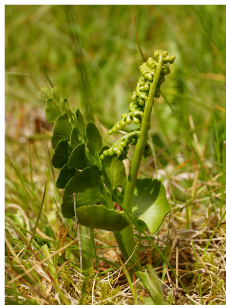
Abb. 12: Botrychium lunaria in Kirchhundem-Brachthausen (D. WOLBECK).