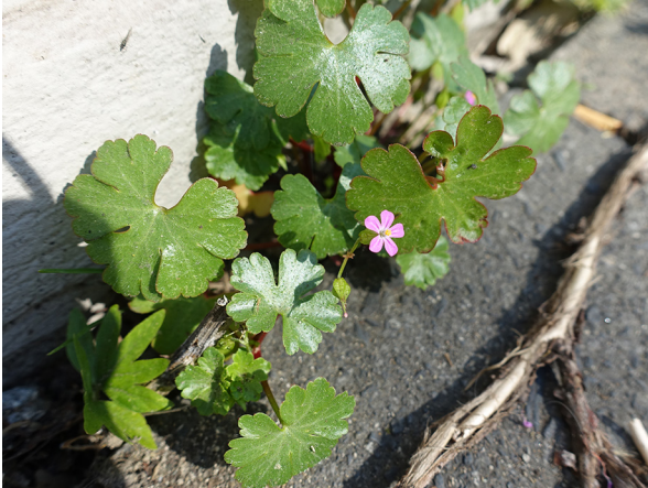
Abb. 41: Geranium lucidum in Krefeld (L. ROTHSCHUH).

Dortmund-Wickede (4411/42): mehrere Pflanzen in einem Möhrenfeld, 14.10.2019, W. HESSEL (det. F. W. BOMBLE).