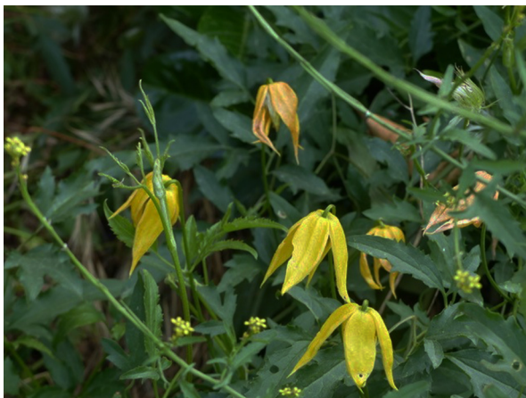
Abb. 21: Clematis tangutica in Bochum-Wiemelhausen.

Herne (4409/3): ca. 50 Pflanzen in einer halbschattigen extensiven Rasenfläche nahe des Parkhotels im Stadtpark, 02.04.2019, R. KÖHLER. – Essen-Stadtwald (4508/33): ein Bestand von ca. 20 Pflanzen im Waldpark, 01.04.2019, C. HURCK. Sehr selten im Ruhrgebiet.