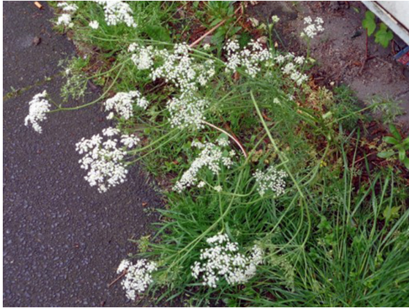
Abb. 13: Bunium bulbocastanum in Solingen-Wald (F. JANSSEN).