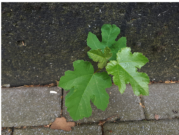
Abb. 35: Ficus carica in Herne-Wanne (P. GAUSMANN).

Kreis Soest, Soest (4414/21): verwildert in einer Bürgersteigfuge in der Friedrichstr., 01.01.2019, J. LANGANKI.