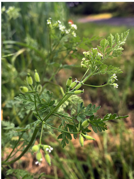
Abb. 7: Anthriscus caucalis in Essen-Kettwig (C. KATZENMEIER).