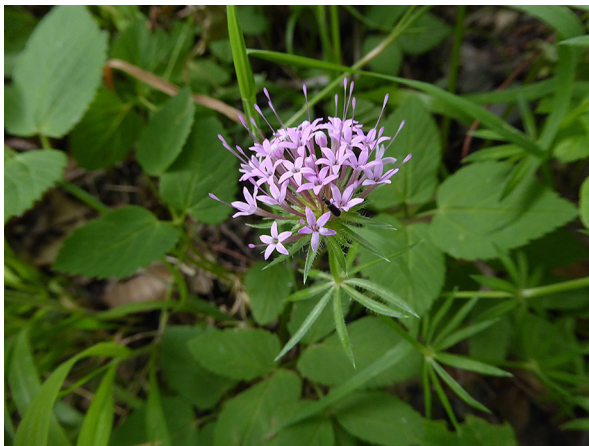
Abb. 65: Phuopsis stylosa in Hagen (U. SCHMIDT).