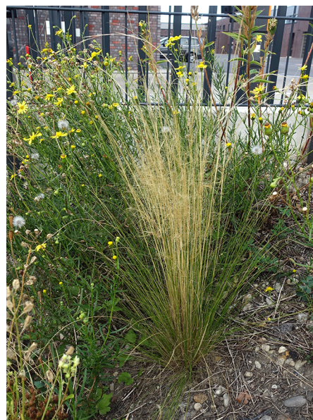
Abb. 82: Stipa tenuissima in Krefeld-Dissem (L. ROTHSCHUH).