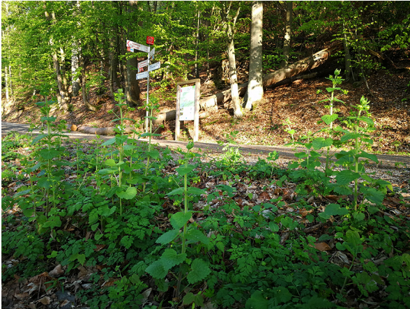
Abb. 75: Scrophularia vernalis in Attendorf (D. WOLBECK).