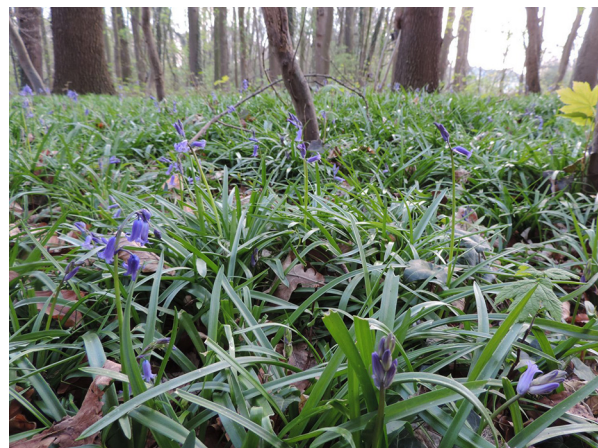
Abb. 46: Hyacinthoides non-scripta in Meerbusch.