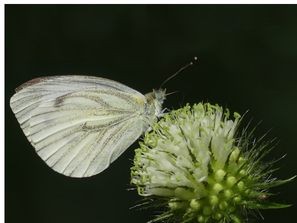
Abb. 30: Dipsacus strigosus mit Rapsweißling in Hamm-Rhynern (W. HESSEL).