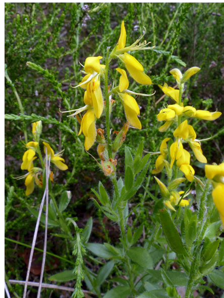
Abb. 40: Genista germanica in Solingen-Ohligs (F. SONNENBURG).