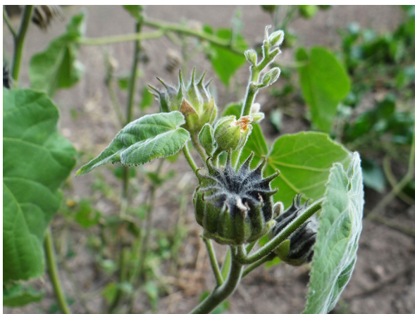
Abb. 1: Abutilon theophrasti in Köln-Worringen (T. KALVERAM).

Aachen (5202/41): 15 Pflanzen verwildert auf älteren Schotterwegen auf dem Waldfriedhof. Nicht nur, aber besonders auf Friedhöfen, ist mit zunehmenden Verwilderungen zu rechnen, 04.08.2019, F. W. BOMBLE.