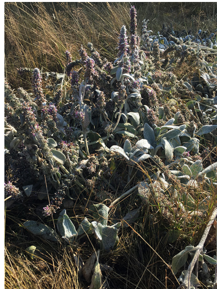
Abb. 80: Stachys byzantina in Drolshagen-Halbhusten (J. KNOBLAUCH).