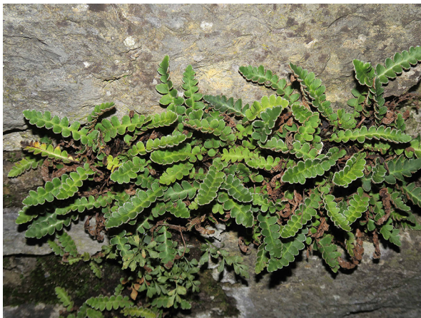
Abb. 9: Asplenium ceterach in Albaxen (M. LUBIENSKI).

Bochum-Querenburg (4509/41): mehrere kleine Teppiche innerhalb der Wasserlinsendecken in der Nordbucht (Heveney) des Kemnader Sees, 21.08.2019, H.-C. VAHLE.