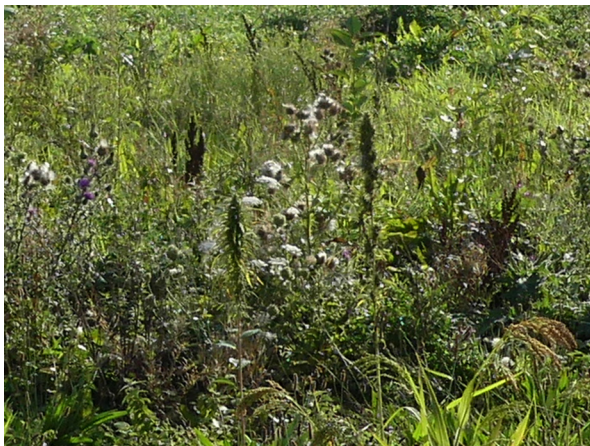
Abb. 15: Cannabis sativa in Holzwickede (W. HESSEL).

Hamm-Geithe (4313/12): ein kleiner Bestand von weniger als 10 Pflanzen im Nordosten des Geithewaldes am Nieliesweg, 22.04.2019, W. HESSEL. – Essen-Stadtwald (4508/33): an mehreren Stellen im Waldpark, 01.04.2019, C. HURCK. Hier seit 25 Jahren bekannt, jedoch 2019 neu auf einer Fläche jenseits des Waldparkzauns, die früher ein dichter Waldbestand mit alten Buchen und Eichen war und inzwischen durch Stürme und Fällungen nur noch wenige Bäume aufweist (S. HURCK).