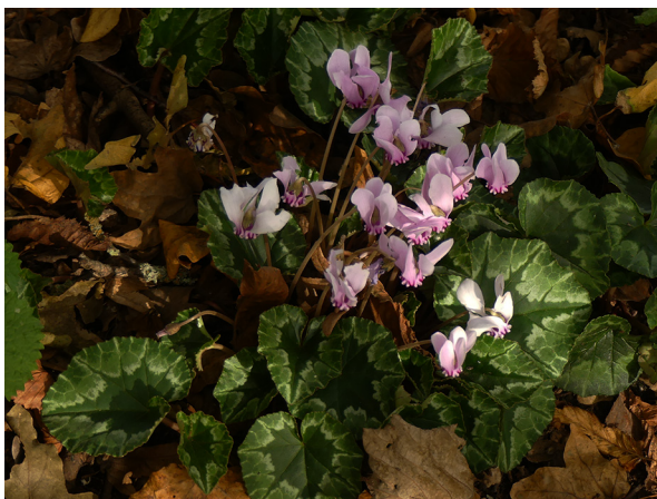
Abb. 25: Cyclamen hederifolium in Holzwickede.