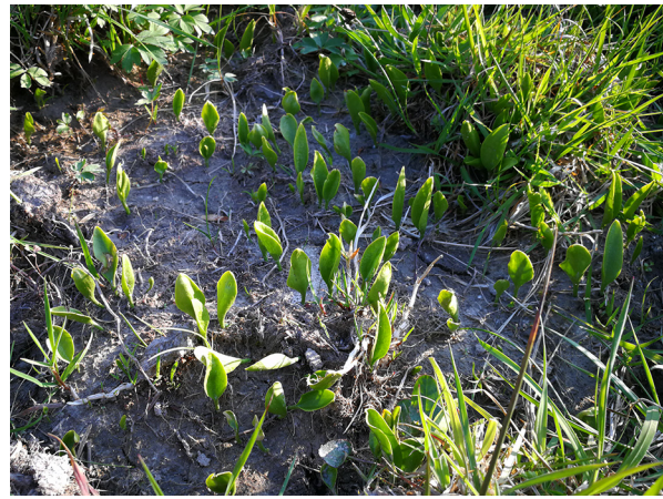
Abb. 60: Ophioglossum vulgatum in Kirchhundem-Brachthausen (D. WOLBECK).