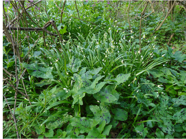
Abb. 4: Allium paradoxum im NSG Urdenbacher Kämpe (S. EGELING).