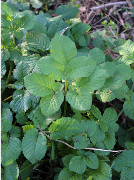
Abb. 19: Chaerophyllum byzantinum in Oberhausen-Styrum.