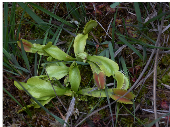
Abb. 28: Dionaea muscipula in der Hildener Heide (K. ADOLPHY).