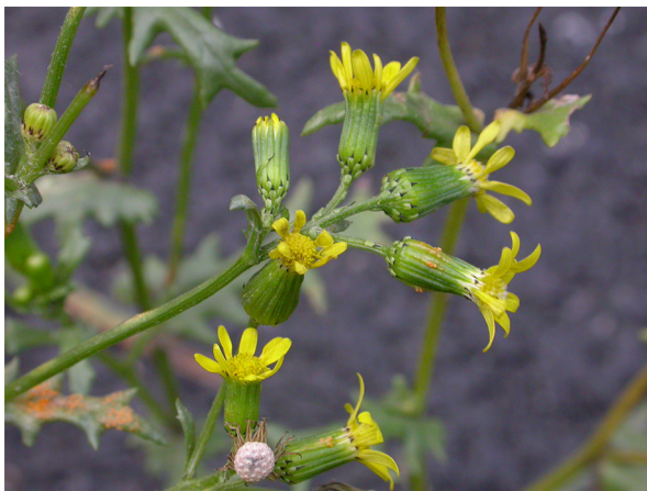
Abb. 77: Senecio vulgaris var. hibernicus in Aachen-Köpfchen (F. W. BOMBLE).

Essen-Dellwig (4507/12): ein Bestand in einem Vorgarten in der Wertstr., 22.03.2019, C. HURCK. – Neuss-Innenstadt (4706/33): auf gut 1 m 2 in Pflasterritzen vor dem Haus Münsterstr. 15, 02.08.2019, R. THEBUD-LASSAK.