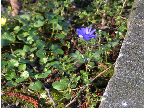
Abb. 5: Anemone blanda in Erkrath-Hochdahl (K. ADOLPHY).