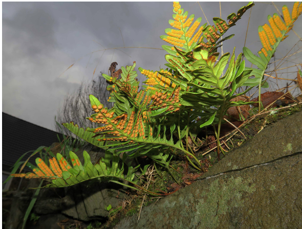
Abb. 67: Polypodium interjectum in Gevelsberg.

Kreis Höxter, Marienmünster (4121/32): sehr großer Bestand auf einer Mauer der Abtei Marienmünster, auf einer Länge von ungefähr 50 m, zusammen mit P. interjectum , 29.12.2019, M. LUBIENSKI.