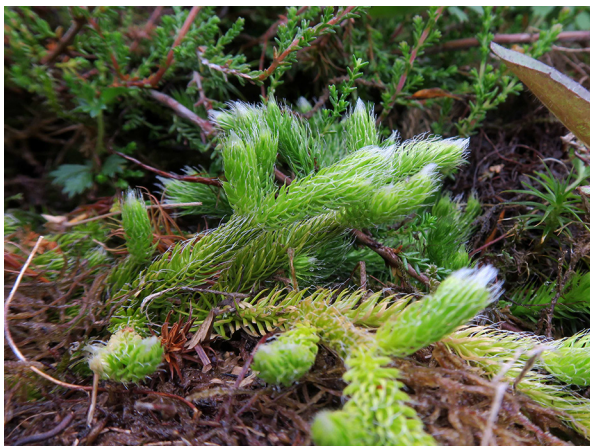
Abb. 51: Lycopodium clavatum in Lennestadt-Altenhundem (M. LUBIENSKI).

Kreis Unna, Holzwickede (4411/43): eine Pflanze zwischen Geranium macrorrhizum in einem Straßenbeet an der Hauptstr., 20.09.2019, W. HESSEL.