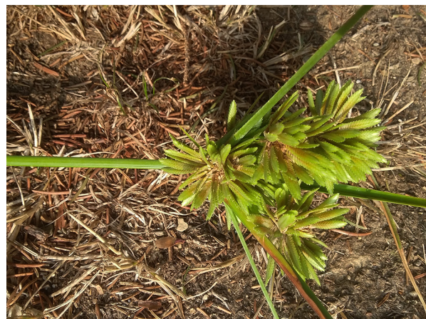
Abb. 26: Cyperus eragrostis in Lindlar (W. SCHÄFER).