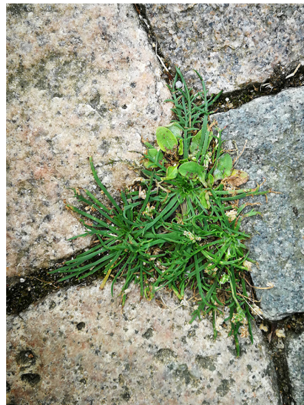
Abb. 66: Plantago coronopus in Attendorn (D. WOLBECK).