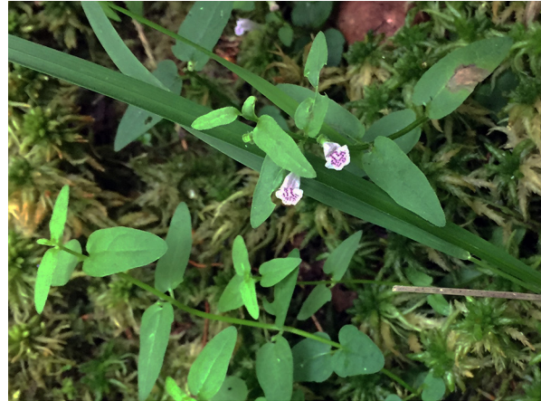
Abb. 76: Scutellaria minor in Köln-Dünnwald.