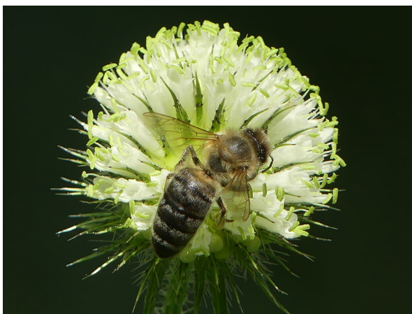
Abb. 29: Dipsacus strigosus mit Honigbiene in Hamm-Rhynern (W. HESSEL).

Hamm-Rhynern (4413/11): mindestens 300 bis zu 2,50 m hohe Pflanzen im Kreuzungsbereich Alter Hellweg/Alleen-Radweg, darüber hinaus ein etwa halber Meter breiter und ca. 50 m langer Streifen entlang des Radwegs teppichartig mit Jungpflanzen, 30.07.2019, W. HESSEL (vgl. BOMBLE 2020).