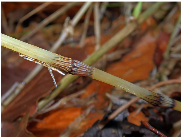
Abb. 33: Equisetum pratense in Horn-Bad Meinberg (M. LUBIENSKI).

Märkischer Kreis, Schalksmühle-Albringwerde (4711/21): ein kleiner Bestand an einer feuchten Böschung an der Straße von Albringwerde ins Nahmer Tal, 23.06.2019, M. LUBIENSKI.