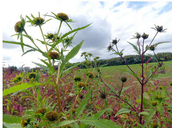
Abb. 10: Bidens radiata (links) mit Bidens tripartita in Lippetal (A. SCHMITZ-MIENER).