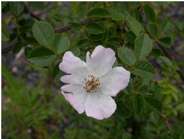
Abb. 73: Rosa micrantha in Würselen (F. W. BOMBLE).

Kreis Düren, Jülich (5004/42): eine Pflanze an einem lückig bewachsenen Pionier-Sandstandort südlich des Höller Horns auf der Sophienhöhe, wohl durch Vögel eingeschleppt, 22.08.2019, R. THEBUD-LASSAK & BOTAN. AG NIEDERRHEIN (det. G. H. LOOS).