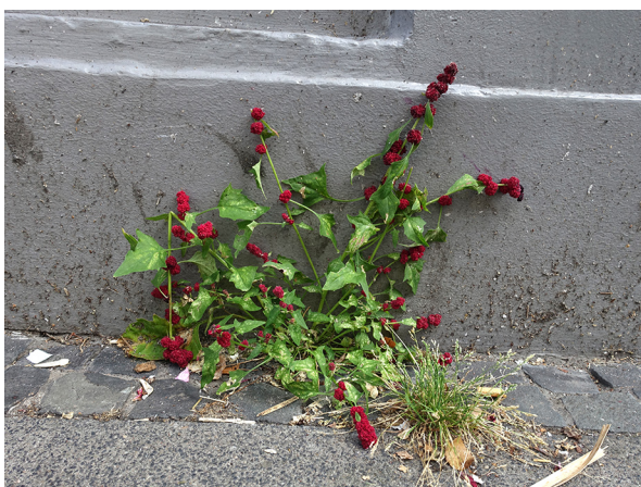
Abb. 11: Blitum capitatum in Krefeld (L. ROTHSCHUH).

Kreis Olpe, Finnentrop (4713/44): mehrere kleinere Bestände an der Straßenböschung der B 236 zwischen Lenhausen und Rönkhausen, 19.07.2019, T. EICKHOFF (ÖFS).