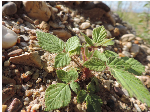
Abb. 74: Rubus phoenicolasius auf der Sophienhöhe (R. THEBUD-LASSAK).