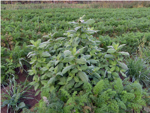
Abb. 43: Guizotia scabra subsp. schimperi in Dortmund-Wickede (W. HESSEL).