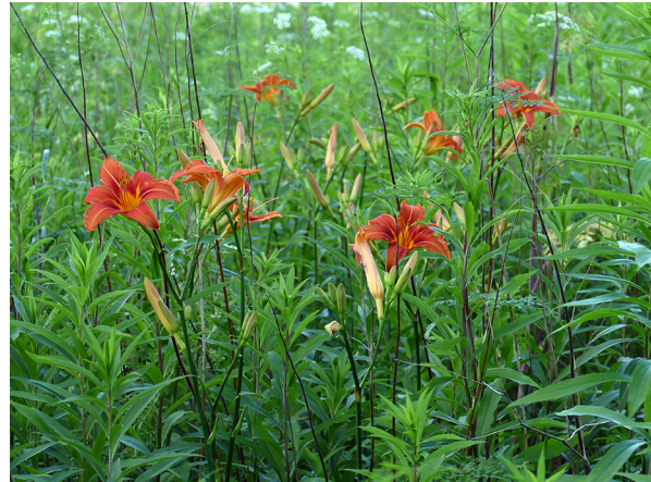
Abb. 44: Hemerocallis spec. am Monheimer Rheinbogen (K. ADOLPHY).