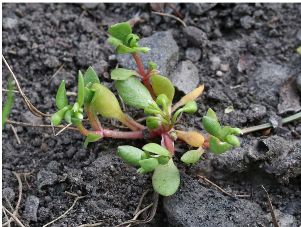
Abb. 53: Montia arvensis in Bochum-Laer (A. JAGEL).

Essen-Stadtwald (4508/33): ein größerer Bestand auf einer Verkehrsinsel an der Wittenbergstr., 03.03.2019, C. HURCK. – Bochum-Laer (4509/23): zwei Pflanzen am Fuß eines Obstbaums auf einer Obstwiese an der Schattbachstr., 17.04.2019, C. BUCH. Wiederfund für Bochum nach über 130 Jahren (A. JAGEL)!