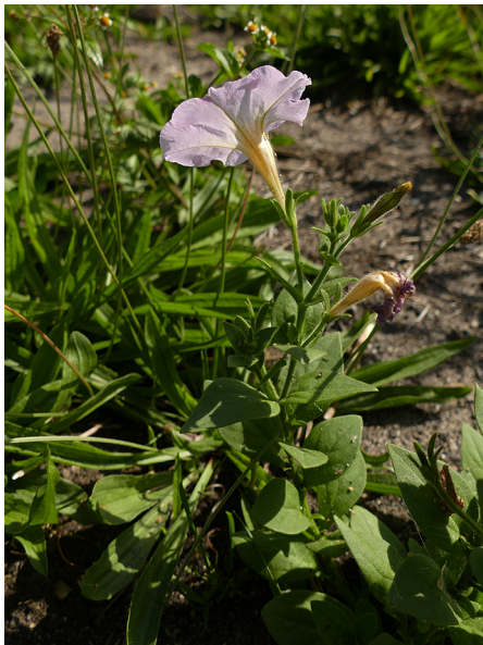
Abb. 63: Petunia ×hybrida in Brünen.

Kreis Siegen-Wittgenstein, Erndtebrück (5015/32): etwa 40 Pflanzen an einem Weg bei Benfe, 22.06.2019, D. WOLBECK.