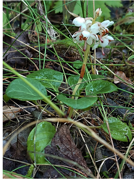
Abb. 72: Pyrola rotundifolia in Warstein-Suttrop (K. P. LANGE).