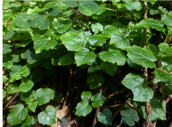
Abb. 20: Circaea alpina in Wipperfürth (J. KNOBLAUCH).