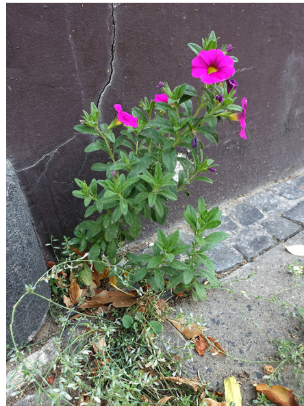
Abb. 64: Petunia ×hybrida in Krefeld (L. ROTHSCHUH).