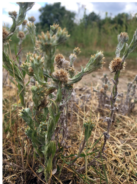
Abb. 36: Filago germanica in Köln-Libur (H. SUMSER).