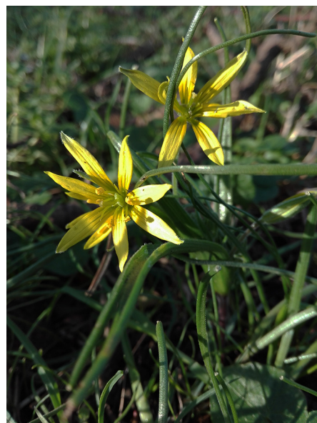
Abb. 38: Gagea villosa in Soest (A. SCHMITZ-MIENER).