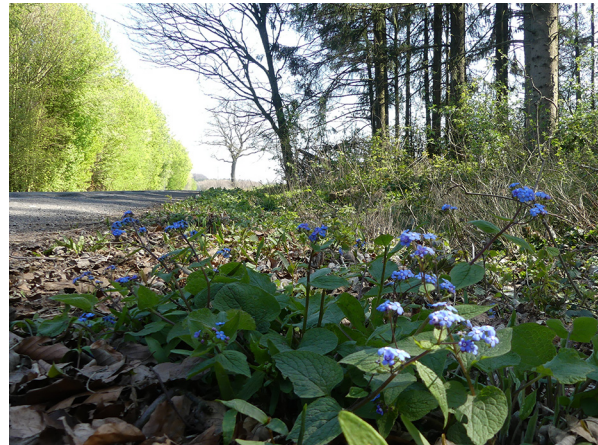
Abb. 58: Omphalodes verna in Fröndenberg.