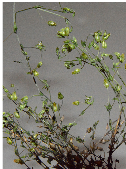
Abb. 8: Arenaria leptoclados in Olpe-Neuenkleusheim (M. KLEIN).