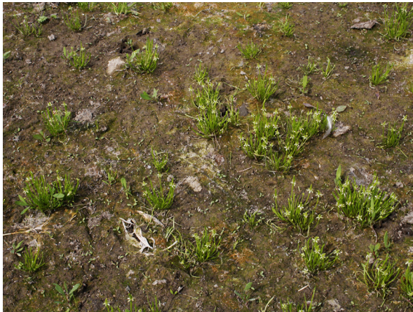
Abb. 57: Myosurus minimus in Xanten (M. ERZNER).

Kreis Unna, Fröndenberg-Frömer (4512/12): eine kleine Gruppe am Waldrand vom Buschholt am Straßenrand „Auf dem Splitt“, 16.04.2019, W. HESSEL.