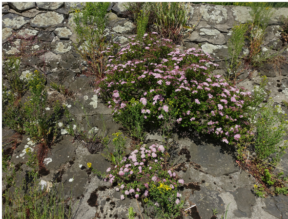
Abb. 79: Spiraea japonica in Krefeld-Uerdingen (L. ROTHSCHUH).

Kreis Olpe, Drolshagen (5012/21): wenige Pflanzen in einer Rinderweide bei Halbhusten, vom Weidevieh verschmäht, wahrscheinlich mit Bauschutt dorthin gelangt, 17.05.2019, J. KNOBLAUCH (ÖFS).