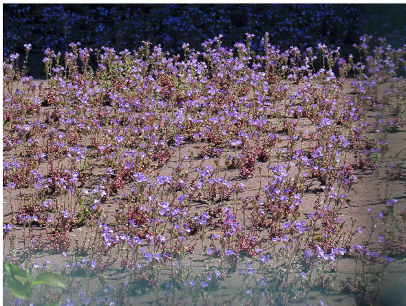
Abb. 17: Chaenorhinum organifolium in Hagen-Eckesey.

Bochum-Querenburg (4509/41): eine Pflanze auf dem Gelände der Ruhr-Universität zwischen Forumsplatz und Q-West, 29.05.2019, T. SCHMITT.