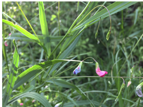
Abb. 48: Lathyrus nissolia in Köln-Holweide.