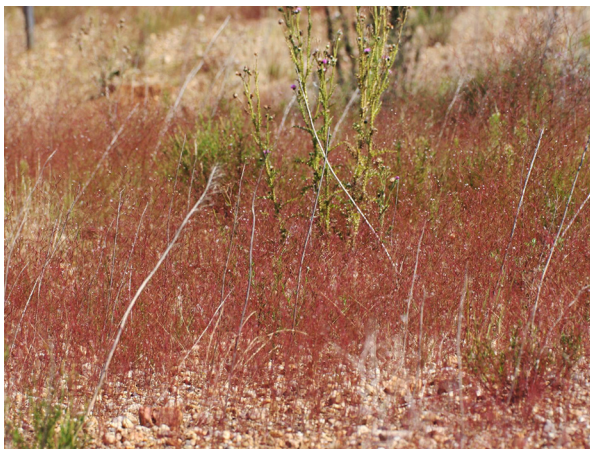
Abb. 31: Epilobium brachycarpum auf der Sophienhöhe.

Köln-Altstadt-Süd (5007/41): vor der Mayerschen Buchhandlung am Neumarkt in Pflasterritzen bei Abstellplätzen von Fahrrädern, 20.07.2019, J. KNOBLAUCH.