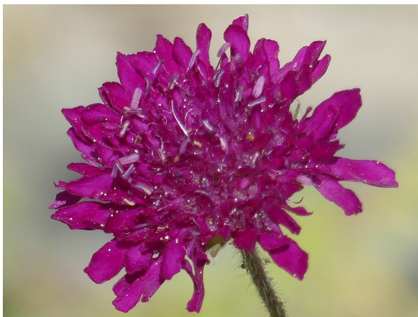
Abb. 47: Knautia macedonica in Kamen-Heeren (W. HESSEL).

Kreis Unna, Kamen-Heeren-Werve (4412/12): eine Pflanze am Seseke-Radweg östlich der Derner Str., 01.07.2019, W. HESSEL.