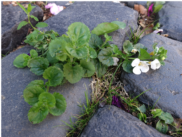
Abb. 83: Sutera cordata in Krefeld (L. ROTHSCHUH).

Hagen-Vorhalle (4610/12): eine Pflanze in den Ruhrwiesen „Niederste Hülsberg“ westlich Vorhalle, 02.06.2019, M. LUBIENSKI.