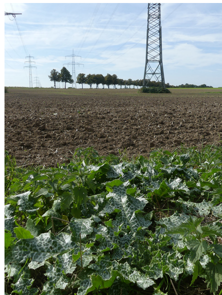
Abb. 78: Silybum marianum in Unna-Afferde (W. HESSEL).