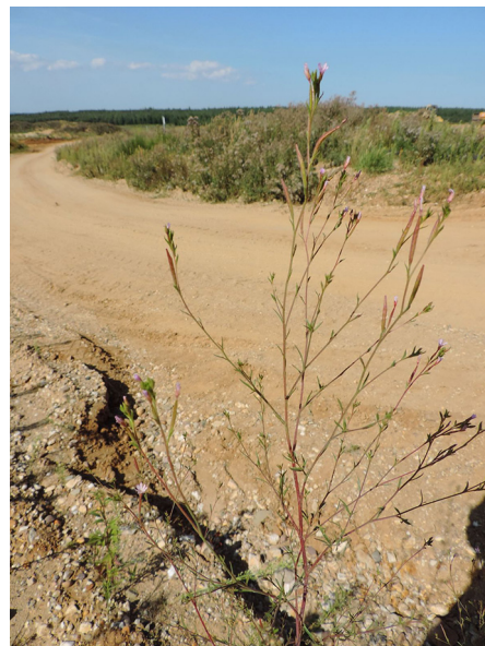
Abb. 32: Epilobium brachycarpum auf der Sophienhöhe.