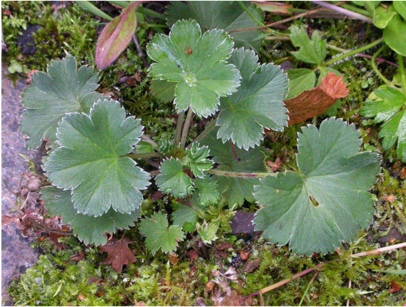
Abb. 3: Alchemilla sericata in Aachen (F. W. BOMBLE).