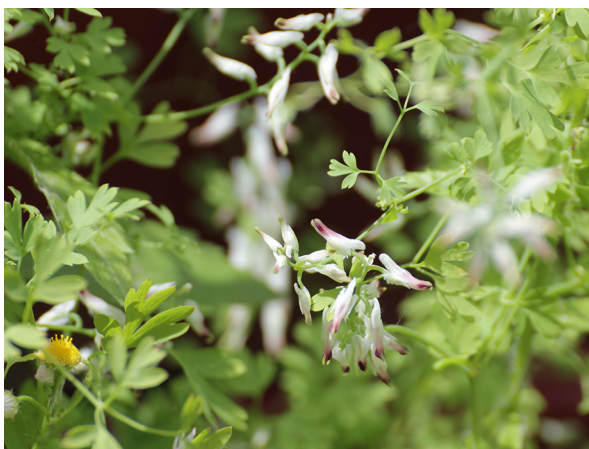
Abb. 37: Fumaria capreolata in Köln-Mülheim.

Kreis Soest, Soest (4414/21): 25–30 blühende und über 10.000 junge Pflanzen (z. T. rasenförmig) im Clarenbachpark (ehemals Walburger Friedhof), 10.03.2019, H. J. GEYER & A. SCHMITZ-MIENER. – Kreis Düren, Stockheim (5205/13): eine Pflanze auf dem Friedhof, 16.03.2019, F. W. BOMBLE & N. JOUBEN. – Kreis Düren, Ginnick (5205/34): eine Pflanze auf dem Friedhof, 16.03.2019, F. W. BOMBLE & N. JOUBEN.