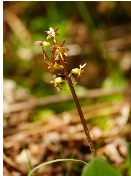
Abb. 50: Listera cordata in Lennestadt (D. WOLBECK).