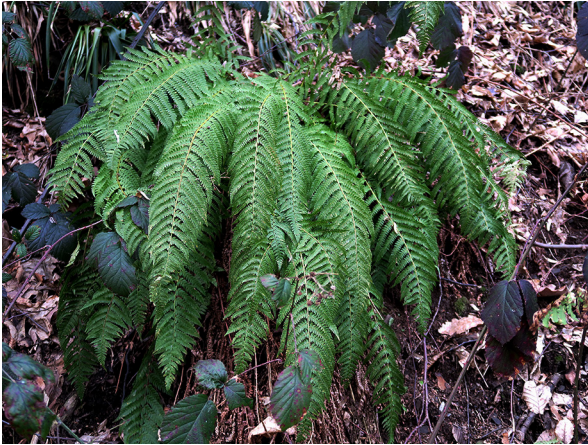
Abb. 69: Polystichum setiferum in Wetter (M. LUBIENSKI).