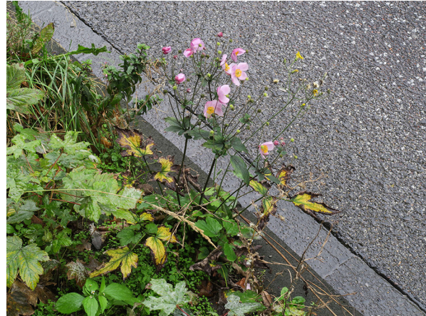
Abb. 6: Anemone hupehensis in Hagen-Wehringhausen.