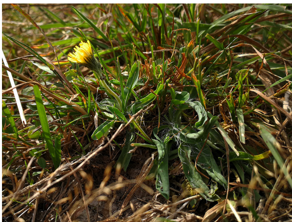
Abb. 45: Hieracium lactucella in Attendorn-Rauterkusen (D. WOLBECK).

Bottrop-Kirchhellen (4407/11): mehrere Pflanzen in einer Hochstaudenflur am Kinderspielplatz am Heidhof, 21.07.2019, A. JAGEL. – Essen-Altendorf (4507/24): viele hundert Pflanzen entlang des Radschnellwegs (RS 1) über mehrere km, 26.08.2019, C. BUCH & M. ENGELS.