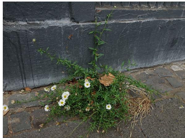
Abb. 34: Erigeron karvinskianus in Krefeld (L. ROTHSCHUH).