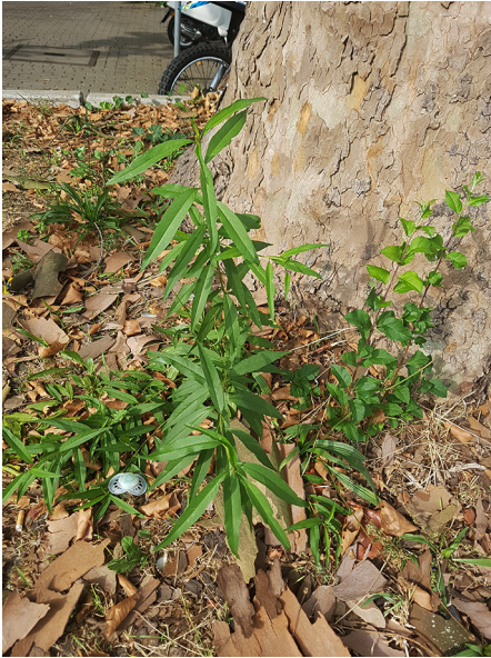
Abb. 71: Prunus persica in Bochum-Innenstadt.