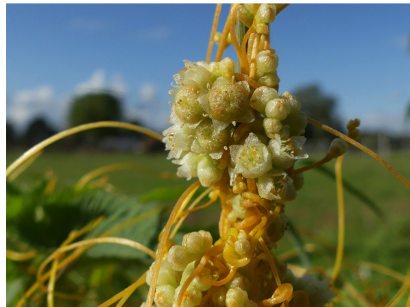
Abb. 24: Cuscuta campestris in Holzwickede-Opherdicke (W. HESSEL).