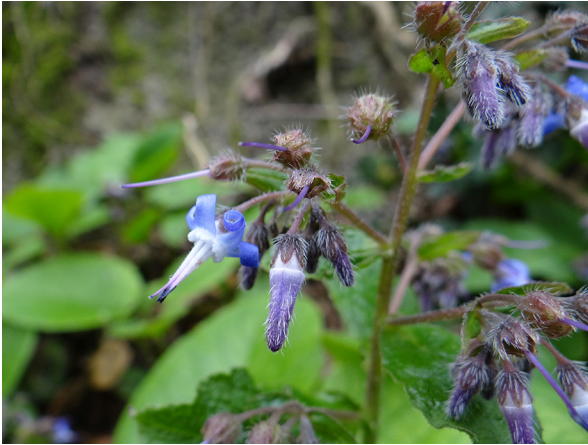
Abb. 85: Trachystemon orientalis in Essen-Kupferdreh (T. KALVERAM).