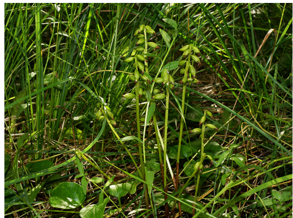
Abb. 22: Corallorhiza trifida in Winterberg.