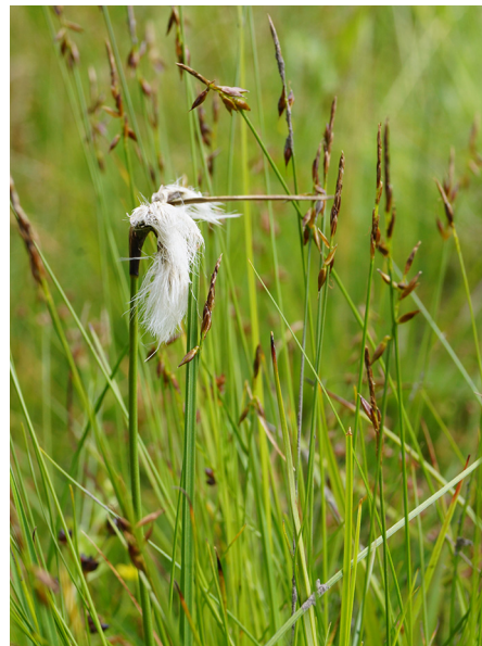
Abb. 16: Carex pulicaris mit Eriophorum angustifolium in Schmallenberg (D. WOLBECK).