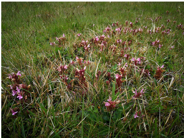
Abb. 61: Pedicularis sylvatica in Medebach (D. WOLBECK).

Kreis Recklinghausen, Dorsten-Lembeck (4207/24): ein großer Bestand in einem Wald bei Wessendorf in der Nähe vom Kalten Bach, 28.05.2019, C. HOMM. – Rhein-Kreis Neuss, Neuss-Rosellen (4806/32): gut 15 blühende Pflanzen am Rand des LSG Schwarzer Graben, schräg gegenüber dem Friedhofseingang, wohl Gartenflüchtling, 18.05.2019, R. THEBUD-LASSAK.