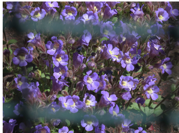
Abb. 18: Chaenorhinum organifolium in Hagen-Eckesey (M. LUBIENSKI).