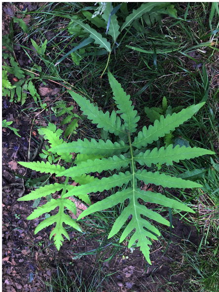
Abb. 59: Onoclea sensibilis in Köln-Dellbrück (G. FALK).

Hochsauerlandkreis, Winterberg (4716/44): über 100 Pflanzen auf einer Feucht-Grünlandfläche im NSG Gutmecke und Renau, 16.06.2019, D. WOLBECK. – Kreis Olpe, Kirchhundem (4914/32): an mindestens zwei Stellen in großer Zahl um jeweils 1000 Pflanzen auf einer feuchten Waldwiese des NSG Dollenbruch bei Brachthausen, 30.04.2019, D. WOLBECK.