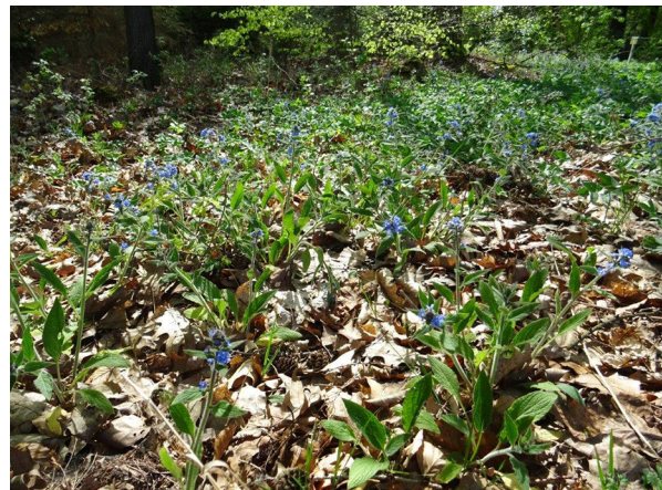
Abb. 62: Pentaglottis sempervirens in Dorsten-Wessendorf (C. HOMM).