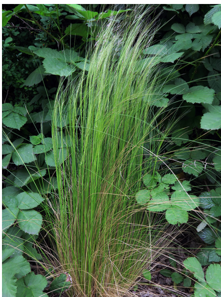
Abb. 81: Stipa tenuissima in Hagen-Haspe (M. LUBIENSKI).