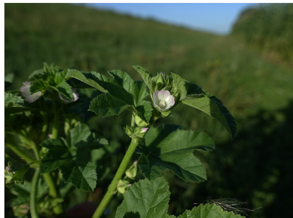
Abb. 52: Malva verticillata in Duisburg-Mündelheim.