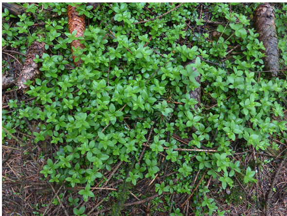
Abb. 39: Galium rotundifolium in Attendorn-Eichen (J. KNOBLAUCH).

Kreis Olpe, Attendorn (4912/22): wenige Pflanzen in einem Fichtenforst nordwestlich des Ortes Eichen, 09.05.2019, J. KNOBLAUCH. Der Fundort liegt ca. 1,3 km südwestlich des Erstfundes der Art bei Albringhausen (vgl. EICKHOFF & al. 2018). Dritter Fund im Kreis Olpe (J. KNOBLAUCH).