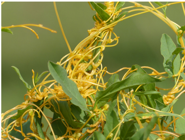
Abb. 23: Cuscuta campestris in Holzwickede-Opherdicke (W. HESSEL).

Kreis Unna, Holzwickede-Opherdicke (4511/22): ein Bestand von weniger als 1 m 2 auf verschiedenen Kräutern schmarotzend am Rand des Weges „Im Feld“ an einer Koppel, 15.09.2019, W. HESSEL (vgl. HESSEL & JAGEL 2020).