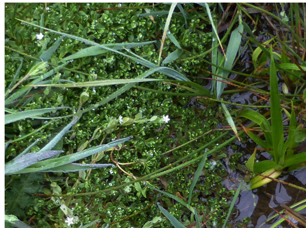
Abb. 54: Montia fontana subsp. amporitana mit Stellaria alsine in Olpe (J. KNOBLAUCH).