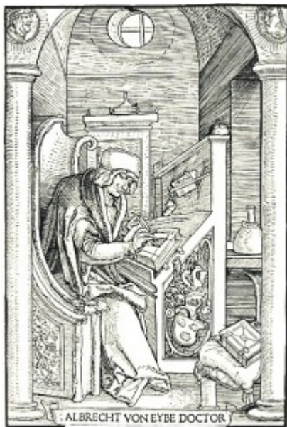
Albrecht von Eyb (Holzschnitt von 1521).

Angeregt durch das Wirken Enea Silvio Piccolominis auf dem Basler Konzil und am Wiener Hof Friedrichs III. bildeten sich seit der Mitte des 15. Jahrhunderts frühe Zentren des Humanismus in Deutschland, vor allem in Heidelberg, Augsburg und Eichstätt. Als einer der wichtigsten Protagonisten dieses süddeutschen Frühhumanismus gilt der fränkische Domherr und Jurist Albrecht von Eyb (1420–1475).