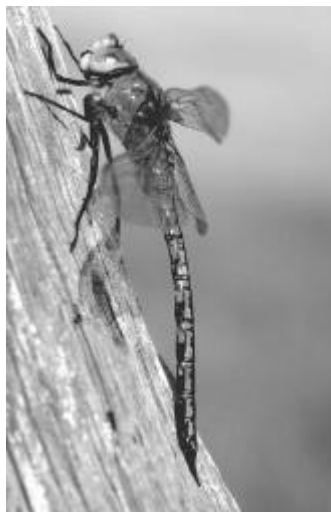
L'Anax empereur X, Anax imperator , avec son thorax vert et son abdomen bleu tacheté de noir, est l'une des plus grandes libellules de Vendée.

Adresse : 176 cité de la Garenne Bat. D 85000 LA ROCHE-SUR-YON Tél. : 02 51 37 99 16 (le soir)