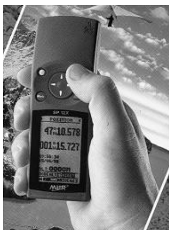
Le GPS SP 12X de la marque MLR : un appareil bien adapté au travail de terrain. Il effectue les mesures en grades, en degrés, en UTM et peut les convertir. Avec 600 points mémorisables et une aide en ligne, il présente un excellent rapport qualité/prix.

Prix spécialement étudié pour les Naturalistes Vendéens (sur présentation de la carte de membre) chez MASSON S.A. Quai de la Cabaude 85100 Les Sables d'Olonne (demander M. CHEVILLON au 02 51 32 01 07 ou 06 11 35 92 19).