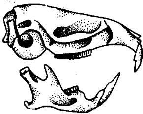
Campagnol agreste Microtus agrestis