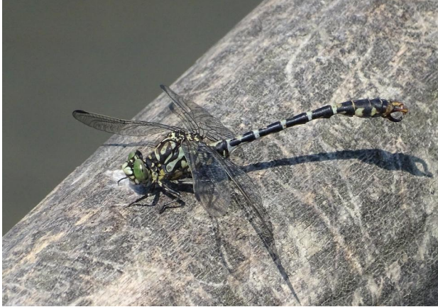
Abbildung 22. Männchen von Onychogomphus forcipatus .

Figure 22. Male Onychogomphus forcipatus . 15-viii-2021, Photo: A. Chovanec.