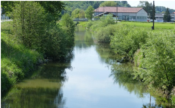
Abbildung 13. Untersuchungsstrecke C Blick flussauf von der Hammermühlstufe.

Figure 13. Stretch C, looking upstream from the weir „Hammermühlstufe“. 28-v-2016, Photo: A. Chovanec.