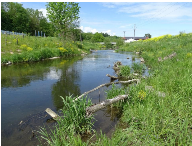
Abbildung 3. Totholz und Wurzelstockbuhnen in Untersuchungsstrecke B, Blick flussauf.

Figure 2. The investigated section of the River Trattnach before (upper picture) and after the implementation of rehabilitation measures (lower picture). The arrow indicates the flow direction; A–D: stretches investigated. (Quelle/Source: www.bing.com/maps ).