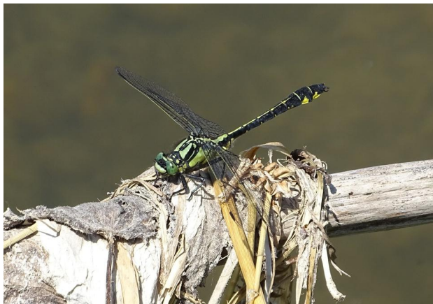
Abbildung 25. Männchen von Gomphus vulgatissimus , Strecke B.

Figure 25. Male Gomphus vulgatissimus , stretch B. 16-vi-2021, Photo: A. Chovanec.