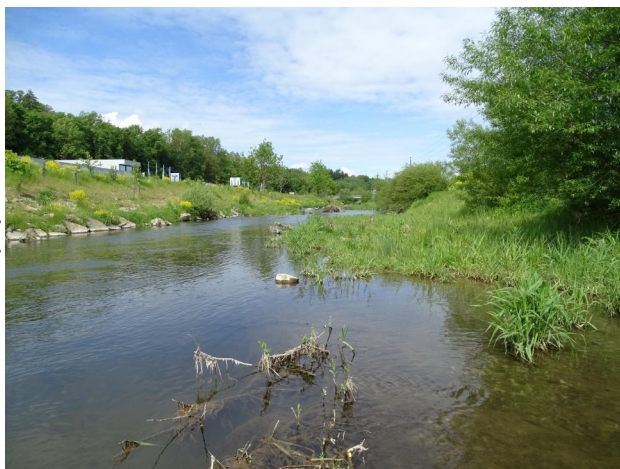
Abbildung 5. Überschwemmtes Flachufer in Untersuchungsstrecke C, Blick flussauf.

Figure 4. Widening of the river bed in stretch C, looking upstream. 26-v-2021, Photo: A. Chovanec.