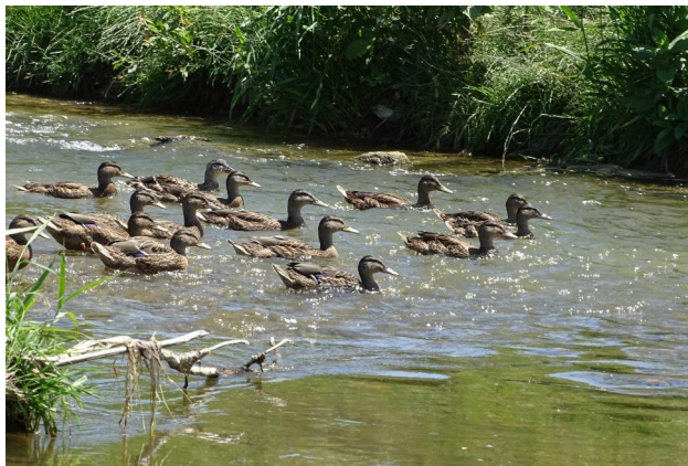
Abbildung 6. Schmälerer Flussbereich in Untersuchungsstrecke B mit höherer Strömungsgeschwindigkeit.

Figure 6. Narrow river bed in stretch B with higher flow velocity. 16-vi-2021, Photo: A. Chovanec.