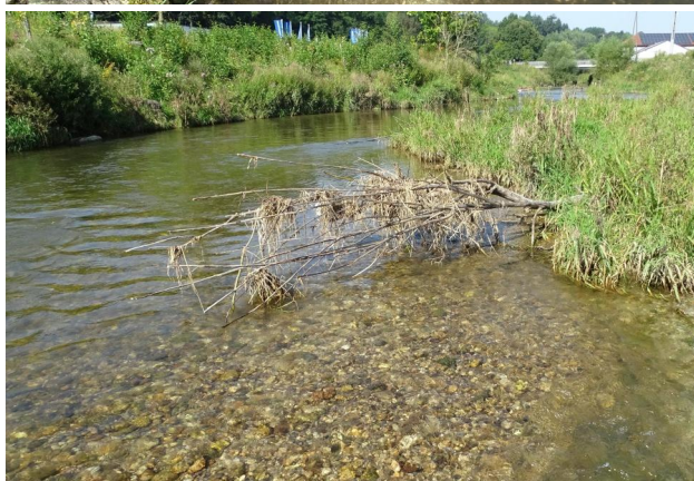
Abbildung 8. Grobkies und Steine in Untersuchungsstrecke B.

Figure 7. Area with reduced flow velocity and deposited detritus, sand and microlithal. 26-v-2021, Photo: A. Chovanec.