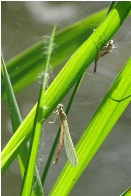
Abbildung 23: Frisch emergiertes Weibchen von Platycnemis pennipes .

Figure 22. Male Onychogomphus forcipatus . 15-viii-2021, Photo: A. Chovanec.