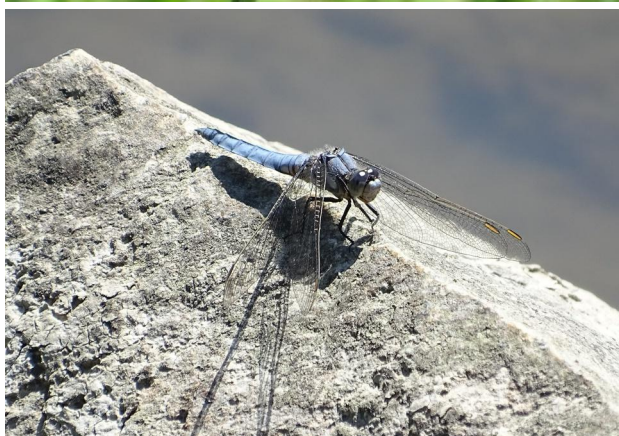
Abbildung 27. Männchen von Orthetrum brunneum , Strecke B.

Figure 26. Freshly emerged male of Onychogomphus forcipatus , stretch B. 16-vi-2021, Photo: A. Chovanec.