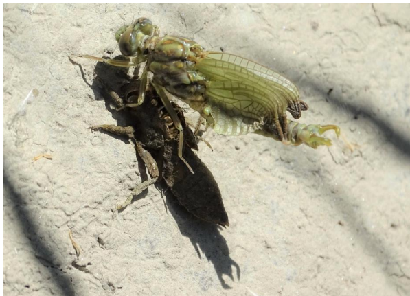
Figure 24. Freshly emerged male of Onychogomphus forcipatus , stretch A. 16-vi-2021, Photo: A. Chovanec.

Untersuchungsstrecken B – D: Wesentlichstes Ergebnis der Studie ist das bodenständige Auftreten der beiden Leitarten aus der Familie Gomphidae (Flussjungfern) G. vulgatissimus und O. forcipatus an den drei im Maßnahmenabschnitt begangenen Strecken im Jahr 2021 (Abb. 25, 26). Onychogomphus forcipatus wurde insbesondere an Strecke B in hohen Abundanzen gesichtet. Mit A. imperator und O. brunneum (Abb. 27) wurden zwei Begleitarten erster Ordnung als möglicherweise bodenständig klassifiziert. Die Zahl der gesichteten Arten erhöhte sich von fünf (2016) auf zehn (2021), jene der sicher, wahrscheinlich und möglicherweise bodenständigen Arten von vier auf acht (Tab. 7). Besonders bei den Strecken B und C sind die Verbesserungen der Fundsituationen besonders augenscheinlich (Tab. 8). Den Tabellen 9–12 sind die detaillierten begehungsstermin-bezogenen Ergebnisse für das Jahr 2021 mit der Darstellung der konkreten Fundsituationen zu entnehmen.