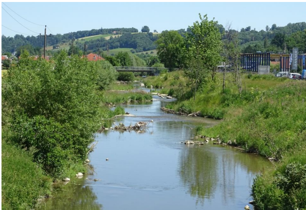
Abbildung 12. Untersuchungsstrecke B, Blick flussab.

Figure 11. Stretch B, looking downstream. 17-vi-2016, Photo: A. Chovanec.