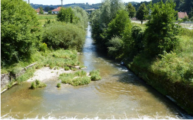
Abbildung 17. Untersuchungsstrecke D, Blick flussab von der Hammermühlstufe.

Figure 17. Stretch D, looking downstream from the artificial fall "Hammermühlstufe." 30-vii-2016, Photo: A. Chovanec.