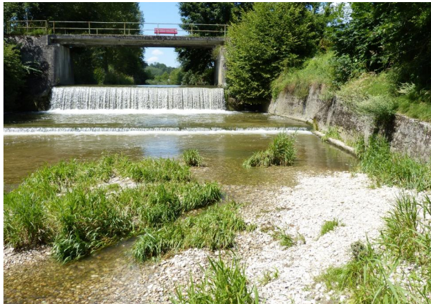
Abbildung 15. Die nicht-fischpassierbare Hammermühlstufe vor dem Umbau, Blick flussauf.

Figure 15. The not fish- passable artificial fall “Hammermühlstufe” before the conversion into a fish-passable river rock-ramp, look- ing upstream. 30-vii- 2016, Photo A. Cho- vanec.