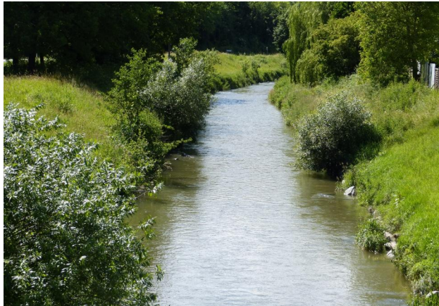
Abbildung 10. Untersuchungsstrecke A, Blick flussauf.

Figure 9. Stretch A, looking upstream. 17-vi-2016, Photo: A. Chovanec.