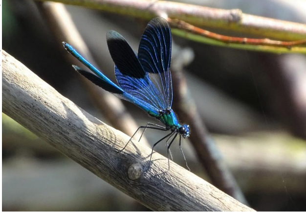
Abbildung 20. Männchen von Calopteryx virgo .

Figure 19. Male Calopteryx splendens . 15-viii-2021, Photo: A. Chovanec.