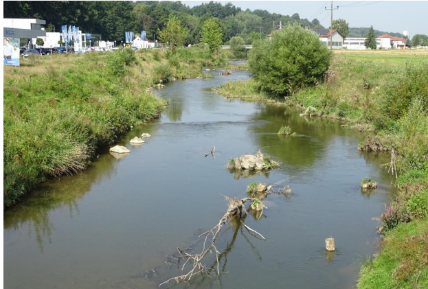
Abbildung 14. Unter- suchungsstrecke C, Blick flussauf.

Figure 14. Stretch C, looking upstream. 15-viii-2021, Photo: A. Chovanec.