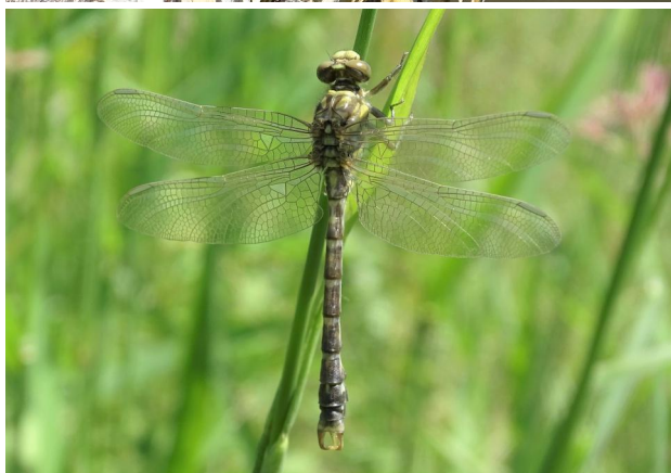
Abbildung 26. Frisch emergiertes Männchen von Onychogomphus forcipatus , Strecke B.

Figure 25. Male Gomphus vulgatissimus , stretch B. 16-vi-2021, Photo: A. Chovanec.