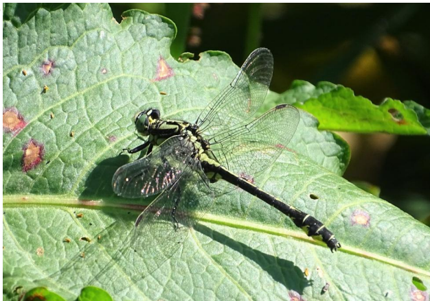
Figure 21. Male Gomphus vulgatissimus . 16-vi-2021, Photo: A. Chovanec.