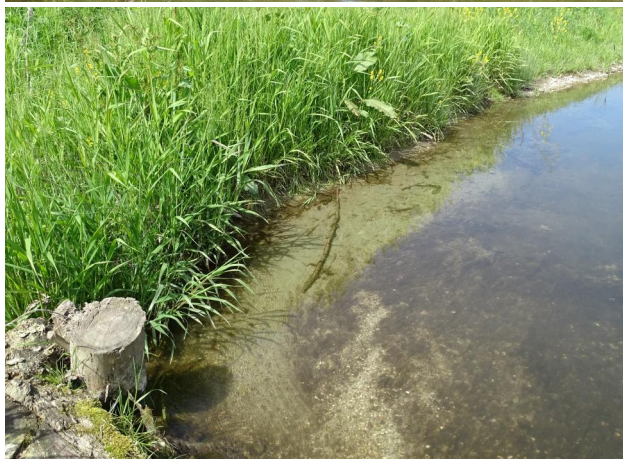
Abbildung 7. Strömungsberuhigter Uferbereich mit Ablagerungen von Detritus, Sand und Feinkies.

Figure 6. Narrow river bed in stretch B with higher flow velocity. 16-vi-2021, Photo: A. Chovanec.