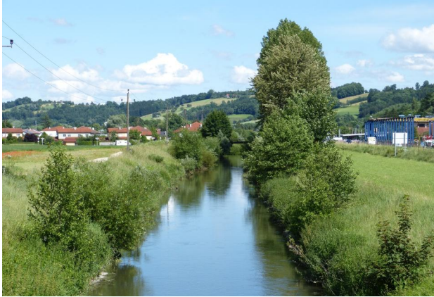
Abbildung 11. Untersuchungsstrecke B, Blick flussab.

Figure 11. Stretch B, looking downstream. 17-vi-2016, Photo: A. Chovanec.