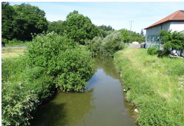
Figure 10. Stretch A, looking upstream. 16-vi-2021, Photo: A. Chovanec.