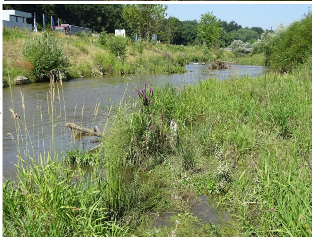
Figure 5. Inundated shallow river bank in stretch C, looking upstream. 21-vii-2021, Photo: A. Chovanec.