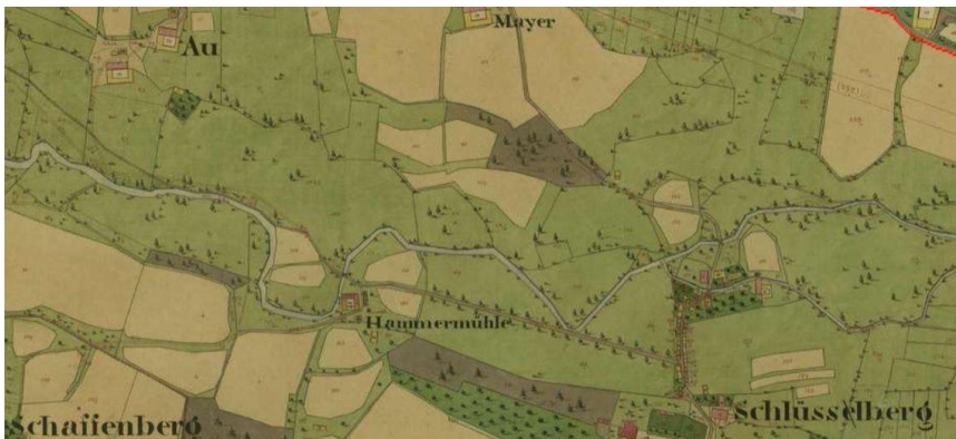
Abbildung 1. Gewunden-/mäandrierender Verlauf der Trattnach im 19. Jahrhundert vor der Durchführung umfassender Regulierungen. – Figure 1. Wandering /meandering course of the River Trattnach in the 19th century before the implementation of large-scale regulation. (Quelle/Source: https://maps.arcanum.com/de/map ).

Der kartierte Flussabschnitt (oberstromiger Beginn Länge: 13°51'23'', Breite: 48°13'17''; unterstromiges Ende Länge: 13°51'54'', Breite: 48°13'13'') liegt in der Marktgemeinde Schlüßberg / Ortschaft Au (Bezirk Grieskirchen), erstreckt sich über eine Länge von etwa 500 m und liegt auf einer Seehöhe von 325 m ü. NN. Das Einzugsgebiet der Trattnach weist in diesem Bereich eine Größe von 165 km 2 auf. Basierend auf den Kriterien Bioregion, Höhenlage und Einzugsgebietsgröße ist die Trattnach im untersuchten Bereich dem Gewässertyp „11-2-3“ (Wimmer et al., 2007; Wimmer & Wintersberger, 2009) zuzuordnen, der wie folgt zu charakterisieren ist: Die prägenden morphologischen Strukturen sind Steil- und Flachufer, unterspülte Anbruchufer mit Totholz und Wurzelstöcken, Kies- und Sandbänke; die Breiten- und Tiefenvariabilität des Gewässerbettes sind hoch. Die Gewässersohle wird dominiert von unterschiedlichen Kiesfraktionen mit Steinanteilen, in Uferbereichen kommt es zu Sand- und Schluffablagerungen. Das Gefälle ist mittel