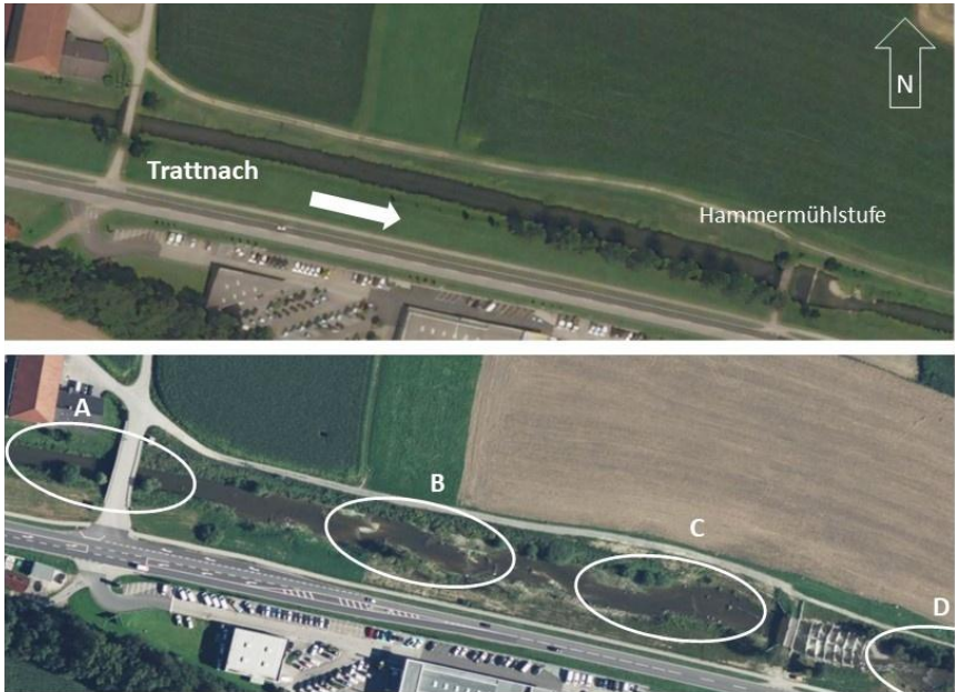
Abbildung 2. Untersuchungsabschnitt an der Trattnach in Schlüßlberg vor Durchführung der ökologischen Aufwertungsmaßnahmen (oben) und nach ihrer Fertigstellung (unten); der Pfeil zeigt die Fließrichtung an; A–D: Untersuchungsstrecken.

Figure 2. The investigated section of the River Trattnach before (upper picture) and after the implementation of rehabilitation measures (lower picture). The arrow indicates the flow direction; A–D: stretches investigated. (Quelle/Source: www.bing.com/maps ).