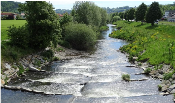
Abbildung 18. Untersuchungsstrecke D, Blick flussab von der kleinen Brücke über die aufgelöste Rampe.

Figure 17. Stretch D, looking downstream from the artificial fall "Hammermühlstufe." 30-vii-2016, Photo: A. Chovanec.