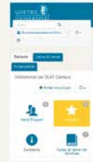
Samsung Galaxy S5