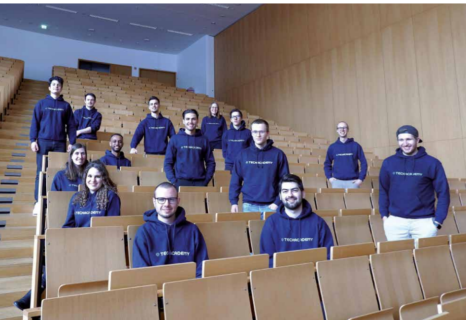
»Studierende des Jahres« – TechAcademy e.V. ausgezeichnet.