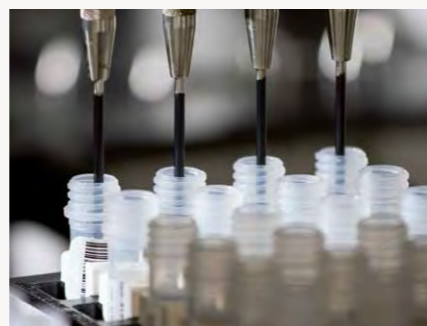
Die Forschungsarbeiten werden mit Mitteln der DFG, dem Goethe-Corona-Fonds sowie der Firma Signals unterstützt.

Bestimmung der dreidimensionalen Proteinstrukturen erlauben. Die Laboranleitungen und die dafür erforderlichen gentechnischen Werkzeuge stehen Forscherinnen und Forschern der ganzen Welt frei zur Verfügung. Entsprechend ausgerüstete wissenschaftliche Labore müssen nicht mehr mehrere Monate lang Systeme zur Herstellung und Untersuchung der SARS-CoV-2-Proteine etablieren und optimieren, sondern können nun dank der Laborprotokolle innerhalb von zwei Wochen mit ihren Forschungsarbeiten beginnen. ■