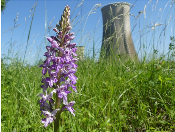
Abb. 7: Dactylorhiza fuchsii in Hamm-Uentrop (14.06.2021,).