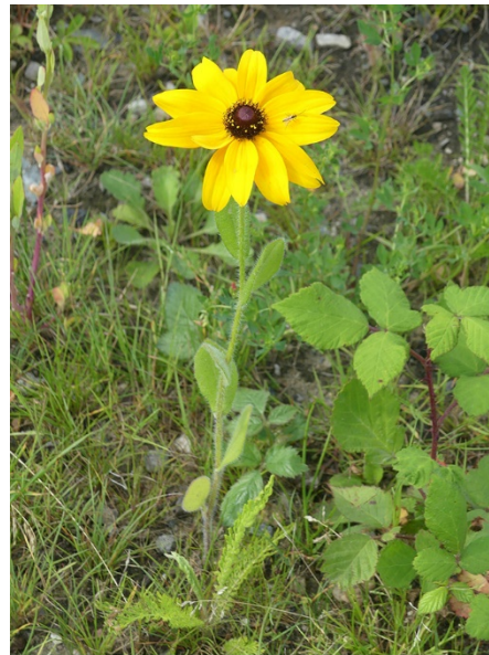
Abb. 26: Rudbeckia hirta in Bergkamen (01.08.2021,).