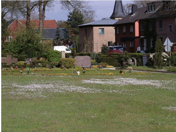
Abb. 1: Cerastium arvense in Dorsten-Hervest (02.05.2021, A. Jagel).