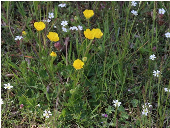
Abb. 25: Ranunculus bulbosus in Dorsten (02.05.2021,).