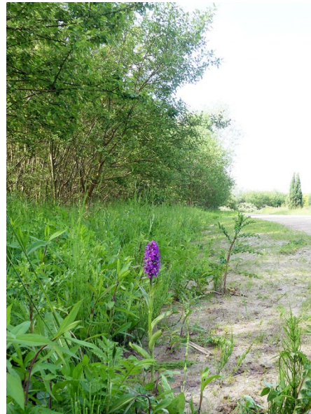
Abb. 10: Dactylorhiza majalis in Bergkamen (03.06.2021,).