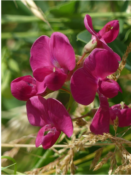
Abb. 15: Lathyrus tuberosus in Bergkamen (20.06.2021,).