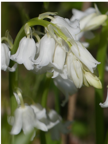
Abb. 13: Hyacinthoides non-scripta 'Alba' in Bergkamen (23.04.2021,).