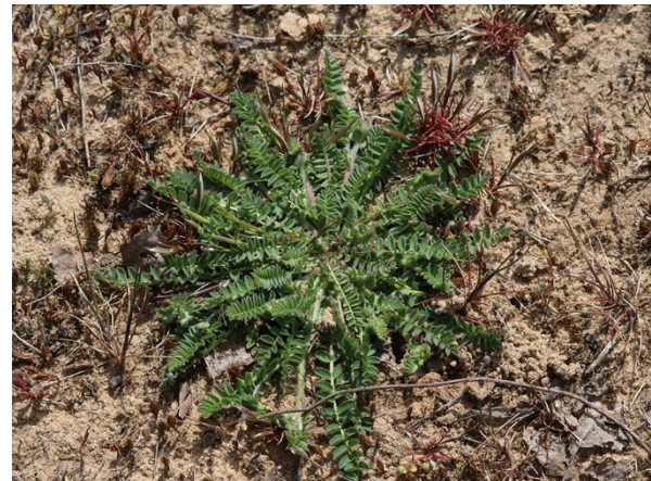
Abb. 20: Ornithopus perpusillus in Dorsten (02.05.2021,).