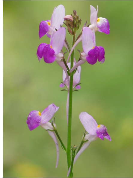
Abb. 16: Linaria maroccana in Selm (20.09.2021,).