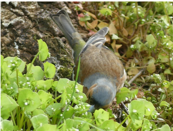
Abb. 5: Buchfink zwischen Claytonia perfoliata in Holzwickede (30.04.2021,).