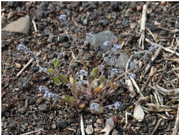
Abb. 19: Myosotis ramosissima in Bochum (06.05.2021,).