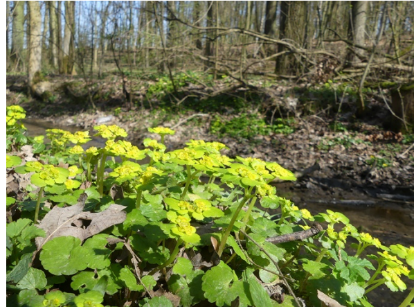
Abb. 2: Chrysosplenium alternifolium in Unna (30.03.2021,).