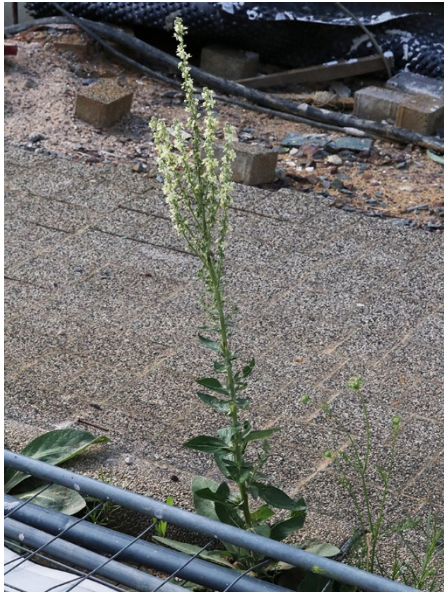
Abb. 27: Verbascum lychnitis in Bochum-Querenburg (07.07.2021,).