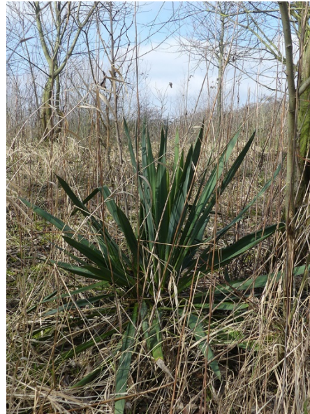
Abb. 28: Yucca filamentosa in Bergkamen (28.02.2021,).