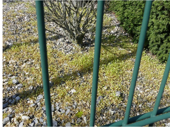
Abb. 4: Claytonia perfoliata in Holzwickede (26.03.2021,).