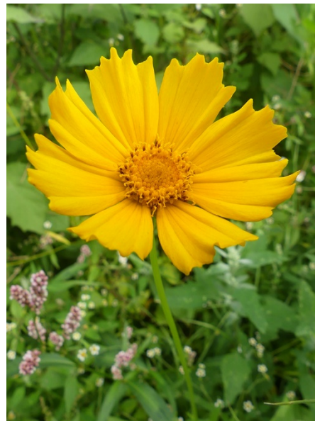
Abb. 6: Coreopsis lanceolata in Bergkamen (21.08.2021,).