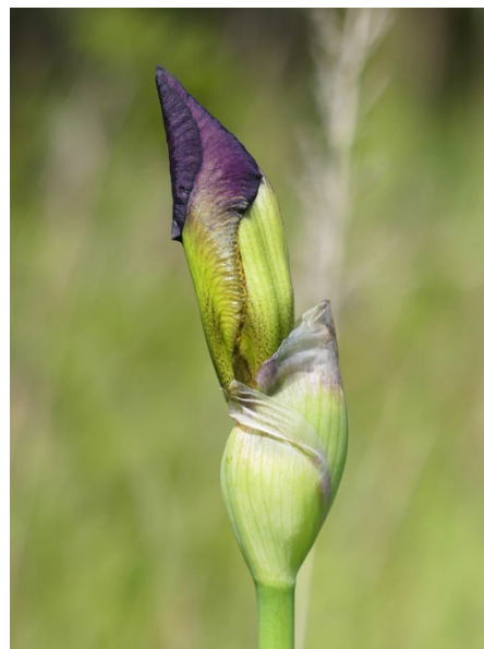
Abb. 14: Iris germanica agg. in Bergkamen (28.05.2021,).