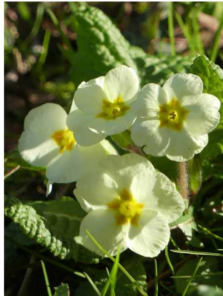
Abb. 24: Primula vulgaris in Unna (29.03.2021,).