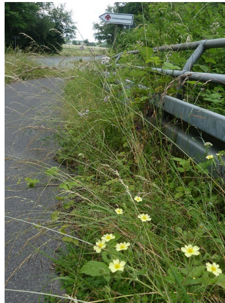
Abb. 22: Potentilla recta in Bergkamen (20.06.2021,).