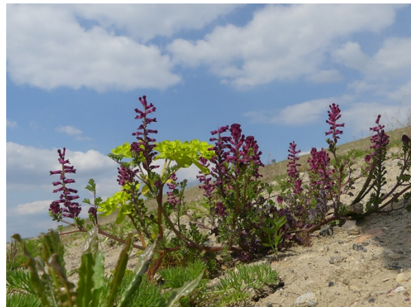
Abb. 12: Fumaria officinalis in Bergkamen (04.05.2021,).