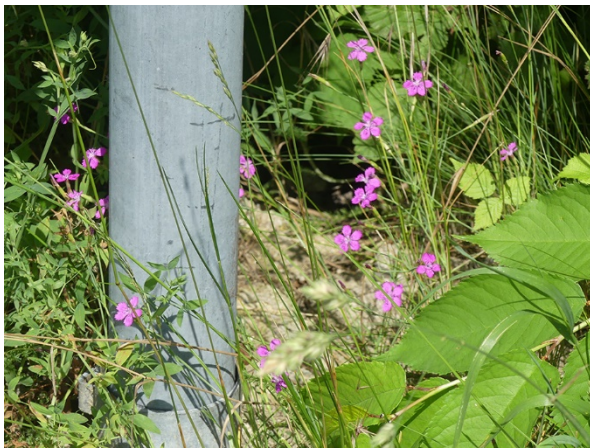
Abb. 11: Dianthus deltoides in Bergkamen (26.06.2021,).