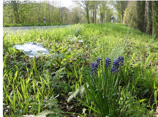
Abb. 18: Muscari botryoides in Unna-Obermassen (20.04.2021,).