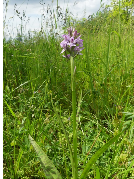
Abb. 8: Dactylorhiza maculata agg. in Bergkamen (12.06.2021,).