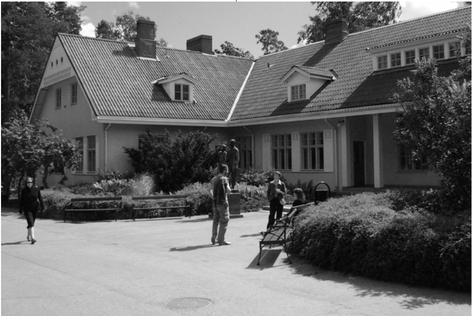
Einige Adaisten vor der finnischen Akademie der Arbeit.

An dieser Stelle möchten wir allen Spenderinnen und Spendern danken, die unsere Reise möglich gemacht haben. Dieser Dank gilt vor allem dem Verein Freunde und Förderer der Akademie der Arbeit e.V., der uns mit einer sehr großzügigen Spende unterstützt hat. Aber auch den anderen zahlreichen Spenderinnen und Spendern gilt unser Dank. Vor allem den Gewerkschaften ver.di und IG Metall, der Hans-Böckler-Stiftung, der Heimvolkshochschule Hustedt, den Abgeordneten der Linksfraktion im Bundestag und der SPD.