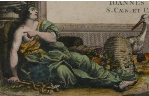
Detail aus dem Titelblatt der Holzhausen-Sammlung; Historisches Museum Frankfurt, Graphische Sammlung, Inv.Nr. C1259.

Der Handelsgott Merkur und der Flussgott Moenus säumen das Titelblatt der Holzhausen-Porträtsammlung: Die Allegorien zeigen deutlich, welche wichtige Stellung dem Frankfurt der Frühen Neuzeit zukam – und die Ikonographie offenbart noch weitere Geheimnisse der Stadtgeschichte.