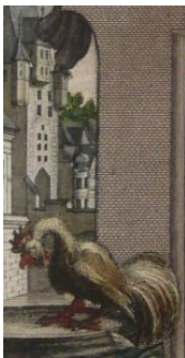
Detail aus dem Titelblatt

Das prunkvolle Wappen mit dem nimbierten Doppeladler unter der habsburgischen Krone verdeutlicht die Position Frankfurts als freie Reichsstadt. Es wird beidseits in symmetrischer Spiegelung durch das bis heute gebräuchliche Frankfurter Stadtwappen flankiert – den gekrönten und züngelnden weißen Adler auf rotem Grund. Zu beiden Seiten der Schauarchitektur ist ausschnittshaft das historische Stadtbild Frankfurts erkennbar, wobei die heute zerstörten Brückentürme der Alten Brücke markant hervortreten. 2