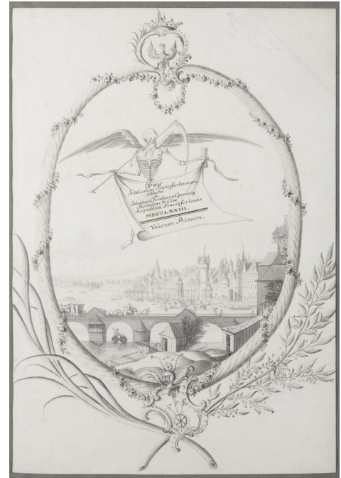
Titelblatt der Gerning'schen Sammlung (HMF, Inv. Nr. C22694)

Die sich hier zwar deutlich unterscheidende Gestaltung des Titeltupfers bringt dennoch gleichermaßen unübersehbar die eigene Identifizierung mit der Heimatstadt und ihren Persönlichkeiten zum Ausdruck. Eine weitere Funktion, die der Federzeichnung Gernings ebenso wie dem ausführlich behandelten Titelblatt zukommt, ist die Unterstützung bei der Einordnung der Sammlung in den zeitlichen, sozialen sowie kunsthistorischen Kontext. Darüber hinaus bietet es Anregungen zur Auseinandersetzung mit der Frankfurter Stadt- und Familiengeschichte und bildet somit einen wichtigen Ausgangspunkt für die Betrachtung der gesamten Sammlung als Konvolut.