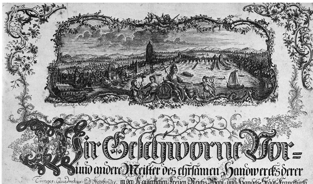
Frankfurter Handwerksurkunde von 1778 (HMF, Inv. Nr. C 12315 u. C 26229)