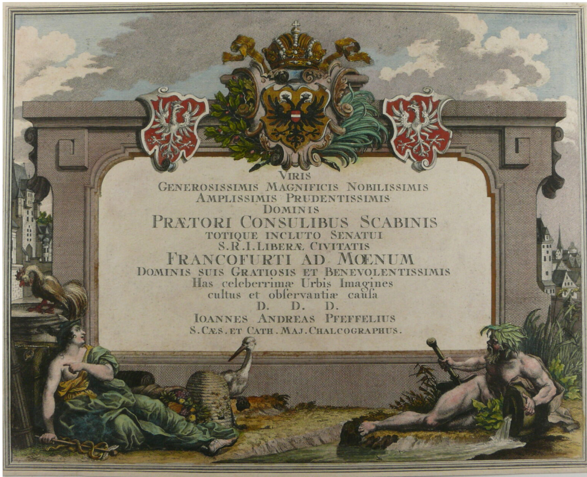
Historisches Museum Frankfurt, Graphische Sammlung, Inv.Nr. C1259

Das prunkvolle Wappen mit dem nimbierten Doppeladler unter der habsburgischen Krone verdeutlicht die Position Frankfurts als freie Reichsstadt. Es wird beidseits in symmetrischer Spiegelung durch das bis heute gebräuchliche Frankfurter Stadtwappen flankiert – den gekrönten und züngelnden weißen Adler auf rotem Grund. Zu beiden Seiten der Schauarchitektur ist ausschnittshaft das historische Stadtbild Frankfurts erkennbar, wobei die heute zerstörten Brückentürme der Alten Brücke markant hervortreten. 2