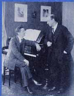
Arnold Schönberg und Alexander Zemlinsky am Klavier