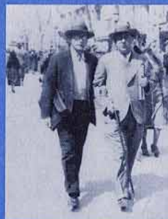
Arnold Schönberg und Anton Webern in Berlin, 1927