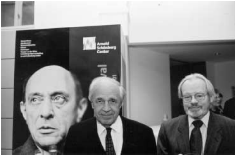
Pierre Boulez und Friedrich Cerha am Arnold Schönberg Center