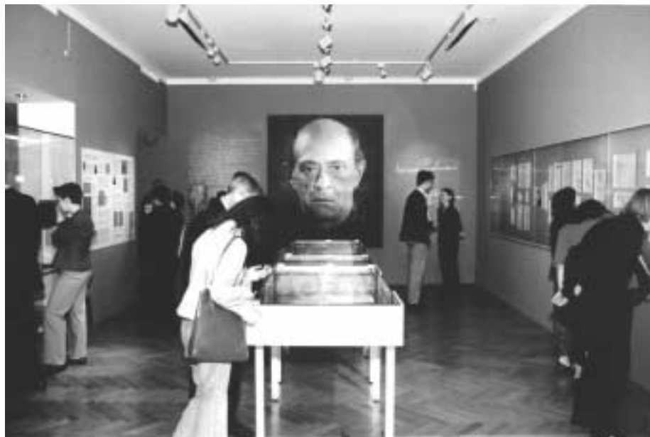
Ausstellung »Arnold Schönberg und sein Gott«