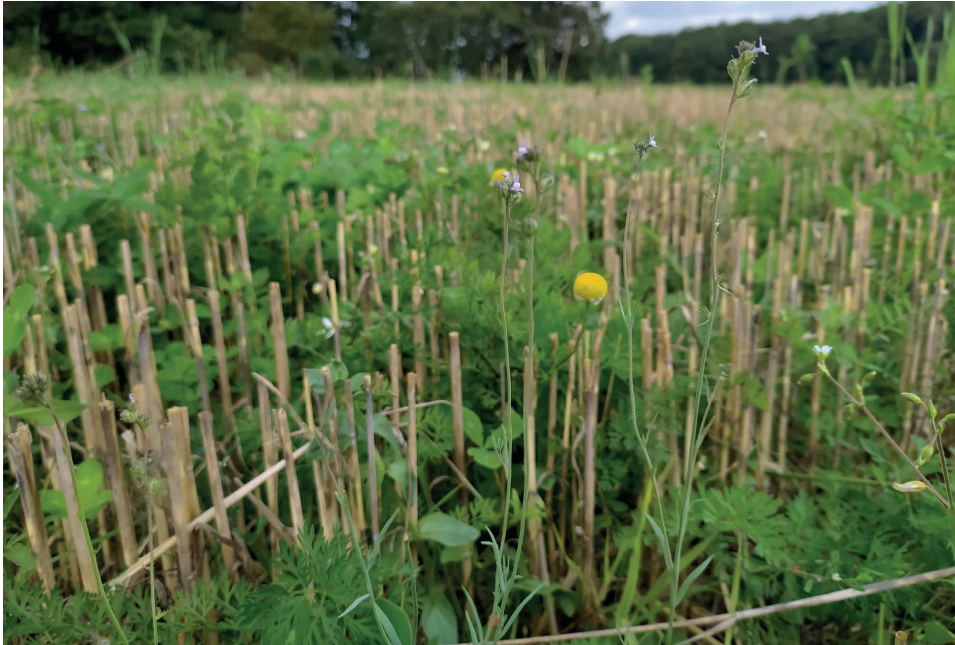
Abb. 1: Linaria arvensis auf einem Stoppelacker bei Frankenbach (Lahn-Dill-Kreis); 10. Sept. 2021, A. Händler. – Linaria arvensis in a stubble field near Frankenbach (Lahn-Dill district).

Tab. 4 listet alle Beobachter der untersuchten Fundstellen mit Positiv- und Negativnachweise auf.