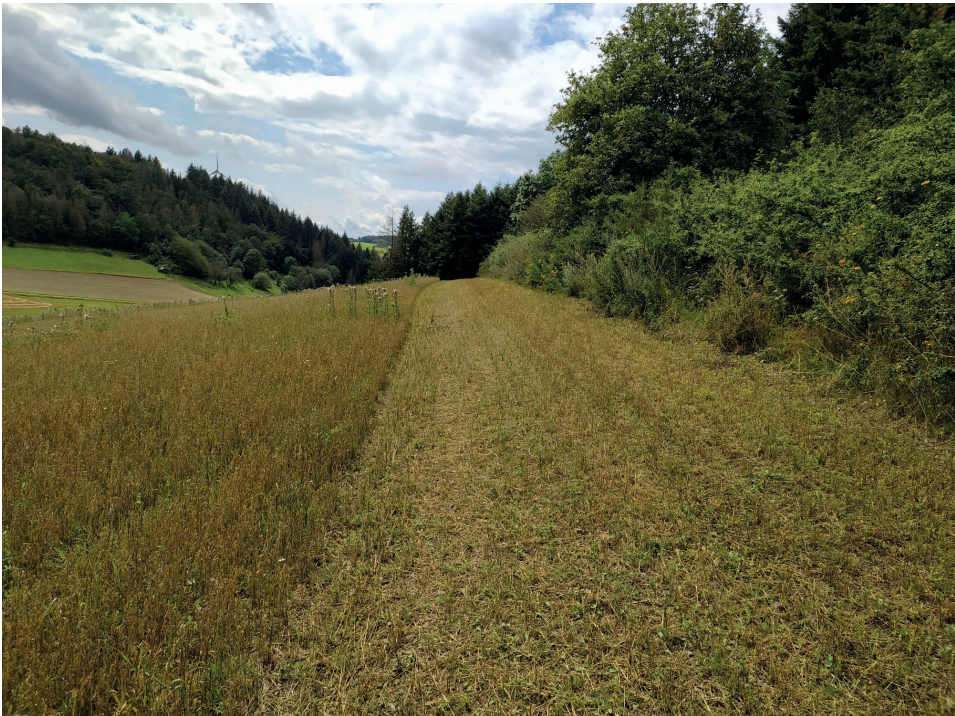
Abb. 3: Acker am Auleberg bei Schlierbach; 10. Aug. 2021, A. Händler. – Field at the Auleberg near Schlierbach.

Um die Population in Frankenbach zu sichern, wurden Samen für eine Erhaltungskultur gesammelt. Die Aussaat erfolgte in den Gewächshäusern der Universität Gießen – Landschaftsökologie und Landschaftsplanung (Prof. Kleinebecker).