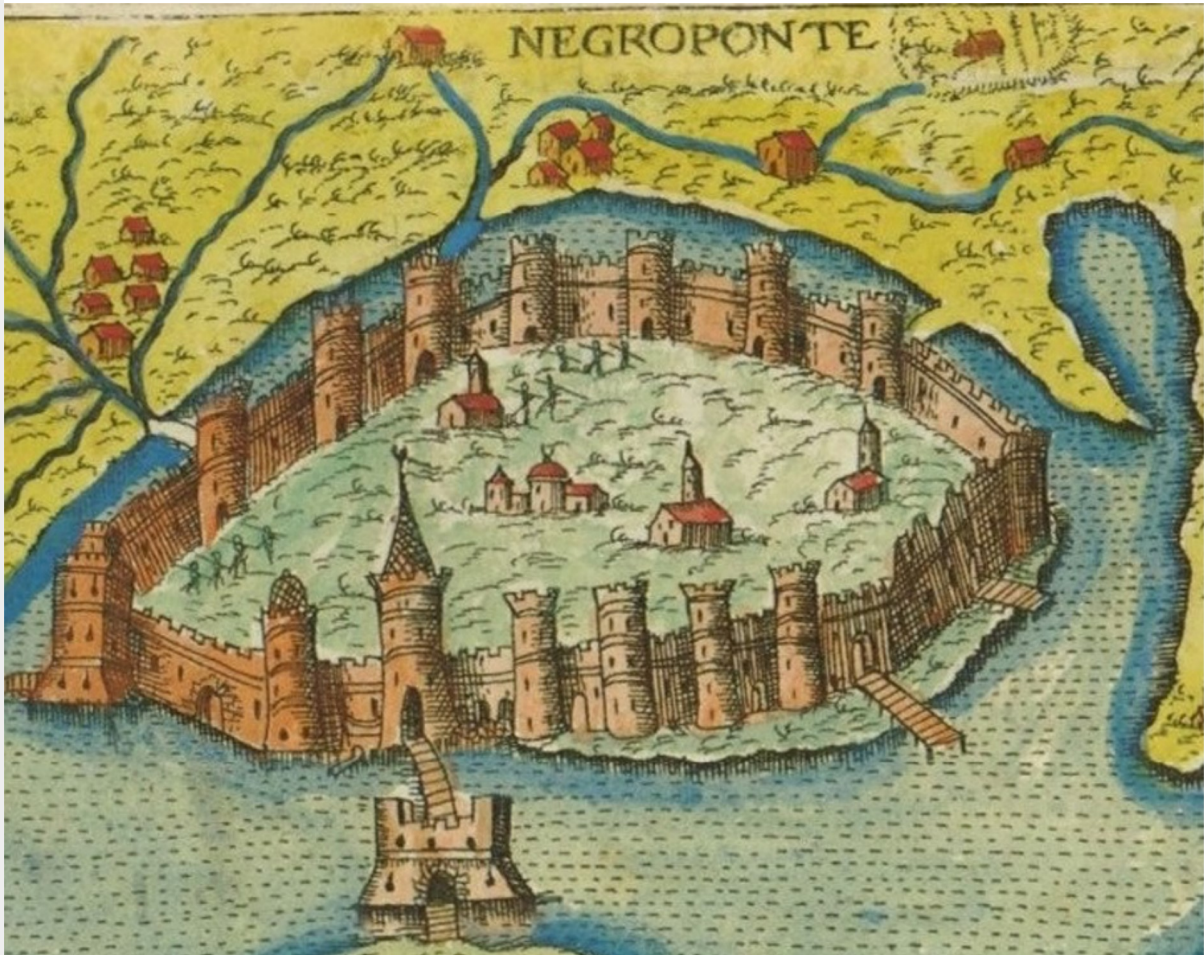
Karte von Negroponte (1597), Giacomo Franco

Gefördert von der DFG 2016-2019, Goethe Universität Frankfurt, Dr. Saskia Dönitz