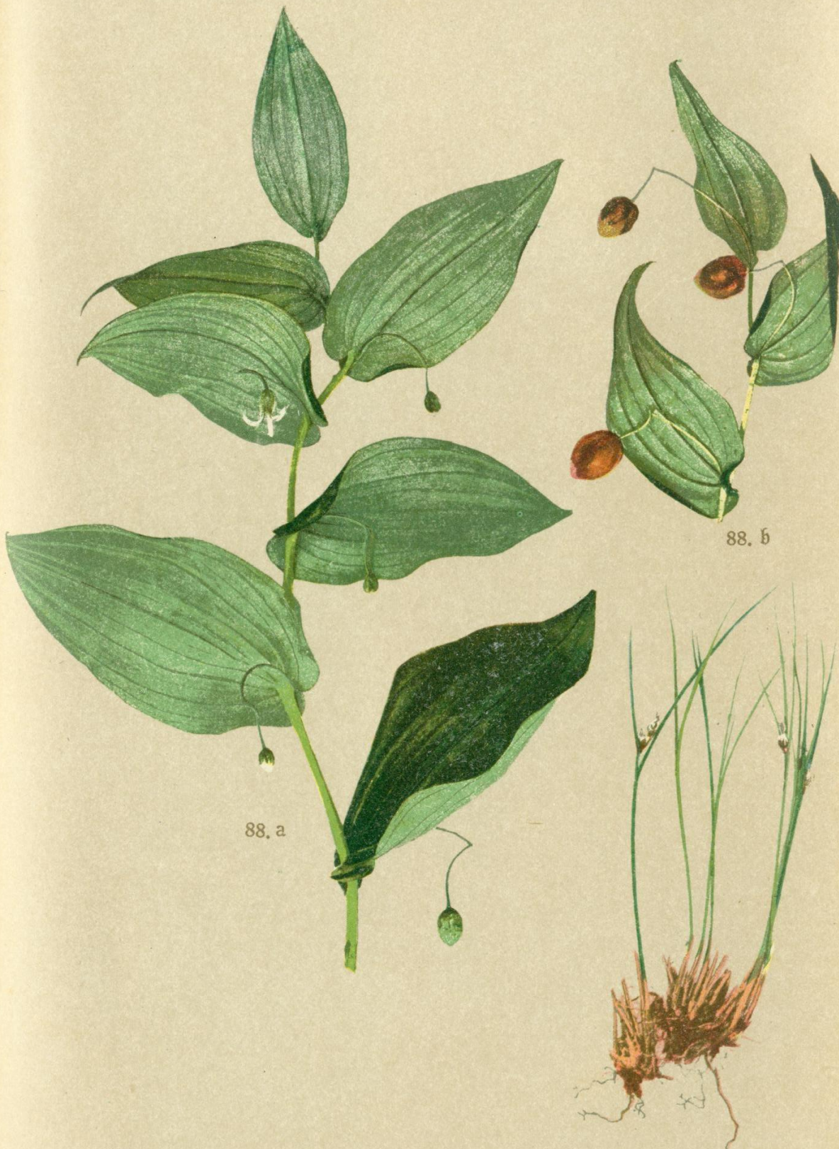
88. Streptopus amplexifolius DC. Stengelumfassendes Zapfenkraut.