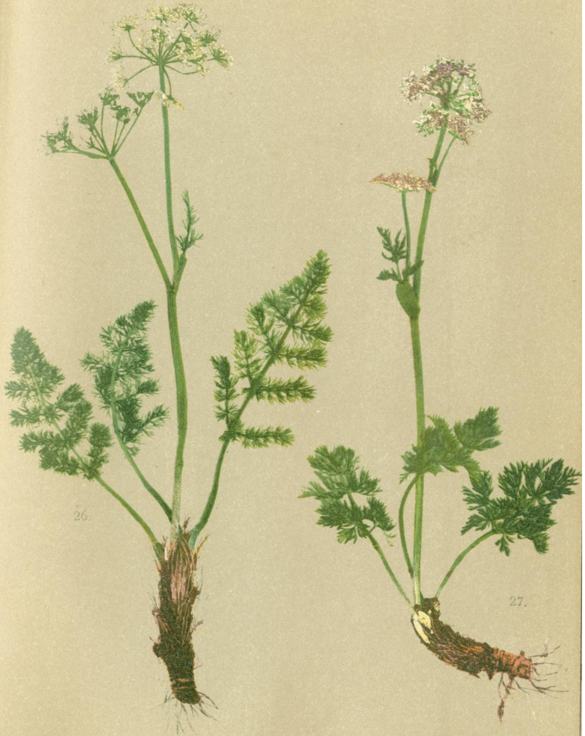
26. Meum athamanticum Jacq. Haarblättrige Bärwurz.