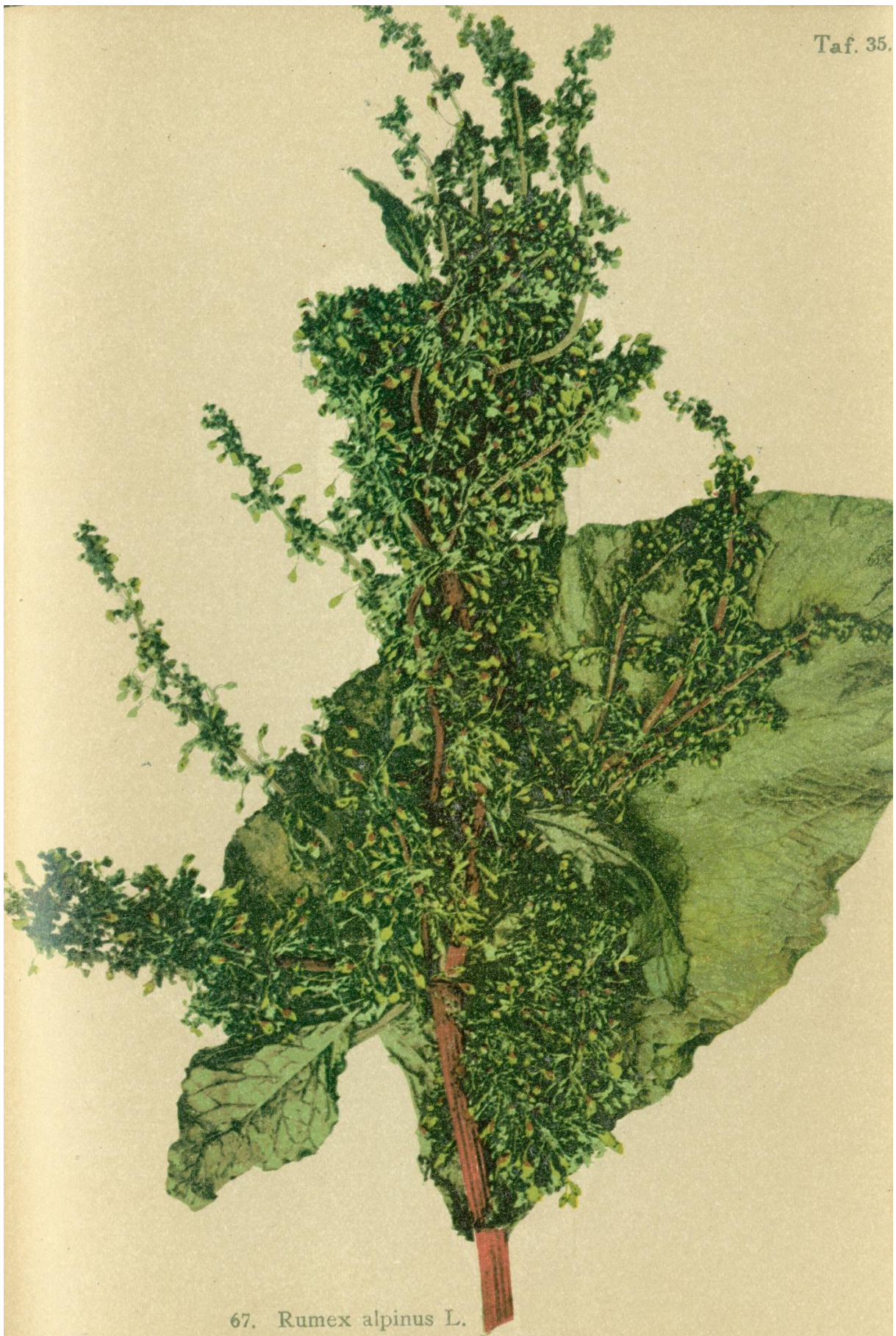
67. Rumex alpinus L. Gebirgs-Ampfer.