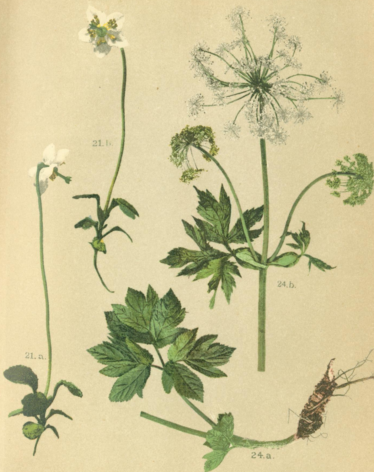
21. Pirola uniflora L. Einblütiges Wintergrün.