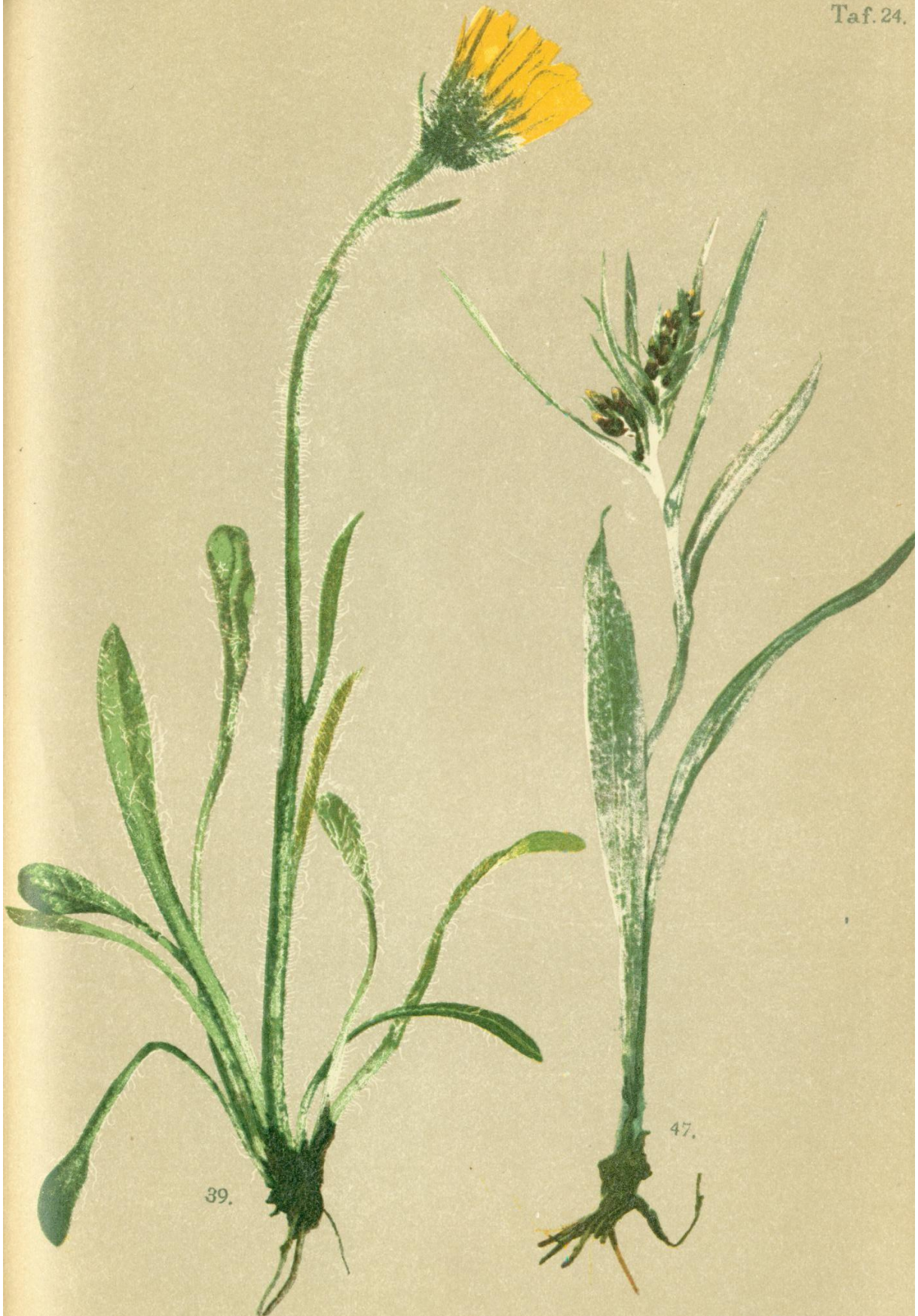
39. Hieracium alpinum L. Gebirgs-Habichtskraut.