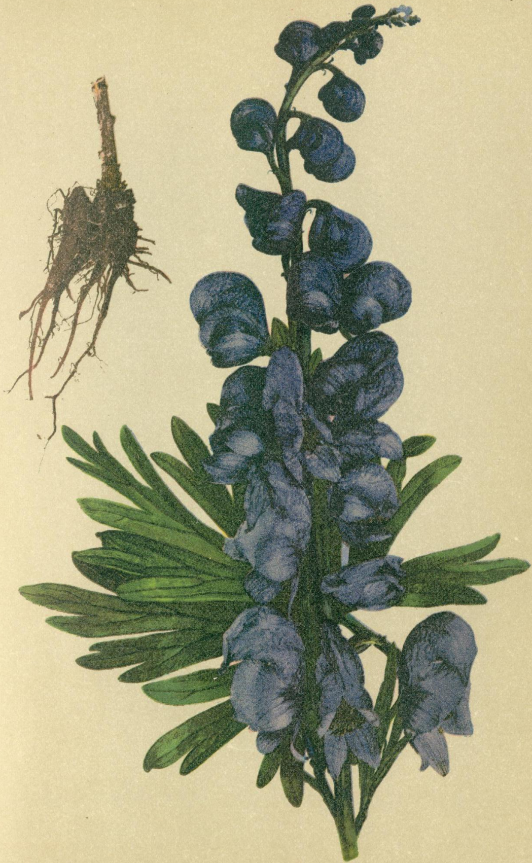
2. Aconitum Napellus L. Wahrer Sturmhut, Eisenhut, Fuchswurzel.