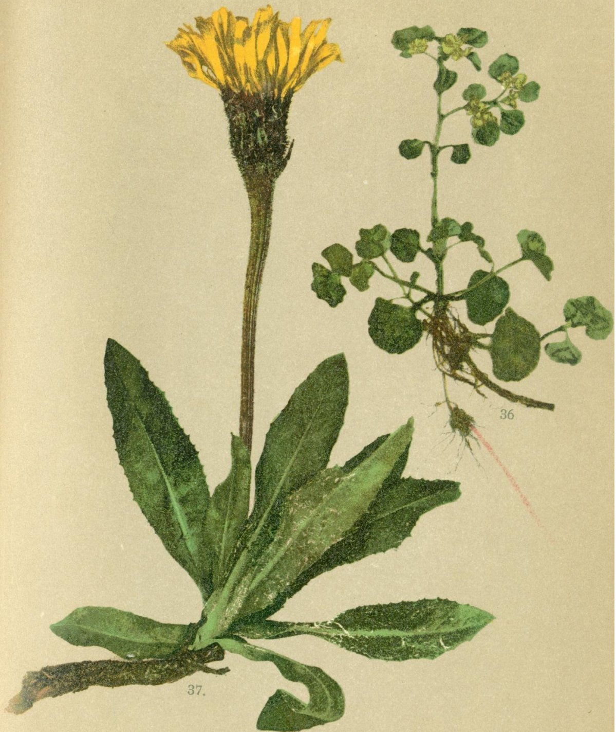
37. Achyrophorus uniflorus Bl. Einblütiger Hachekopf.