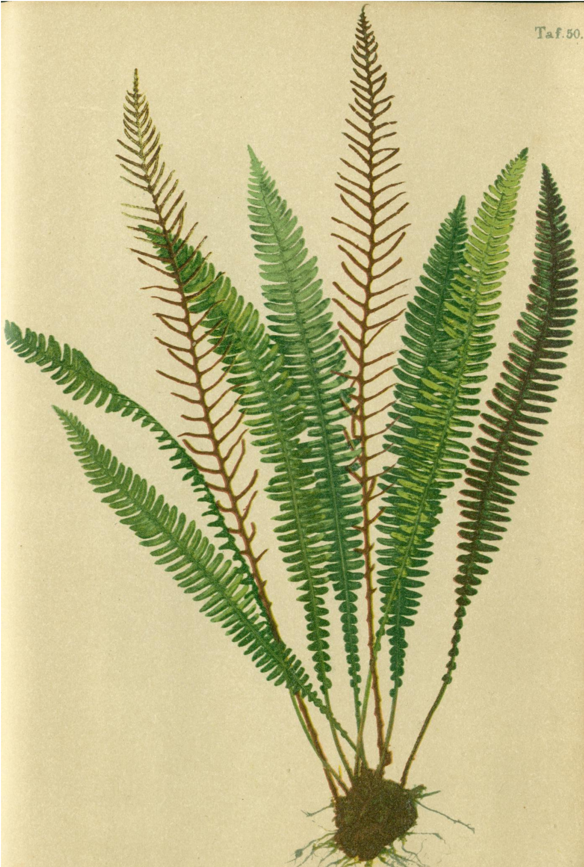
98. Blechnum Spicant With. Stippenfarn.