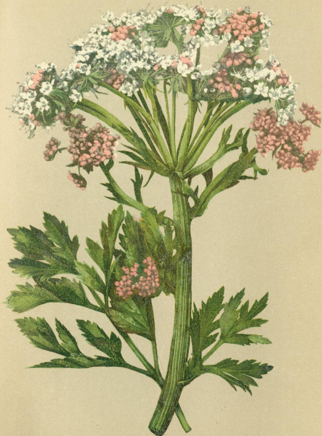
25. Pleurospermum austriacum Hoffm.