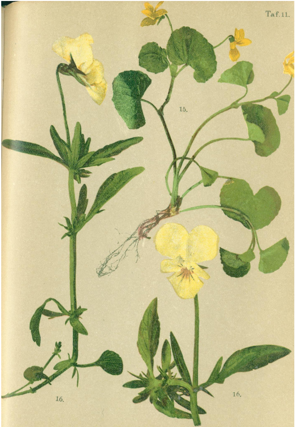
15. Viola biflora L. Zweiblitiges Veilchen.