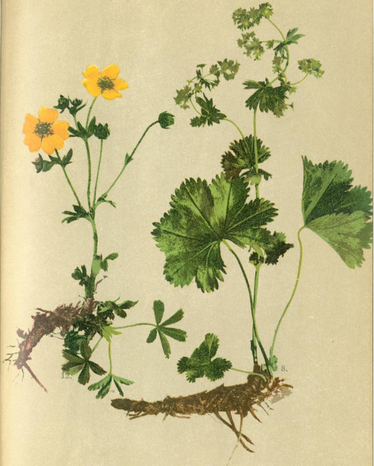
12. Potentilla aurea L. Goldblumiges Fingerkraut.