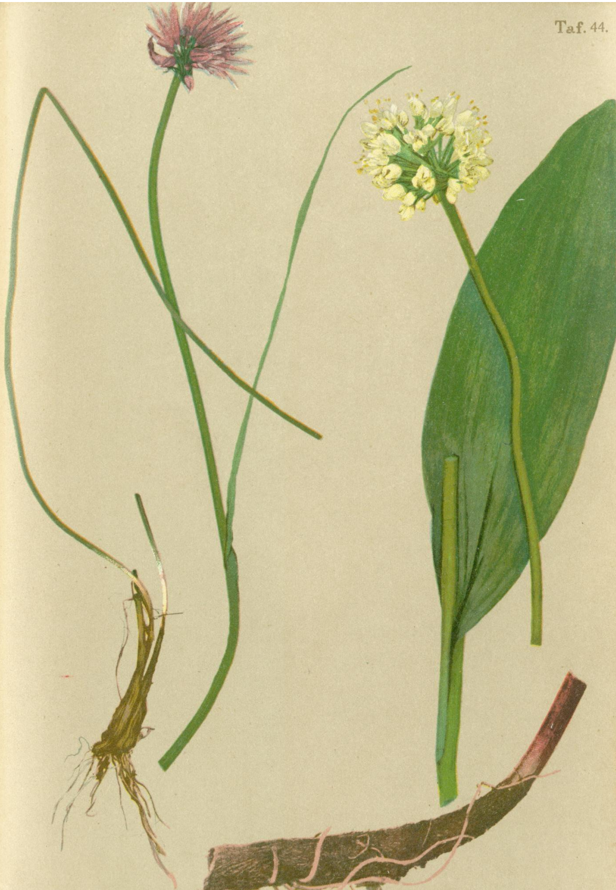
87. Allium sibiricum Willd. Sibirischer Schnittlauch.