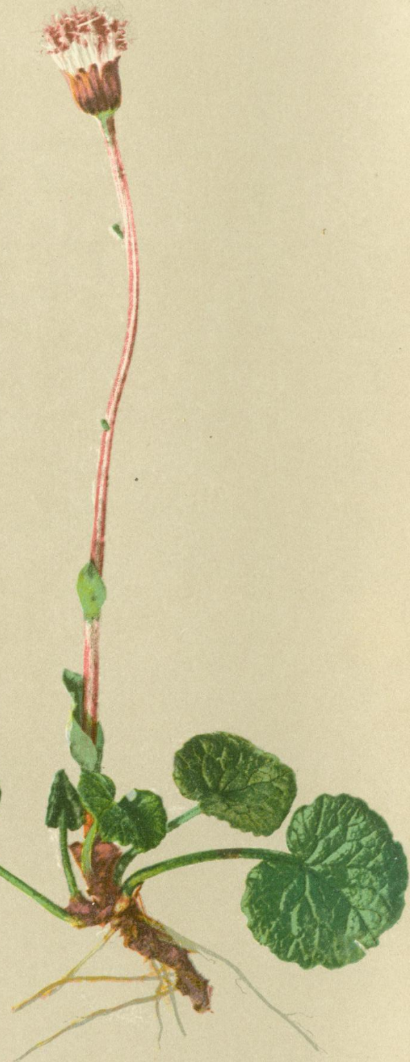
45. Homogyne alpina Cass. Gebirgs = Brandlattich.