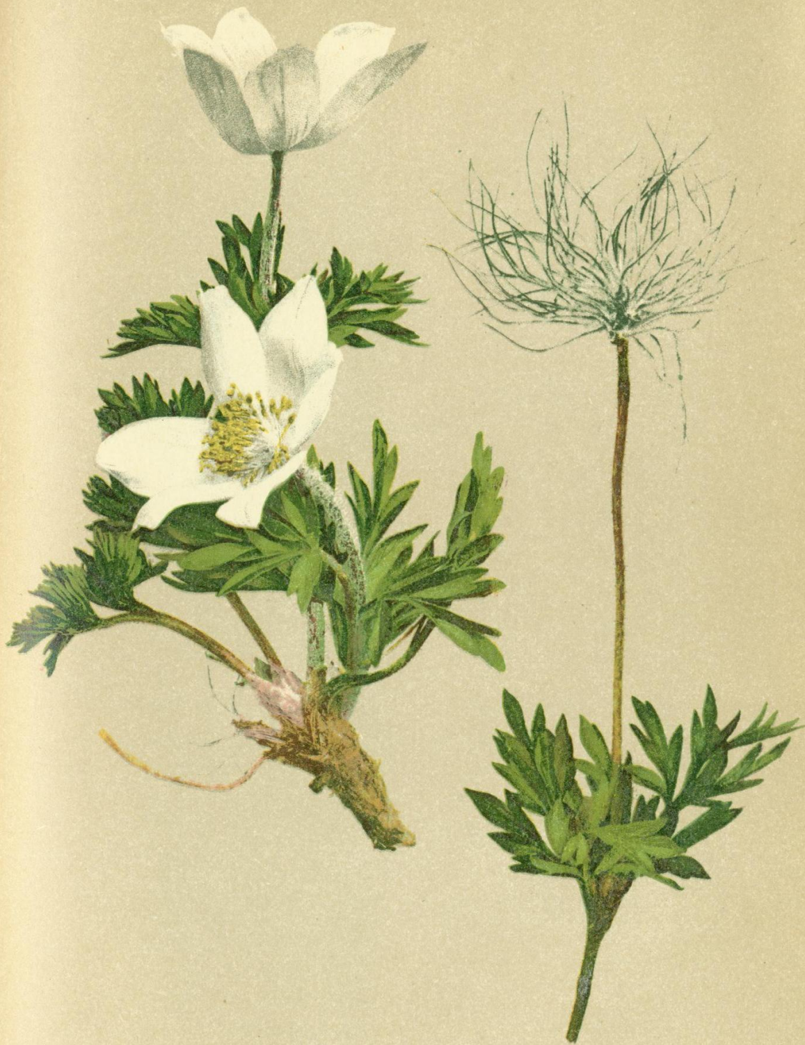
4. Pulsatilla alpina Delarb. (Anem. alp. L.) Teufelsbart.