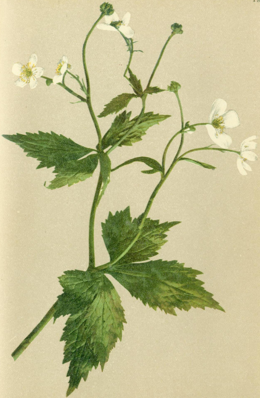
5. Ranunculus aconitifolius L. Sturmhutblättriger Hahnenfuß.