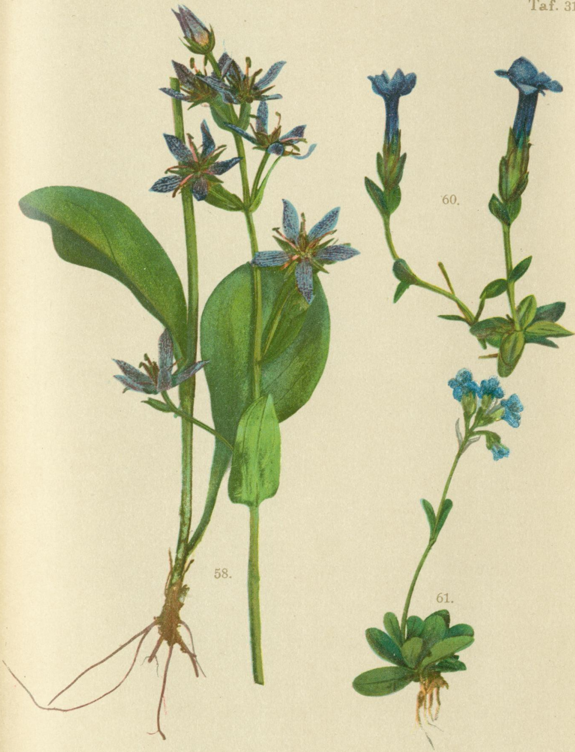
58. Sweertia perennis L. Ausdauernde Sweertie.