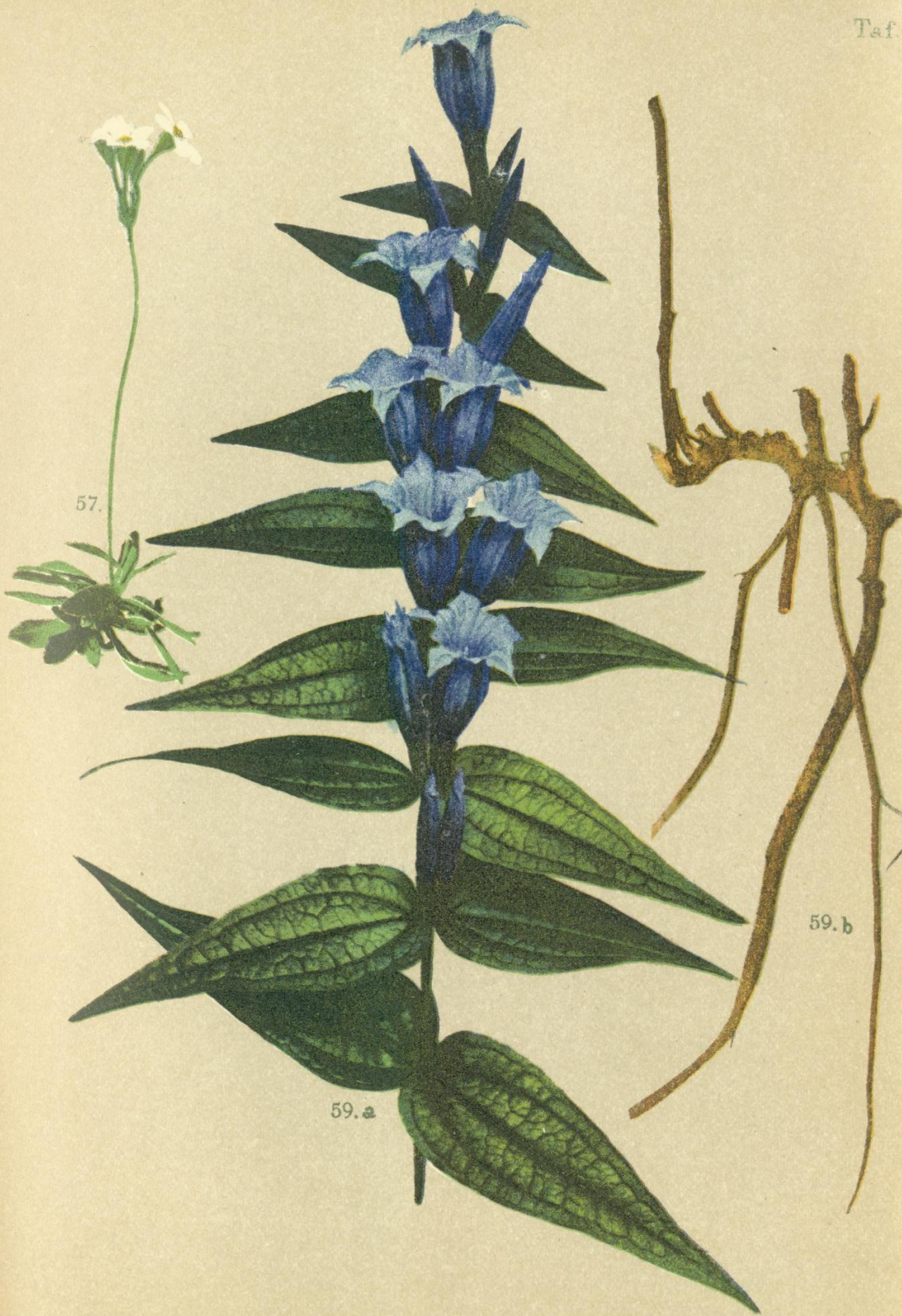
57. Androsace obtusifolia All. Stumpflättriger Mannschilb.