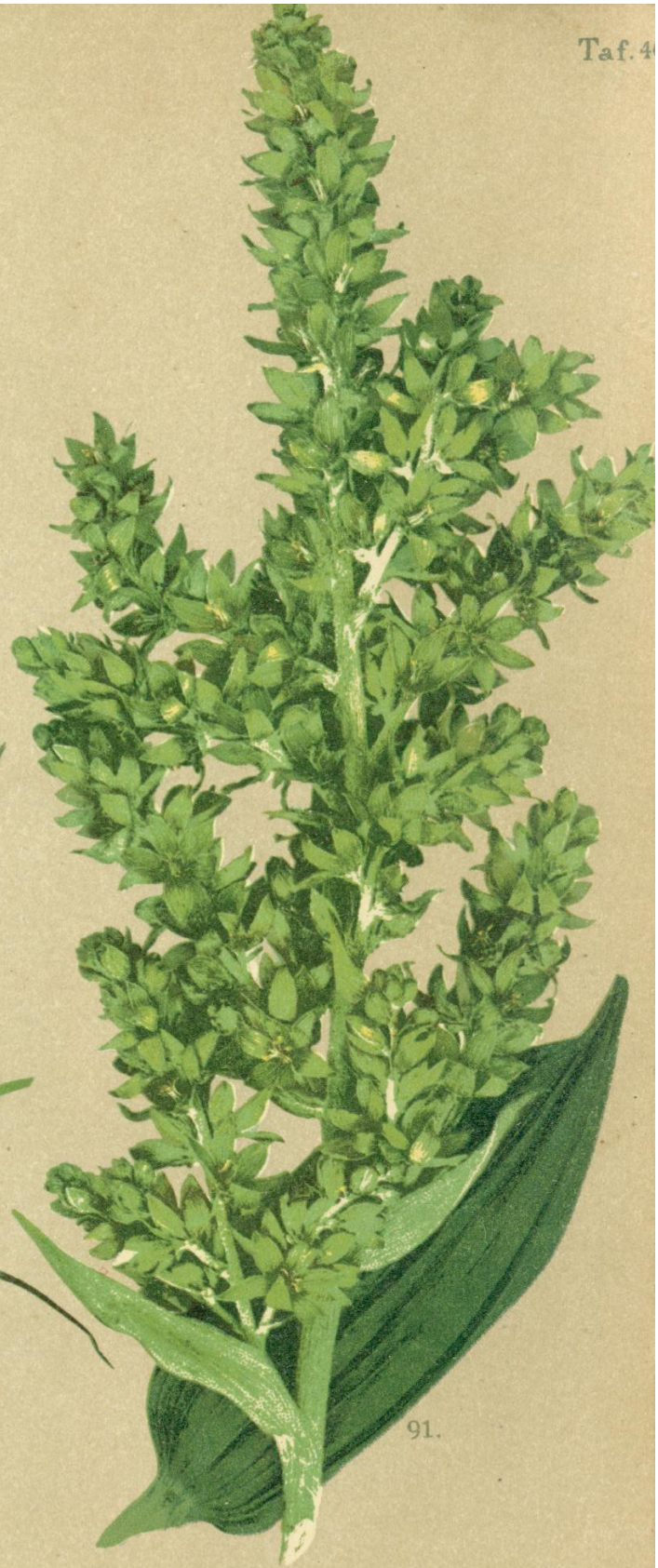
91. Veratrum Lobelianum Bernh. Germer, Wendedoche, Oibog.