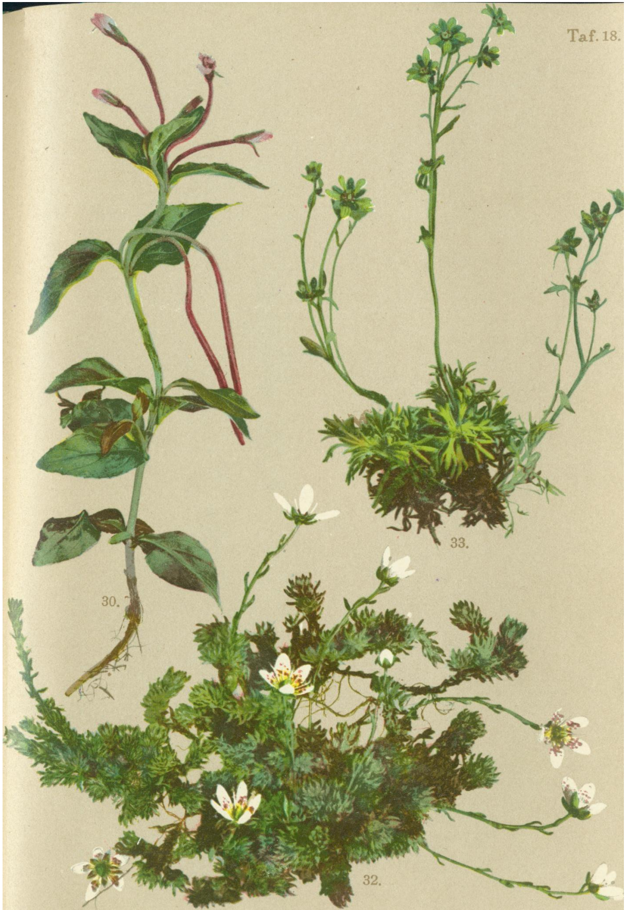
30. Epilobium alsinefolium Vill. 32. Saxifraga bryoides L. 33. Saxifraga muscoides W Dostenblättriges Weidenröschchen. Knotenmoosartiger Steinbrech. Moosartiger Steinbrech.