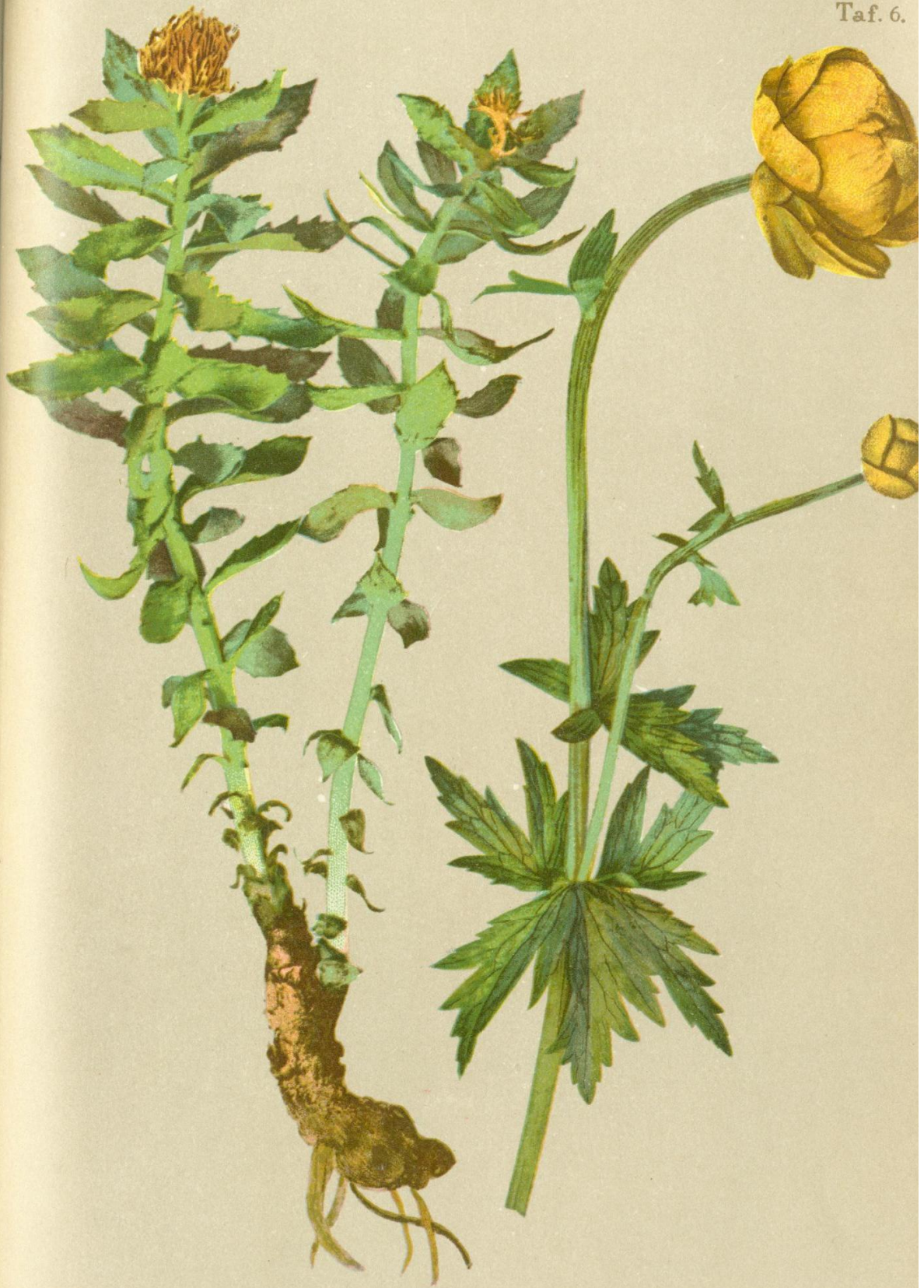
7. Rhodiola rosea L. Rosenwurz.