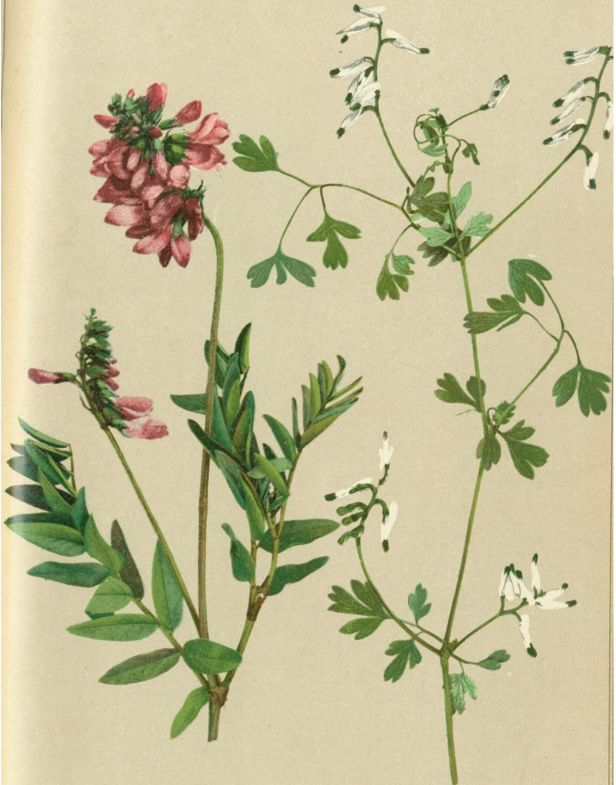
13. Hedysarum obscurum L. Gebirgs-Süßflie.