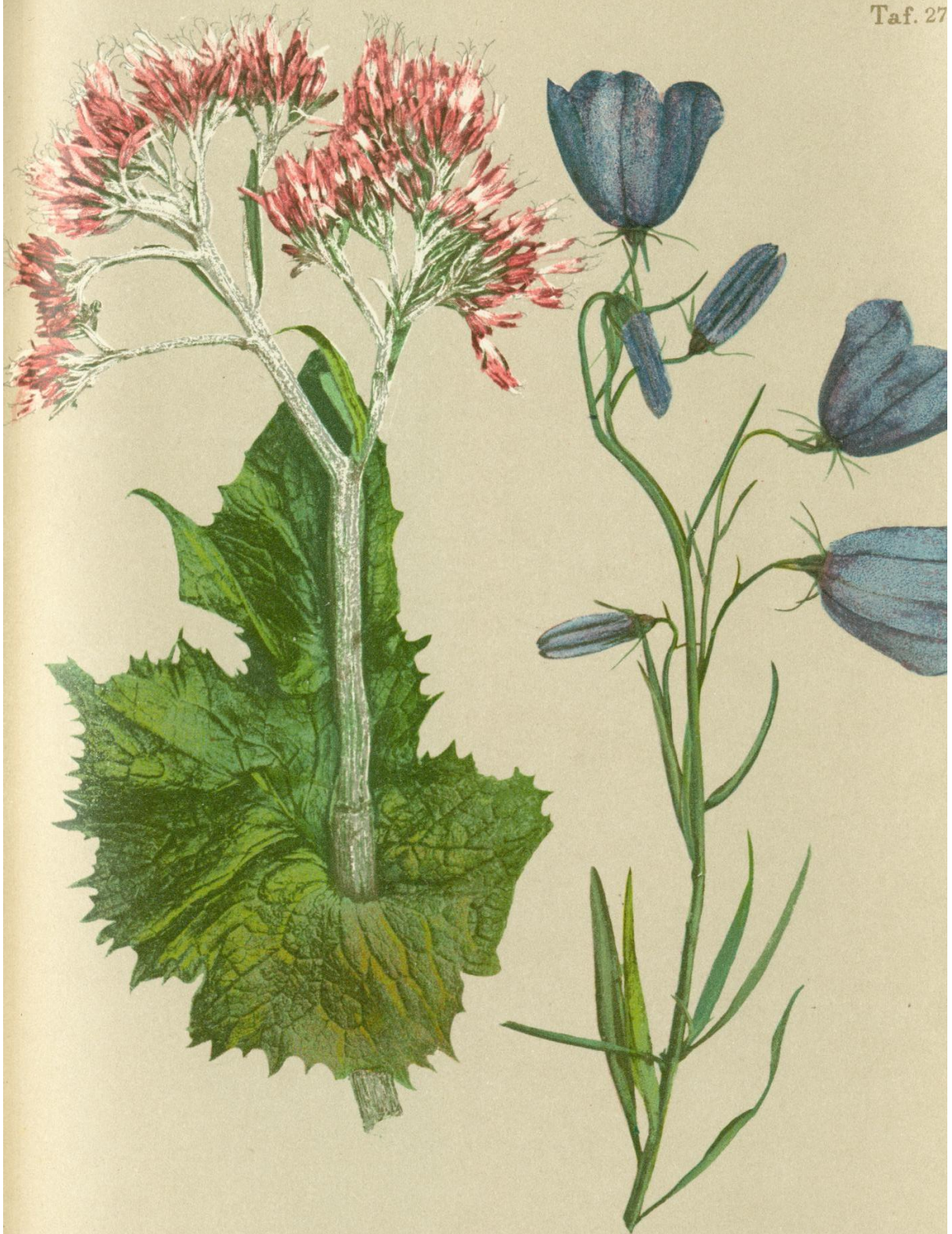
46. Adenostyles albifrons Rchb. Graublättrige Pestwurz.