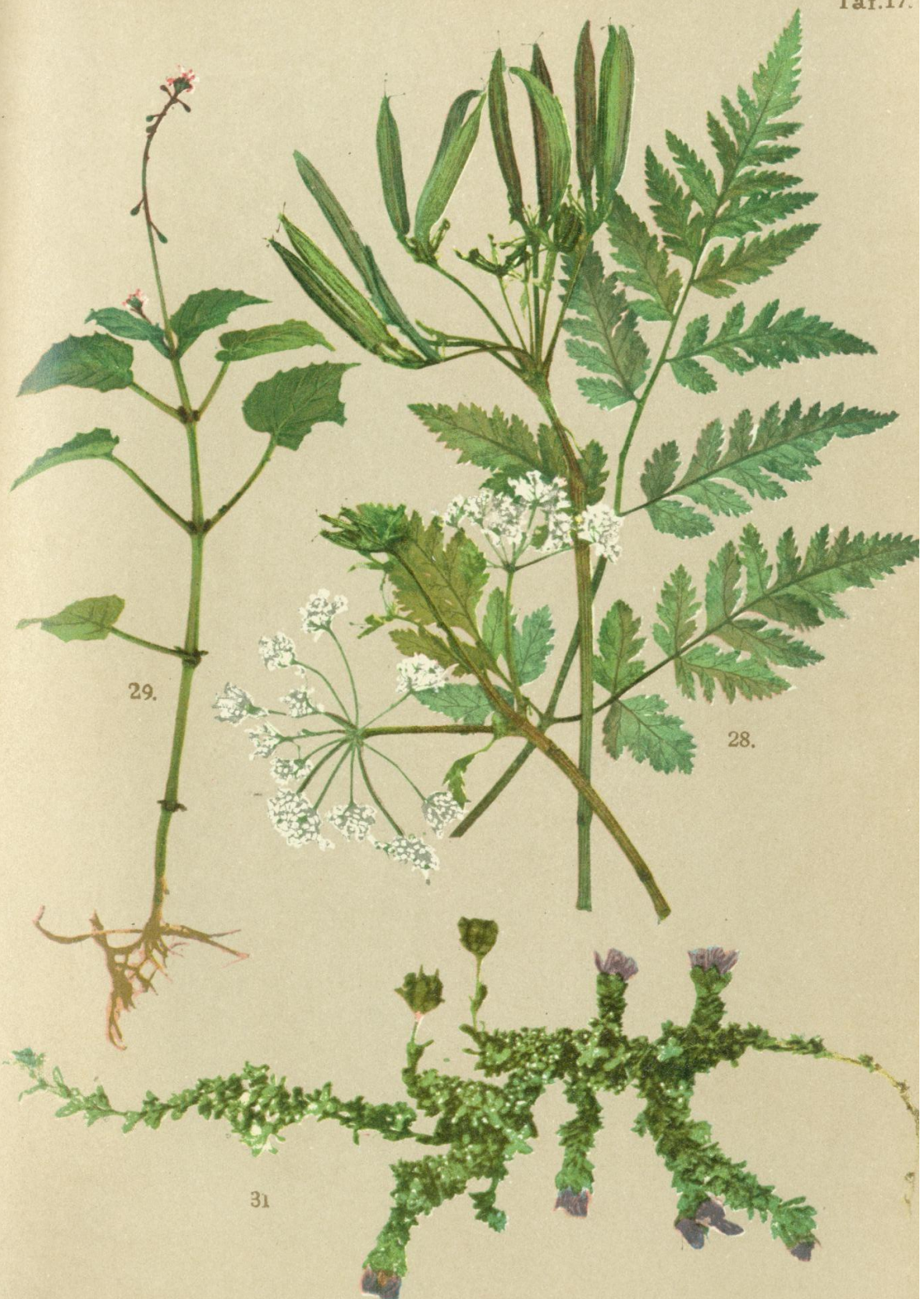
28. Myrrhis odorata Scop. Wohlfriechende Süßholde.