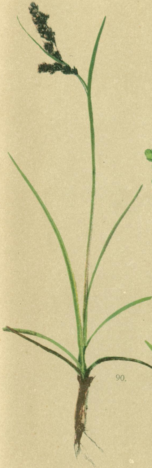
90. Luzula spicata DC. Ähriger Marbel.