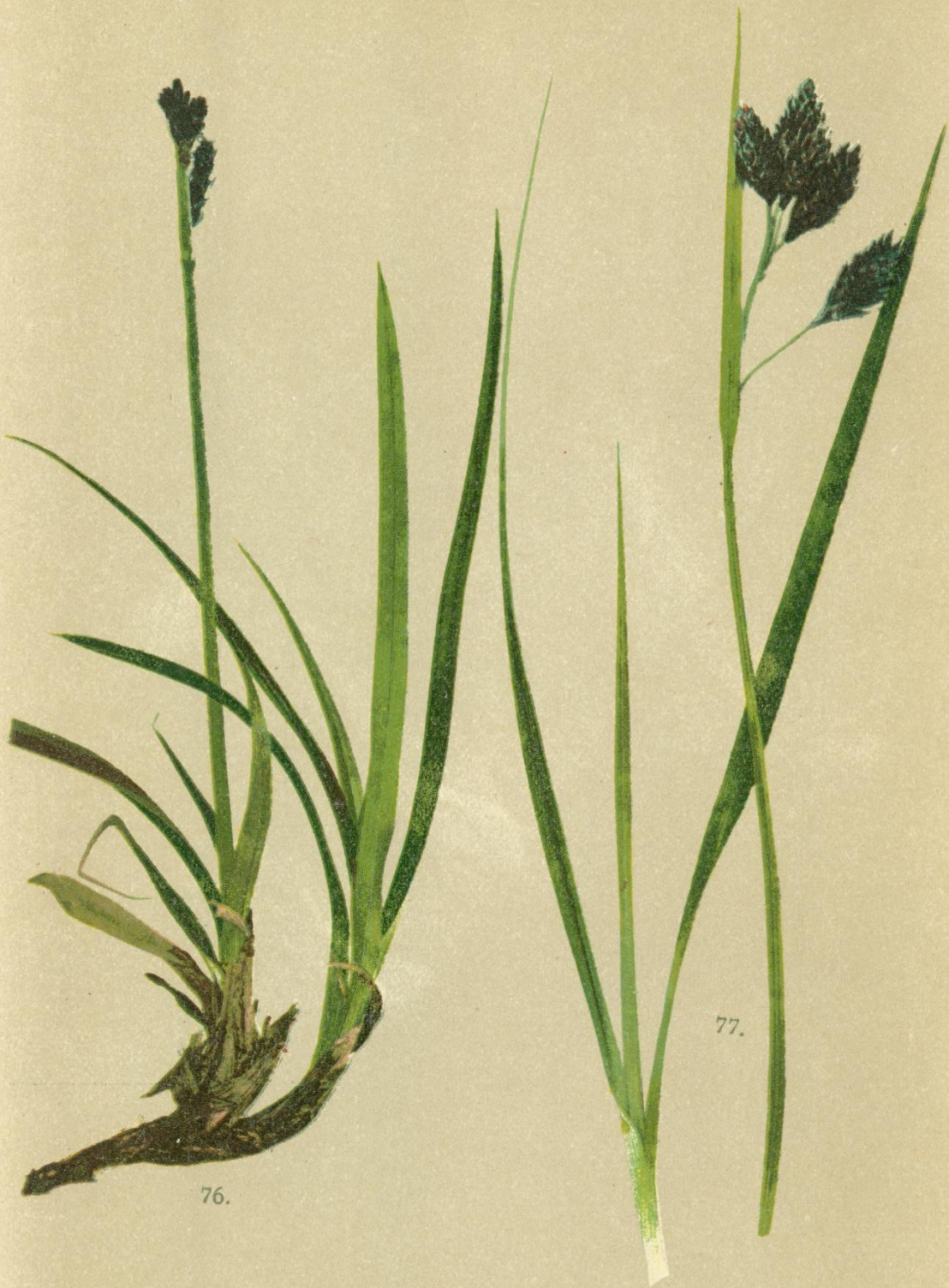
76. Carex rigida Good. Starre Segge.