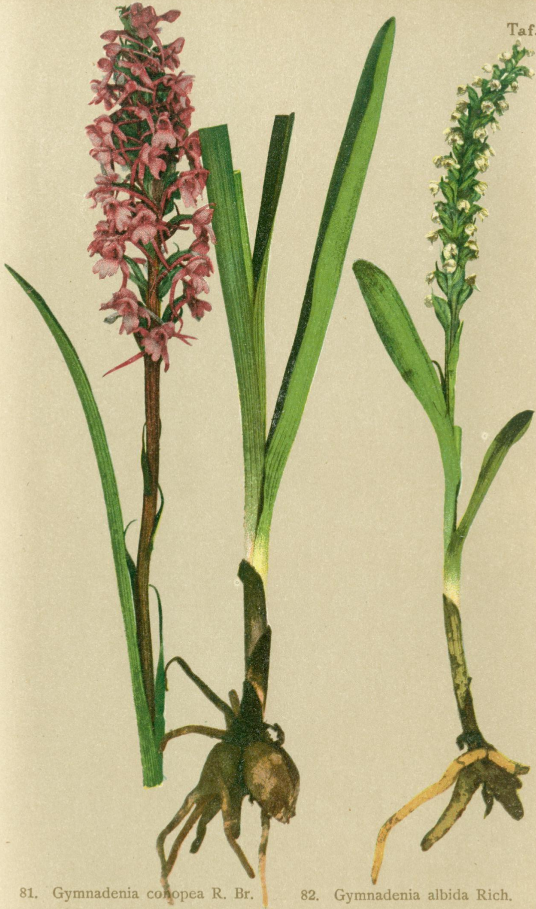
81. Gymnadenia conopsea R. Br. Fliegenartige Höswurz.