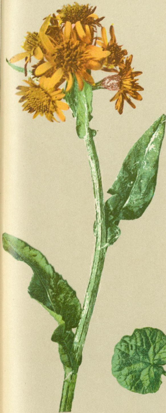
43. Senecio crispatus DC. (Var. sudeticus .) Sudeten = Baldgreiß.