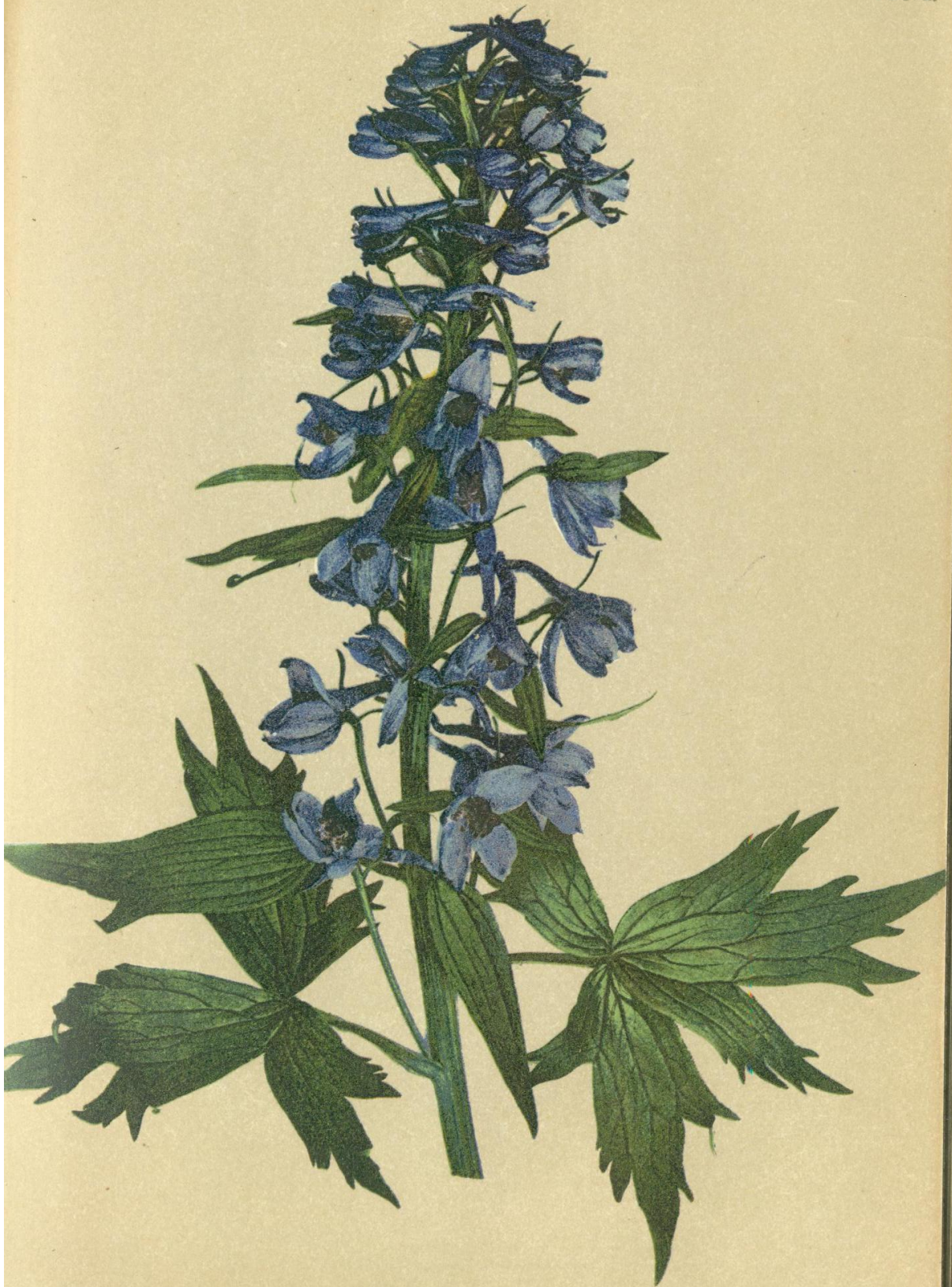
1. Delphinium elatum L. Hoher Rittersporn.