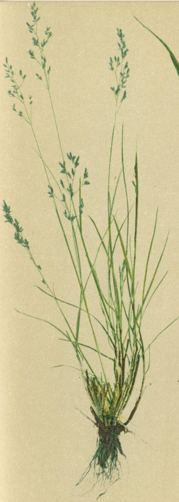
72. Agrostis rupestris All. Felsen-Straußgras.