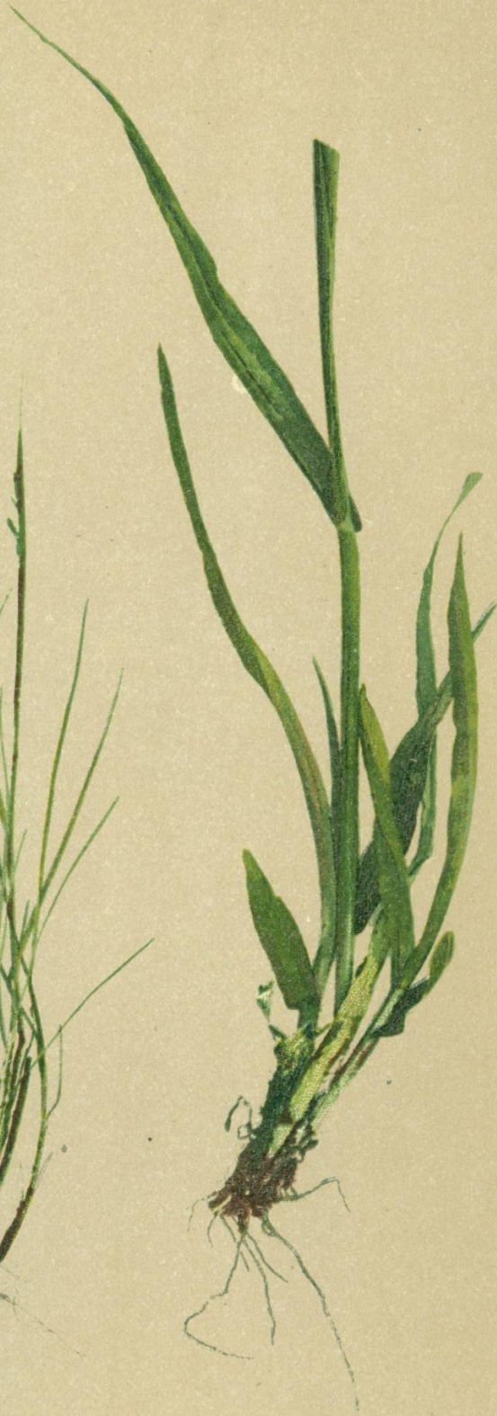
73. Phleum alpinum L. Gebirgs-Lieschgras.