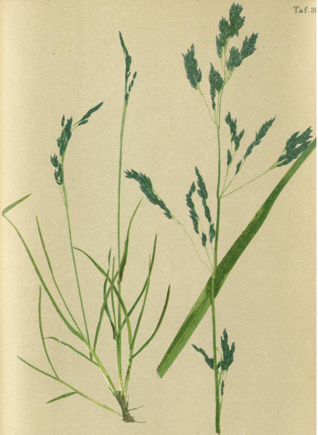
74. Poa laxa Haenke. Schlaffes Nispengras.