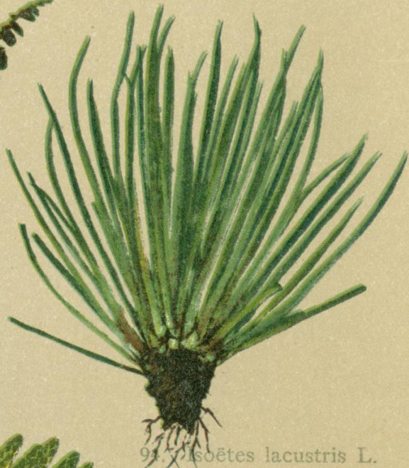
97. Isoetes lacustris L. Sumpf-Brachsenkraut.