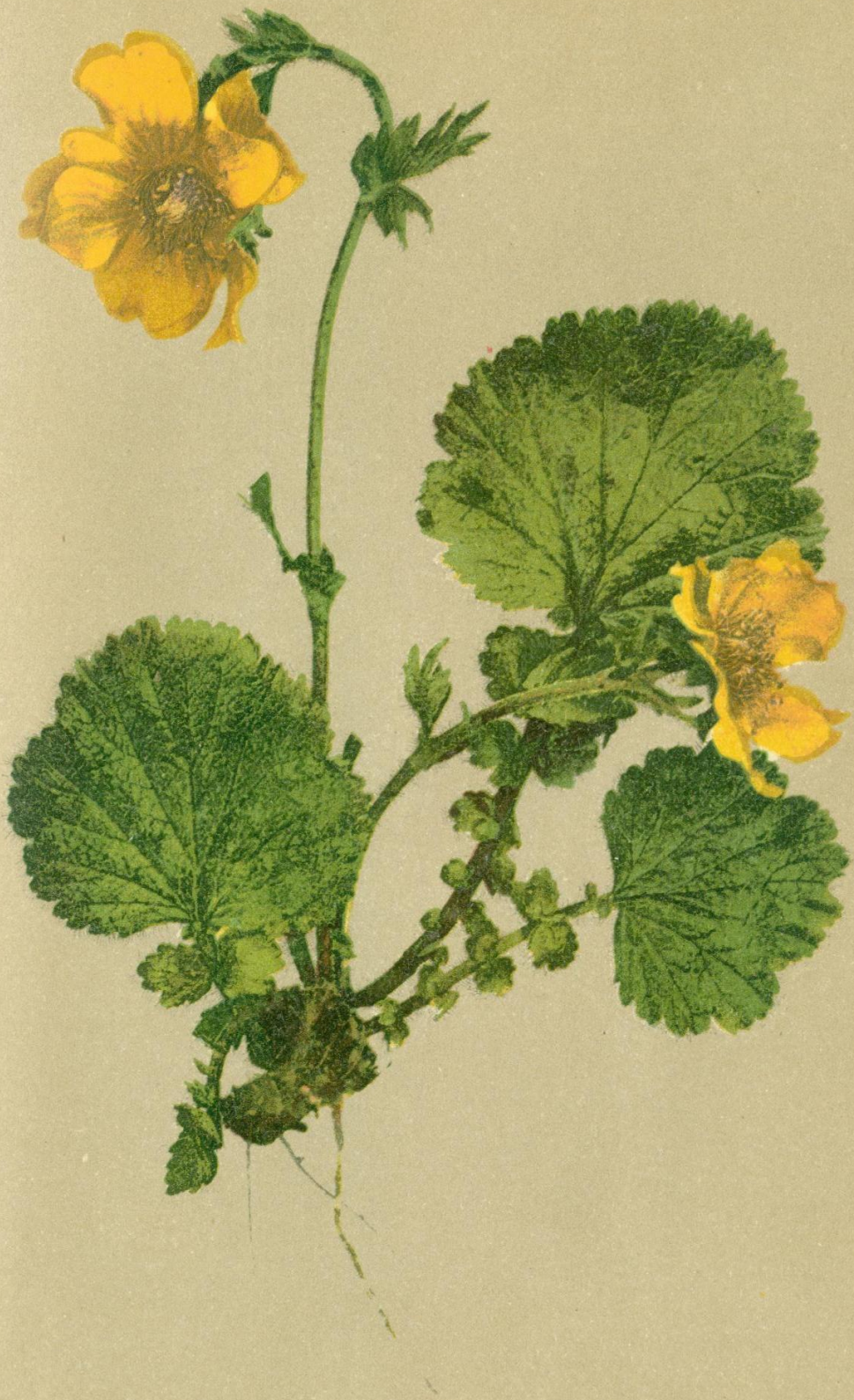
11. Geum montanum L. Berg-Nelkenwurz.