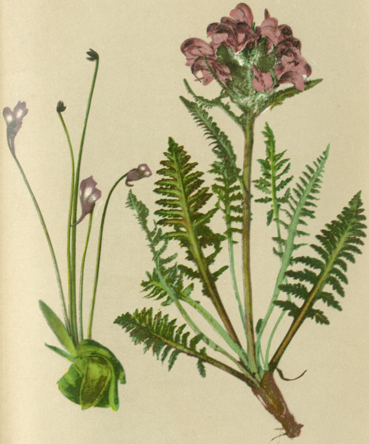
65. Pinguicula vulgaris L. Fettkraut.