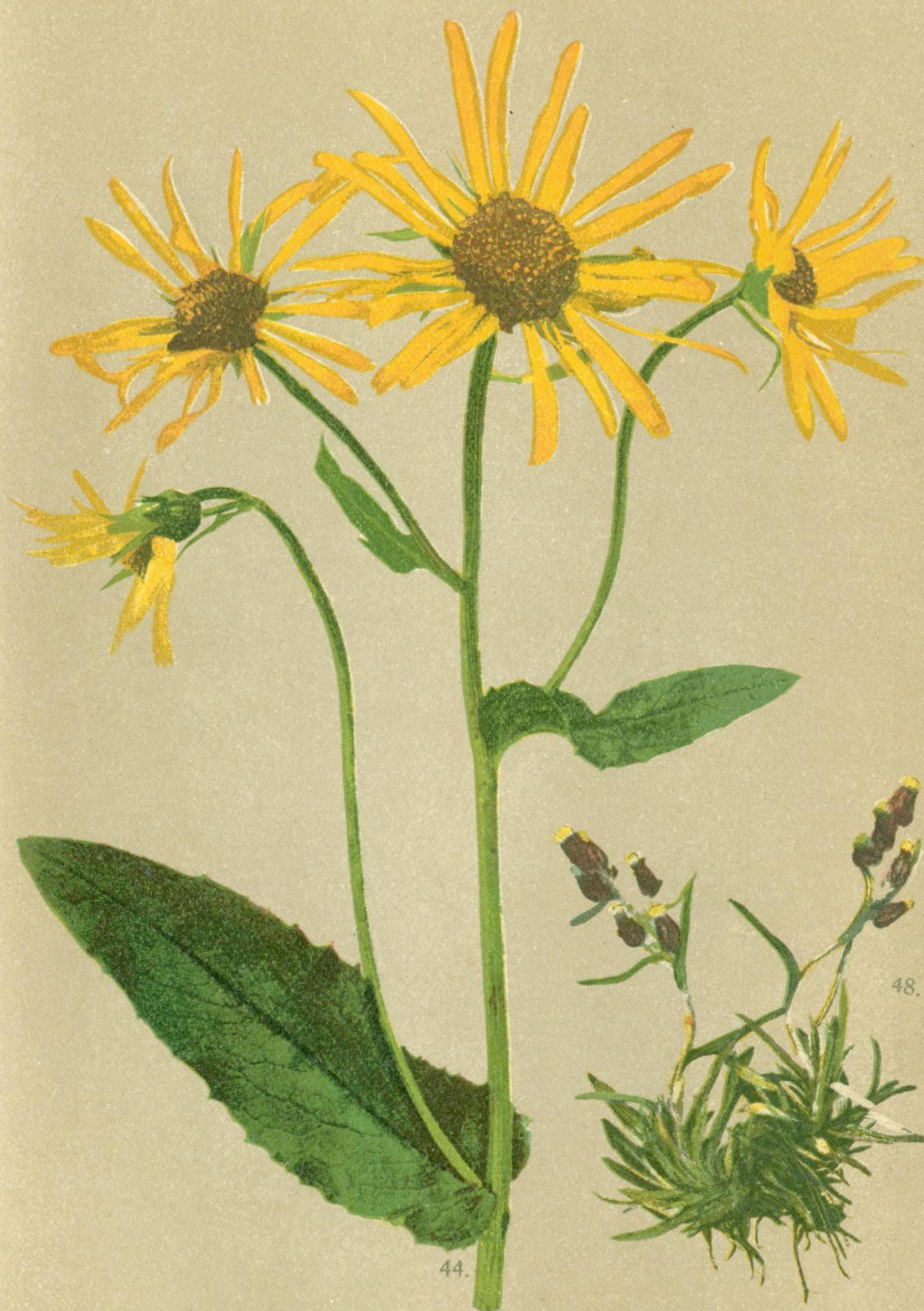
44. Doronicum austriacum Jacq. Gemswurz, Schwalbenwurz.