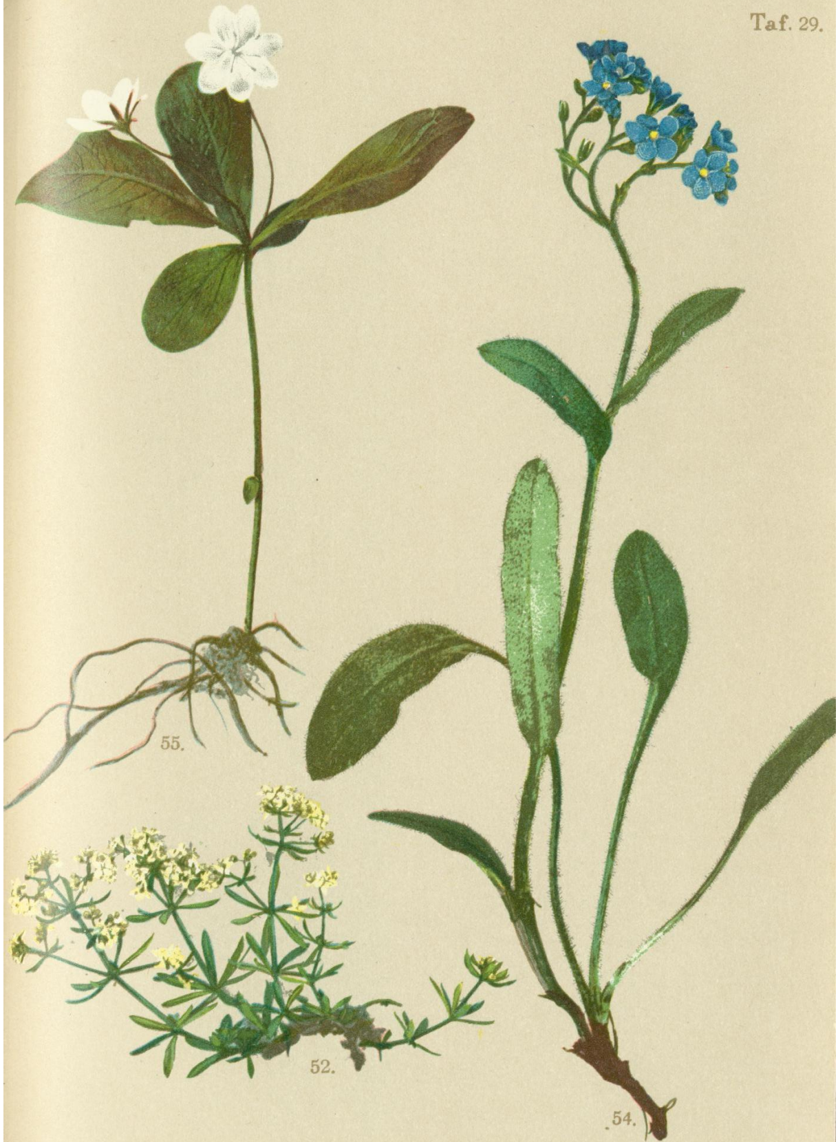
55. Trientalis europaea L. Stiefenstern.