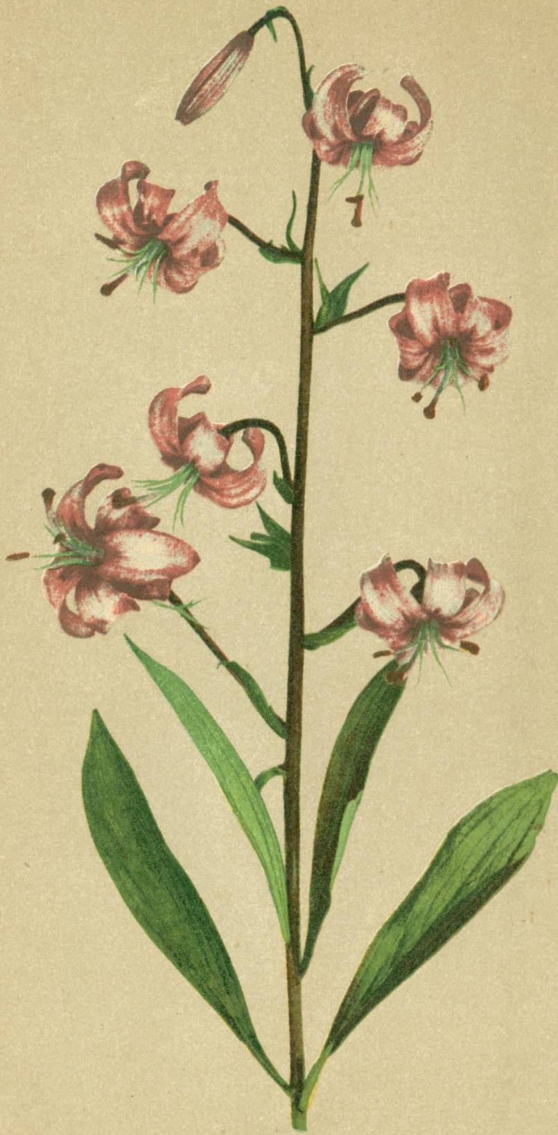
85. Lilium Martagon L. Türkenbund = Lilie.