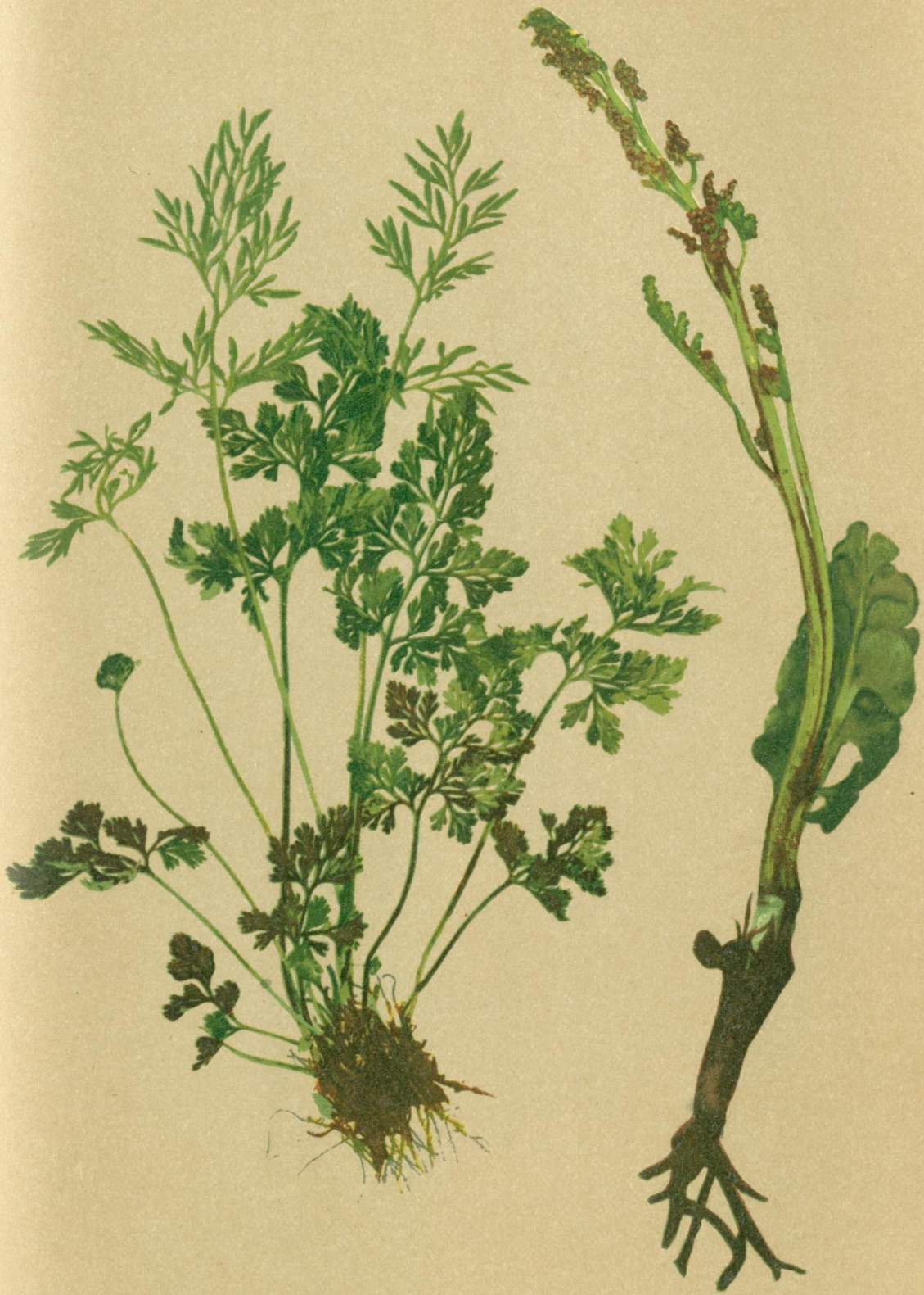
97. Allosorus crispus Bernh. Krauser Kollfarn.