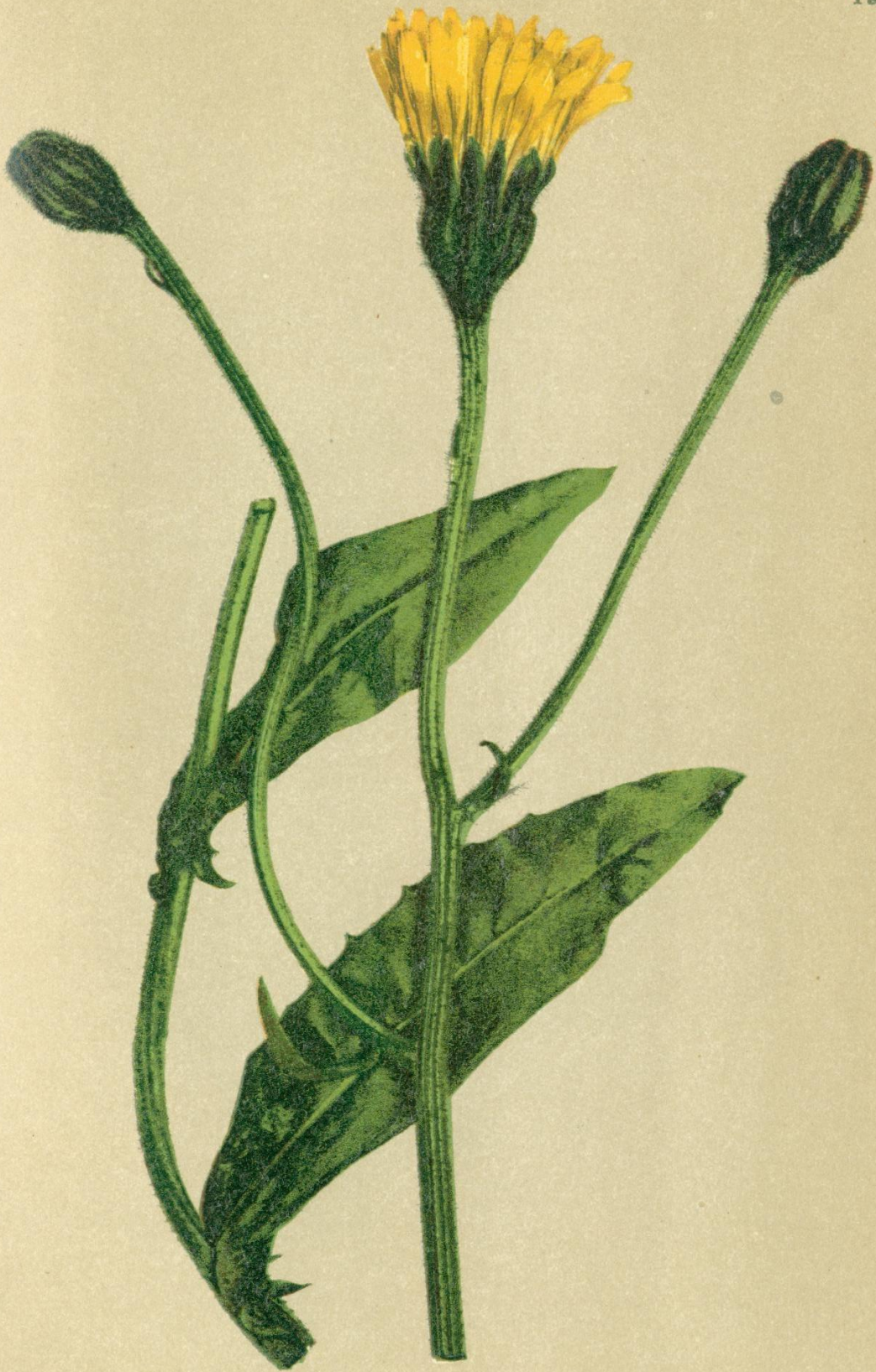
38. Crepis grandiflora Tsch. Großblüttige Grundfeste, Pippau.