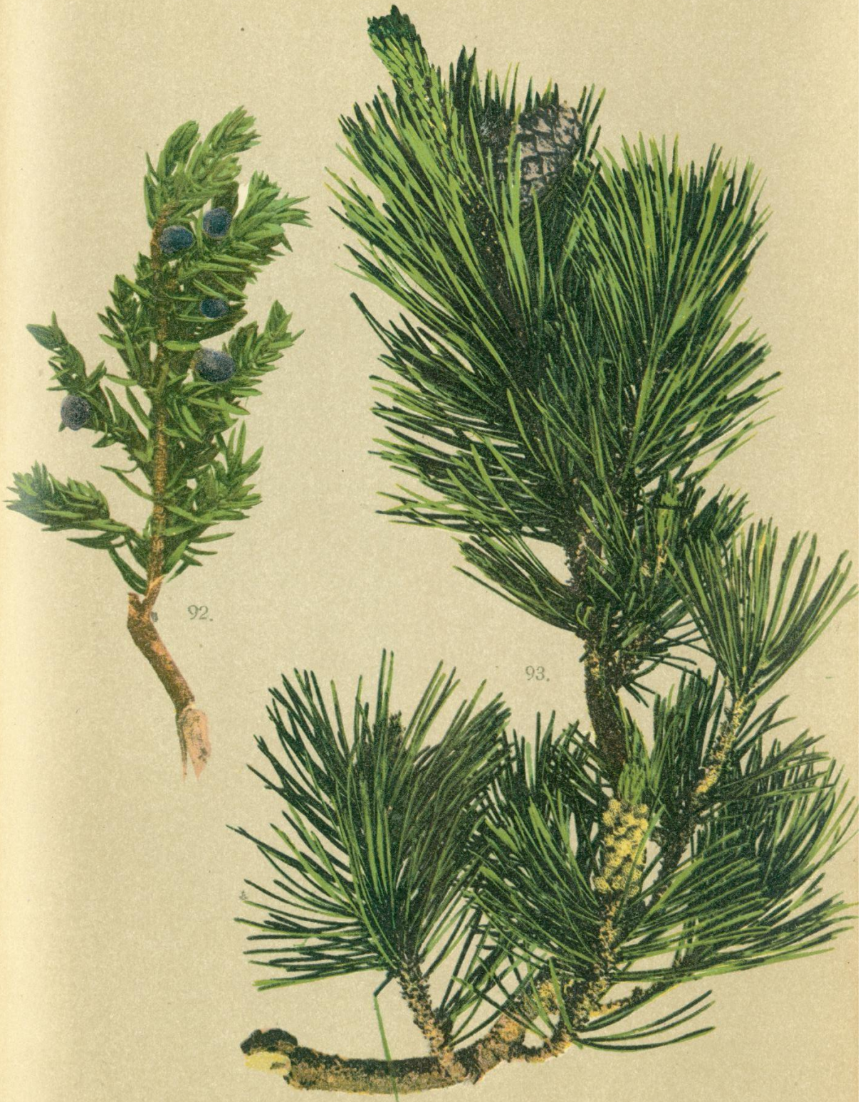
92. Juniperus nana Willd. Zwerg = Wacholder.