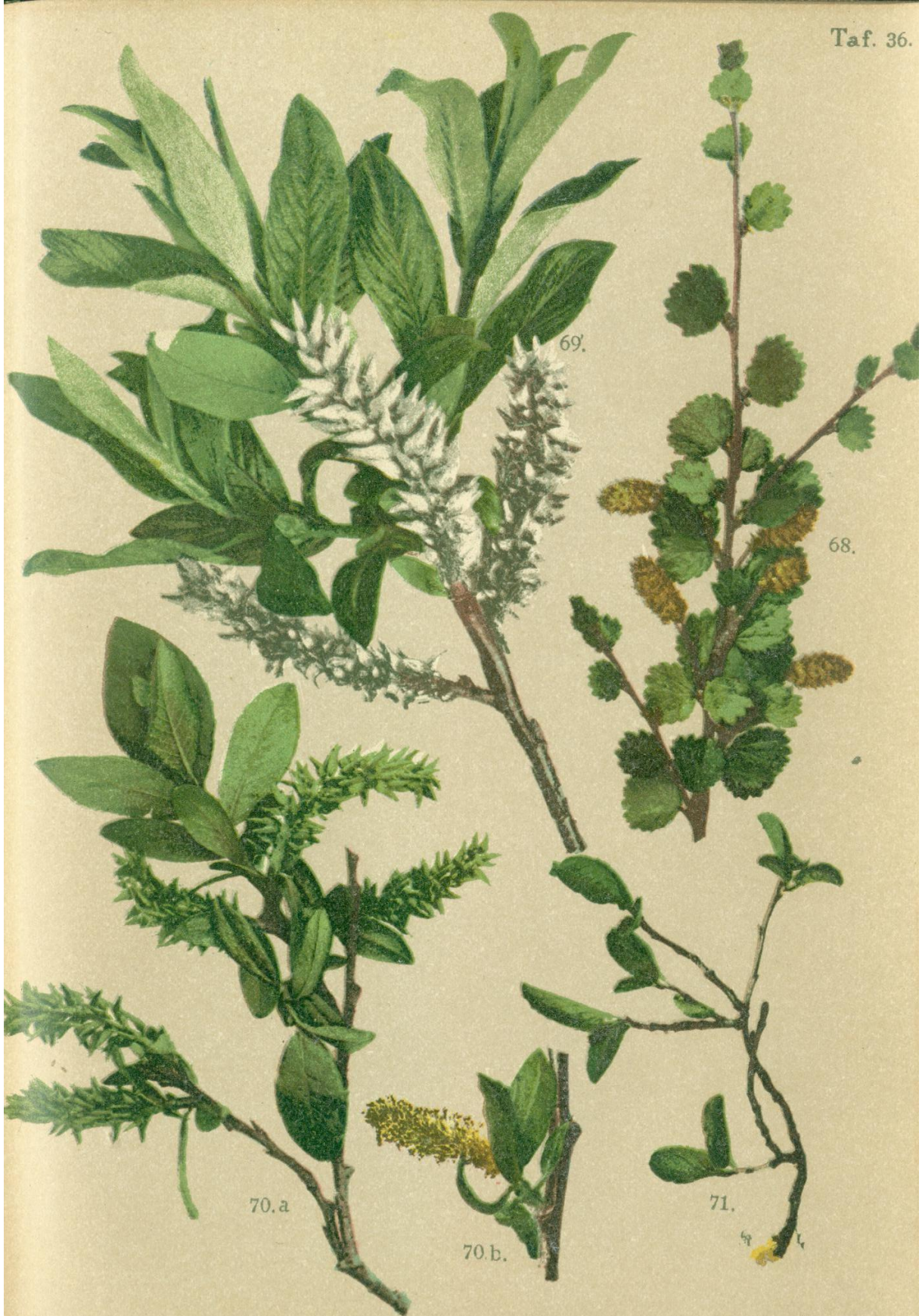
Betula nana L. 69. Salix Lapponum L. 70. Salix silesiaca Willd. 71. Salix herbacea Zwerg-Birke. Lappländische Weide. Schlesiſche Weide. Krautartige Weide.