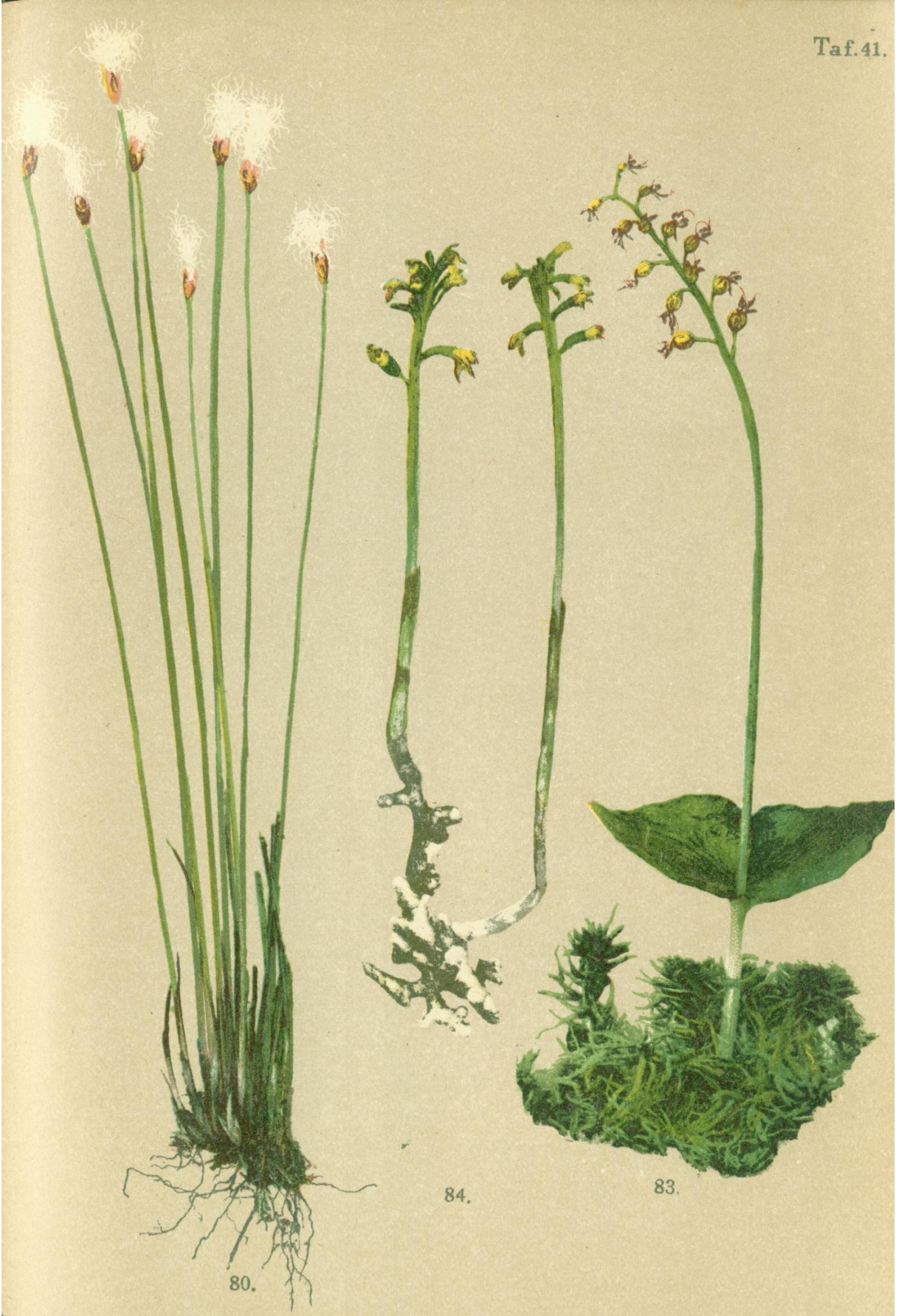
80. Eriophorum alpinum L. Gebirgs-Wollkraut. 84. Corallorrhiza innata R. Br. Korallenwurz. 83. Listera cordata R. B. Herzblättriges Zweiblatt.