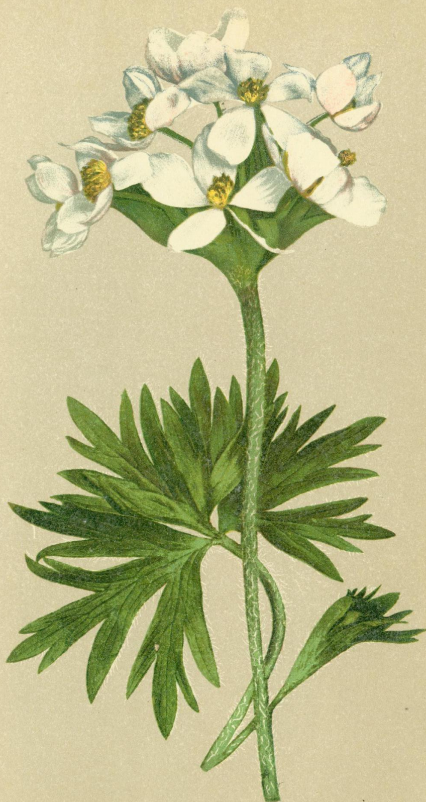
3. Anemone narcissiflora L. Berghähnlein.