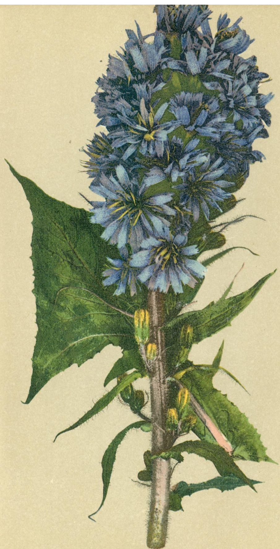
42. Mulgedium alpinum Cass. Gebirgs-Milchlattich.