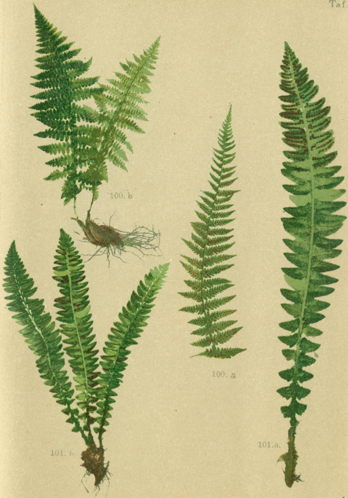
100. Asplenium alpestre Mett. . Gebirgs-Milzfarn.