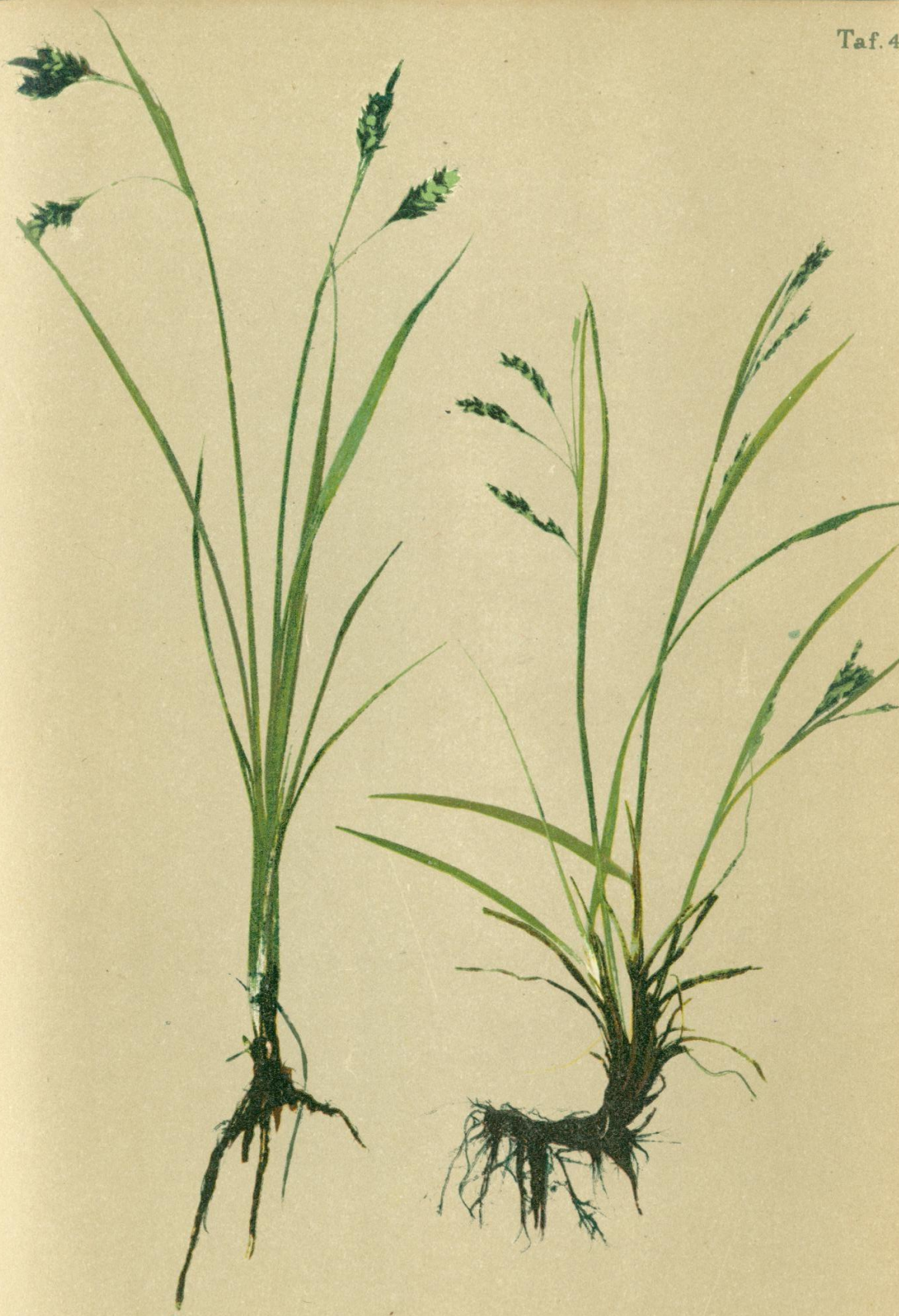
78. Carex irrigua Sm. Gletscher-Segge.