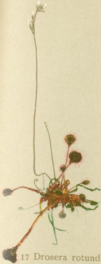
17 Drosera rotundifolia L. Rundblättriger Sonnentau.