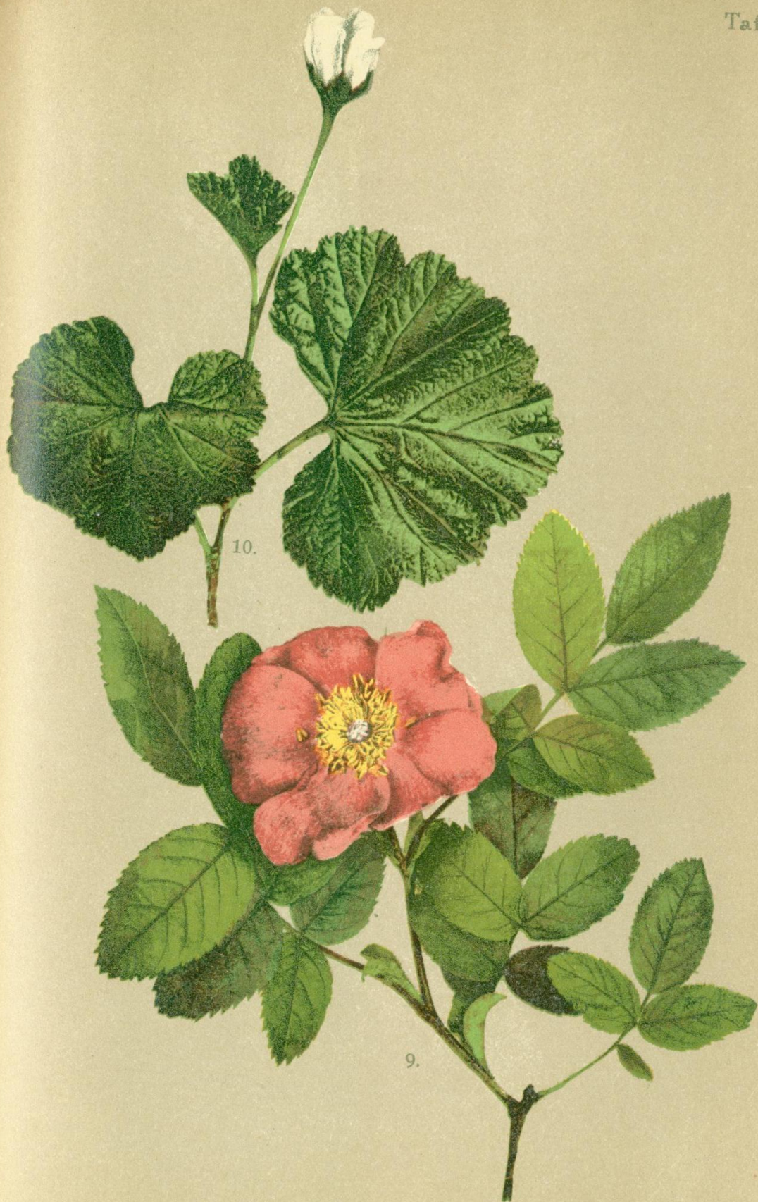
10. Rubus Chamaemorus L. Zwerg-Brombeere, Maultebeere.