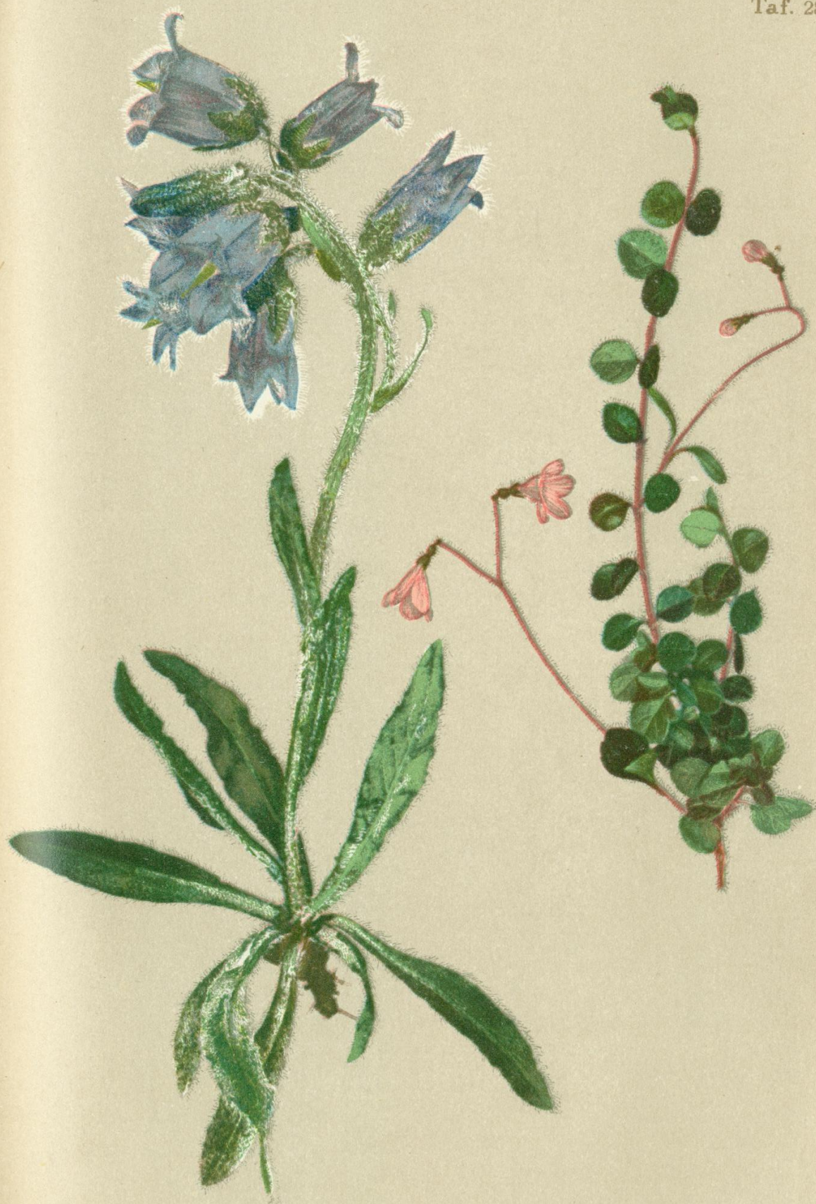
50. Campanula barbata L. Bärtige Glockenblume.