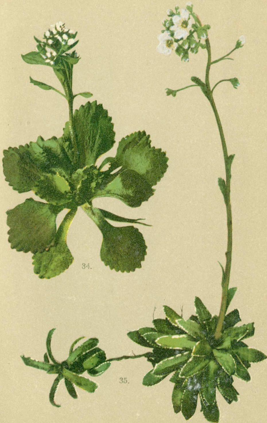
34. Saxifraga nivalis L. Schnee-Steinbrech.