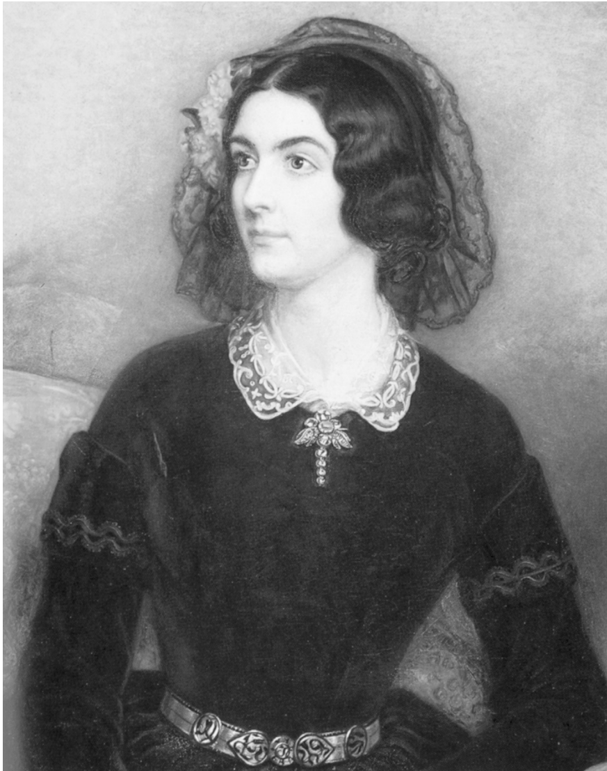
(4) Lola Montez. Gemälde von Josef Stieler, 1847, aus der „Schönheitsgalerie“ Ludwigs I. Bayerische Verwaltung der staatl. Schlösser, Gärten und Seen, München.

Während traditionell die Aufhebung der Hierarchien im Ritual des Karnevals und auch im Entlastungsraum des Lustschlosses die Existenz des Einzelnen, seinen Status sowie die Gemeinschaft insgesamt nie gefährdet, sondern letztlich Ordnung affirmiert, hat das verbotene, weil nachhaltige Liebesspiel Alfonsos für Rahel tödliche Konsequenz. Die Befestigungsrhetorik des Königs – „Doch weiß ich auch, daß eines Winkes nur, / Es eines Worts bedarf, um dieses Traumspiel / zu lösen in sein eigentliches Nichts“, mit Rahels Echo: „Bin ich doch selbst ein Traum nur einer Nacht“ – verweist eben nicht auf das Ende eines gestatteten Exzesses, sondern auf ein tödliches Endspiel.