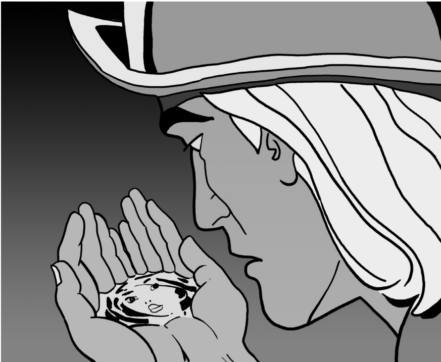
(6) „... das Mädchen, das wir zu lieben glauben, ist nichts als Leinwand, auf welche jene die Farbe aufträgt“ (Grillparzer) – Männerphantasie Pocahontas. Quelle: nach Walt Disney, Undine Productions, 1995

Drama des 19. Jahrhunderts offen – eine Leerstelle, die im Diesseits des Textes nicht mehr verhandelt wird.