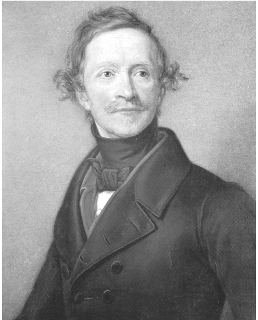
(3) „fiebrig heiß wallte mein Blut“ – Ludwig I. König von Bayern riskierte für Lola Montez die Krone. Portrait auf Porzellan von Carl Wollenweber, um 1840, Münchner Stadtmuseum.

Das Lustschloss „Retiro“ wird unter dem Regiment der Jüdin zu einem „heimlichen“ und verbotenen Ort, an dem der Jude Isak – im eige-