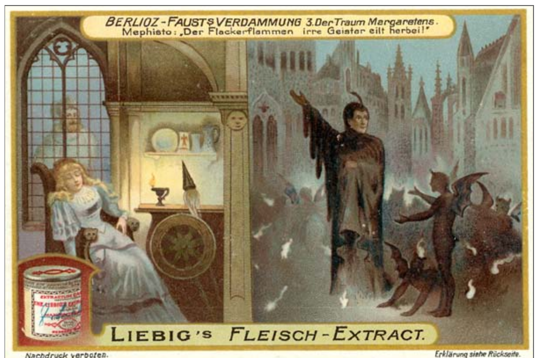
BERLIOZ - FAUST'S VERDAMMUNG