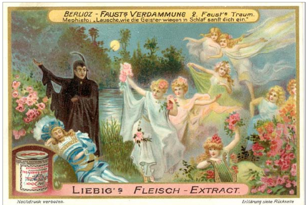
BERLIOZ - FAUST'S VERDAMMUNG