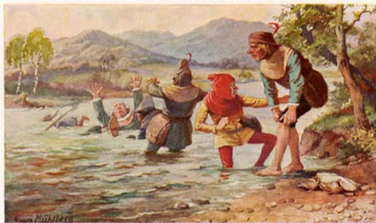
Die sieben Schwaben