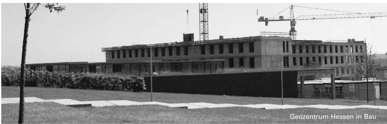
Geozentrum Hessen in Bau

Lesen Sie zum Thema »Campi im Wandel« auch unsere Umfrage auf Seite 6