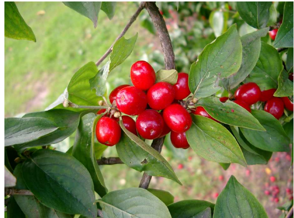
Abb. 7: Früchte (Foto: V. DÖRKEN).