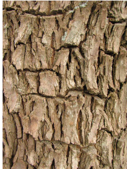
Abb. 3: Borke.