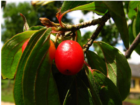
Abb. 6: Frucht (Foto: V. DÖRKEN).

Die länglichen Früchte (Abb. 6 & 7), die wie Kirschen Steinfrüchte sind, sind kräftig rot gefärbt. Manchmal werden Früchte schon im August reif, dann schmecken sie noch recht sauer. Normalerweise erfolgt die Fruchtreife erst im Zeitraum von September bis Oktober. Die Früchte haben dann einen mit Sauerkirschen vergleichbaren Geschmack und eignen sich zur Herstellung von Marmelade, Kompott, Gelee oder Saft. Nach HOMER galten im antiken Griechenland die Früchte als ein begehrtes Schweinefutter. Auch die Gefährten von ODYSSEUS sollen von der Zauberin KIRKE mit Kornelkirschen gefüttert worden sein (BAUMANN 1993).