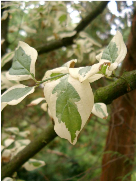
Abb. 2: Cornus mas 'Variegatum' (V. DÖRKEN).