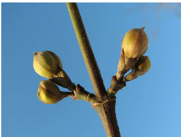
Abb. 4: Blütenknospen im Winter.

Die vegetativen Knospen, also solche, die keine Blüten hervorbringen, sind klein und spitz, während die generativen Blütenknospen dick-kugelig ausgebildet sind (Abb. 4). Diese Streichholzköpfchen-artigen Blütenknospen sind in der heimischen Flora einzigartig und ein wichtiges Bestimmungsmerkmal im winterlichen Zustand.