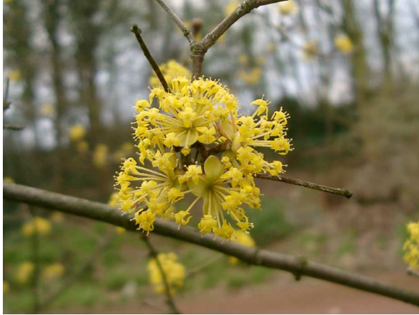
Abb. 1: Blütenstand (Foto: V. DÖRKEN).

Die Kornelkirsche ist ein wertvolles, aber konkurrenzschwaches Gehölz, das bevor die Forsythien in Mitteleuropa eingeführt wurden, den einzigen gelbblühenden Vorfrühlingsblüher darstellte. Sie gehört zu den ersten spektakulär blühenden Gehölzen unserer Gärten. In milden Lagen erscheinen die Blüten bereits im Februar, ansonsten von März bis April (Abb. 1). Je nach Witterungsverlauf hält die Blüte der Blütendolden 2-4 Wochen an, wird jedoch durch Wärme deutlich verkürzt.