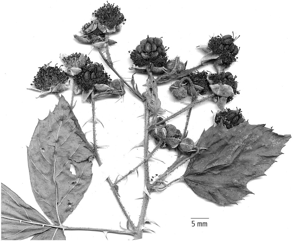
Abb. 2: Rubus ehrnsbergeri . – Oberer Teil des Blütenstands (Exemplar Weber 77.811.1, We)

Blätter 5-zählig [seltener 5-6-zählig], oberseits mit 50-100 (selten mit 15-50) Haaren pro \text{cm}^2 , unterseits grün, \pm samtig weich behaart. Endblättchen lebend oft konvex, mäßig lang gestielt (Stielchenlänge 24-30 % der Spreitenlänge), aus breiter herzförmiger Basis (breit) eiförmig, oft leicht bis deutlich 1-2-lappig (seltener 2-3-zählig), mit etwas abgesetzter, 10-12 mm langer Spitze. Serratur mit scharf zugespitzten Zähnen fast gleichmäßig bis etwas periodisch und dann mit etwas längeren, geraden Hauptzähnen, bis etwa 2-3 mm tief. Untere Seitenblättchen ungestielt. Blattstiel viel länger als die unteren Blättchen, behaart und stieldrüsiger, mit 9-14 geneigten und fast geraden bis leicht