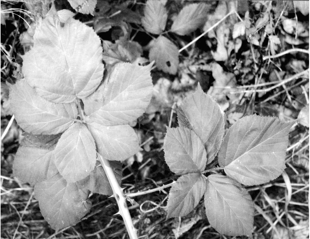
Abb. 3: Rubus ehrnsbergeri . – Östlich von Stadthagen (Niedersachsen, 5.7.2002)

größtenteils 15-20 mm lang, graugrün oder grau, angedrückt kurzhaarig und mit (10-) 20-35 [bis >100] Stieldrüsen von 0,3-0,5 mm Länge sowie mit (3-) 6-14 kräftigen, gelben, schwach gekrümmten, 2-3 [-4] mm langen Stacheln. Kelchzipfel graugrün bis grau, ± bestachelt, stieldrüsiger, nach der Blüte abstehend oder etwas aufgerichtet. Kronblätter weiß, rundlich, unbenagelt, (9-) 11-12 mm lang. Staubblätter mit kahlen Antheren die grünlichen Griffel wenig überragend. Fruchtknoten und Fruchtboden kahl. Blütezeit (Mai) Juni (Juli).