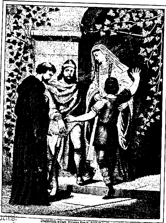
Stahlnach v. Carl Meyers Kunst-Anstalt in Nürnberg.