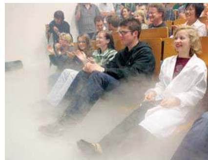
Das Geheimnis der Night of Science: Wer es nicht erlebt hat, kann sich kaum vorstellen, dass sich nachts um 2 Uhr die Menschen in Hörsälen drängeln, um sich Vorträge anzuhören, darunter die inzwischen Kult gewordene Vorlesung ‚Gods of Hellfire‘ (Bild rechts unten). In über 40 Veranstaltungen stellten die Wissenschaftler des Campus Riedberg neue naturwissenschaftliche Erkenntnisse vor, erklärten alltägliche Phänomene und zeigten spektakuläre Experimente. Die ganz besonders Wissensdurstigen hielten bis zum Frühstück um 6 Uhr durch.