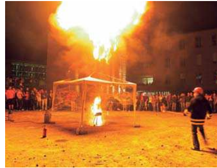
Das Rahmenprogramm bot unter anderem den Start eines Wetterballons, eine Fettexplosion sowie Laborführungen, auch in die große Experimentierhalle mit den Elektronenbeschleunigern. Für viel Entspannung und Partyfeeling sorgten das Catering der Fachschaften und des Studentenwerks sowie die zahlreichen Music-Acts, in denen vorwiegend Studierende und Alumni auftraten.