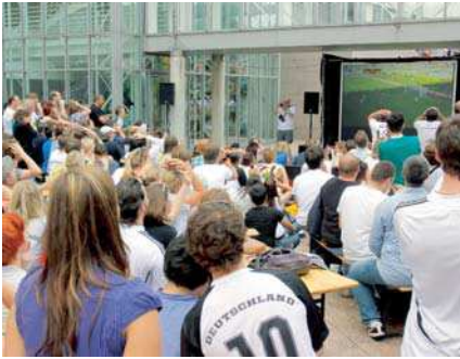
Public Viewing à la Riedberg: Fußball am Nachmittag (linkes Bild), Wissenschaft am Abend mit der Übertragung der Vorlesung des prominenten Astrophysikers Prof. Harald Lesch von der Ludwig-Maximilians-Universität München „Was hat das Universum mit uns zu tun?“.