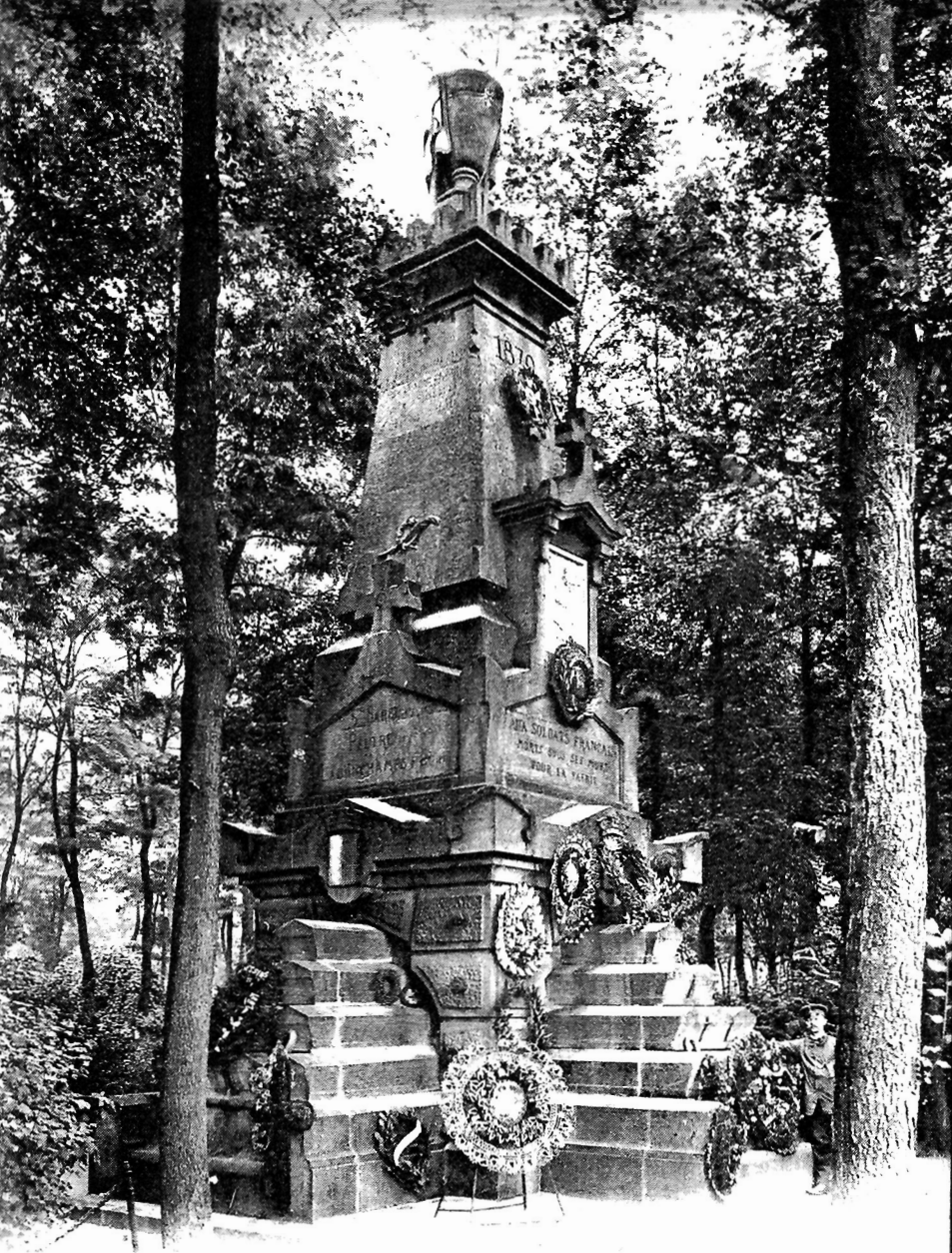
METZ. - Denkmal der 7000 französ. Soldaten auf dem Garnisons-Friedhof Monument des 7.000 Soldats Français au Cimetière Chambière