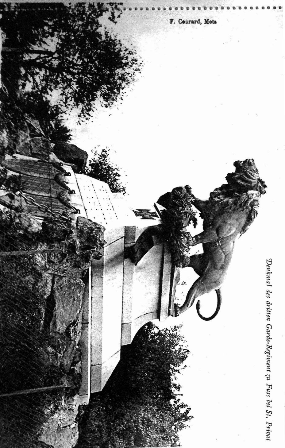
Denkmal des dritten Garde-Regiment zu Fuss bei St. Privat