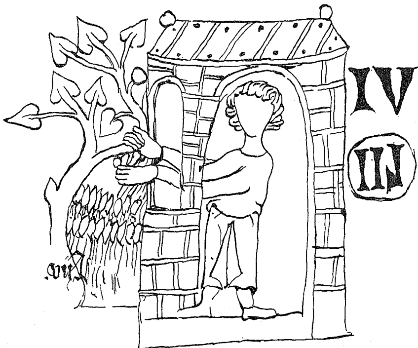
Oldenburg fol. 54 a.

Diess erhellt nicht nur aus einem Vergleich jener Bilder von O mit den entsprechenden in H und D, eventuell W, 1) sondern auch unmittelbar aus einem Bildstreifen in O, wo römische Zahlzeichen in einer Art Spiegelschrift erscheinen. Bei II 44 § 1 (fol. 54a No. 3) fasst ein Mann zum Zeichen seiner Gewere am Gute, mit beiden Händen aus dem Hause herauslangend, den einen Ast eines zweiästigen Baumes an. In O geschieht diess von links, in D fol. 30 b No. 2 von rechts her. Zum Zeichen, dass die rechte Gewere Jahr und Tag gedauert hat, stehen in D rechts hinter dem Hause die Zahlen LI (fehlerhaft statt LII), diese in einem Ring, und darüber VI, d. h. zweiundfünfzig und sechs Wochen. In O stehen die entsprechenden