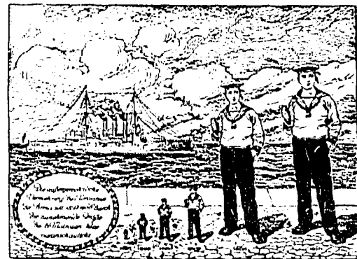
Bestellkatalog, Prospekte, Anordnungs-schreibl., Kostenanschläge Preislisten u. Telegraphenschlüssel auf Wunsch zur Verfig.

Kommanditgesellschaft a. Aktien Hamburg, Hongkong, Canton, Tsingtau, Swakopmund, Lüderitzbucht, Windhoek, Karibib, Keetmanshoop. Proviant, Getränke aller Art, Zigarren, Zigaretten, Tabak usw. unverzollt aus unseren Freihafenlügen erner ganze Messe-Ausrüstungen, Konfektion, Maschinen, Mobiliar, Utensilien sowie sämtl. Bedarfsartikel für Reisende, Ansiedler und Farmer.