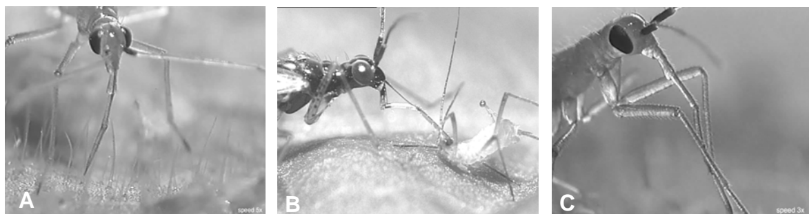
Abb. 1: Standbilder aus der Videodokumentation über Dicyphus errans . A) erstes Nymphenstadium beim Ertasten von Beute, B) Weibchen beim Aussaugen von Macrosiphum euphorbiae , C) zweites Larvenstadium sich den Rüssel mit den Vorderbeinen putzend.

Das Filmmaterial (7:55 h) dokumentiert Verhaltensmuster und Besonderheiten von D. errans . So erfolgt die Lokalisierung von Beutetieren durch tastende Bewegungen der Rüssel- und Tarsi-Spitzen auf der Pflanzenoberfläche (Abb. 1 A). Dementsprechend ist die Spezies der Typisierung nach WOLFRAM (1972) folgend den Tastwanzen zuzuordnen. Beute wird meist nicht zielstrebig, sondern mit den stechend-saugenden Mundwerkzeugen eher zufällig attackiert (Abb. 1 B) und oft nur partiell konsumiert. Während des Saugvorgangs regurgitiert D. errans . Es erfolgt ein wiederholter Reflux von Verdauungssaft in das Beutetier, welches sozusagen „ausgespült“ wird. COHEN (1995) spricht dieser Strategie der extra-oralen Verdauung mehrere Vorteile zu, wie z. B. kürzere Handhabungszeiten, gezielte Nährstoffextraktion, Überwältigung großer Beute, effizienter Speichereinsatz durch dessen Rückgewinnung ohne langwierige Aufbereitungszeiten. So können während eines Beutezuges mehrere Tiere kurzfristig nacheinander getötet und besaugt werden. Häufig schließen sich nach dem Entleeren eines Opfers jedoch ausgedehnte Ruhepausen und/oder ausgiebige Putzzeremoniells an (Abb. 1 C).